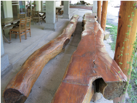
▲照片1 惠蓀林場咖啡園內的台灣相思樹風倒木，樹幹通直，是優良的家具用材。

階段是較佳的。但是環保團體所鍾情的老齡林並非萬能的，在木材生產方面，用材生產是以成熟林階段較佳，生物量生產（燃料材及紙漿材）則以幼齡林階段較佳。碳吸存方面，碳通量的淨生產以幼齡林階段最高。因此，在碳固存上，短輪伐期人工林經營在經濟上是最有利的。但是這並不表示所有人工林都要採用短輪伐期，必須視我們的森林經營目標而定。台灣原生闊葉樹種在未來節能減碳策略上將扮演重要角色。♻️