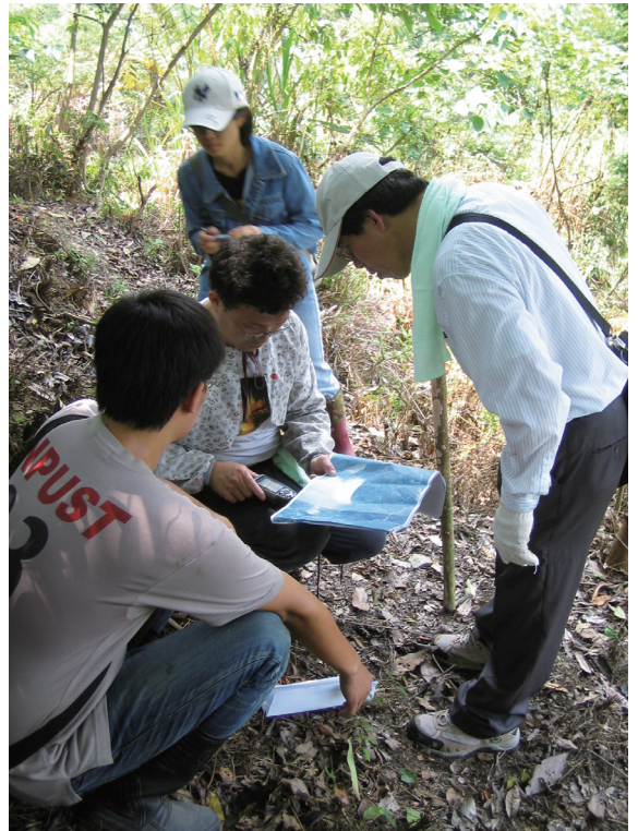
▲查核人員以衛星定位系統（GPS）確定租地坐標位置。

在各林管處及工作站積極宣導推動之下，承租人交回租地之意願逐年提高，每年執行率均超過預定目標；96年至99年4年間預定收回3,000公頃，截至98年底3年間已收回3,496公頃；自92年至98年底，共收回4,674公頃，成果顯著。