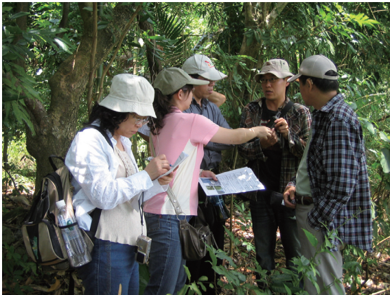
▲查核人員以衛星定位系統（GPS）確定租地坐標位置。