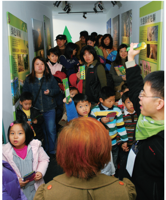
▲在導覽人員生動的解說中參觀民眾反應熱烈。

「玩趣森林」除生態影像展示外，林務局也與國家書店合作展出包括生態旅遊、自然風情、步道、海洋生態等12大主題書籍及影音出版品，影像、聲音、文字一應俱全，來一趟必能滿載而歸。展期假日期間，特別邀請名人專家與觀眾談天說地，分享大自然趣談；另搭配親子互動DIY活動，玩創意葉拓做葉脈書