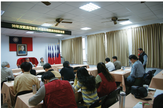
▲聯繫會議針對觀霧國家森林遊樂區經營、林業政策執行與森林巡護等議題進行討論。

林務局新竹林區管理處為聯繫轄屬觀霧地區相關單位業務執行，於99年1月21日邀集雪霸國家公園管理處、雪霸國家公園警察隊、森林暨自然保育警察隊等單位在辦公室3樓禮堂進行聯繫會議，在新竹林區管理處處長