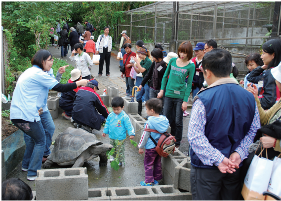
▲參加人員的分組活動。

擔任總指揮，一開始即期勉參與員工及美善善盡社會公民的責任，不參與野生動物非法貿易及飼養保育類野生動物，另動物園特別開放野生動物收容中心及兩棲爬蟲類動物館（該收容中心不對一般遊客開放），並透過近距離接觸及動物一日志工等體驗活動，瞭解野生動物保育及收容業務，另外，還參觀最夯的貓熊館及DIY親子活動。