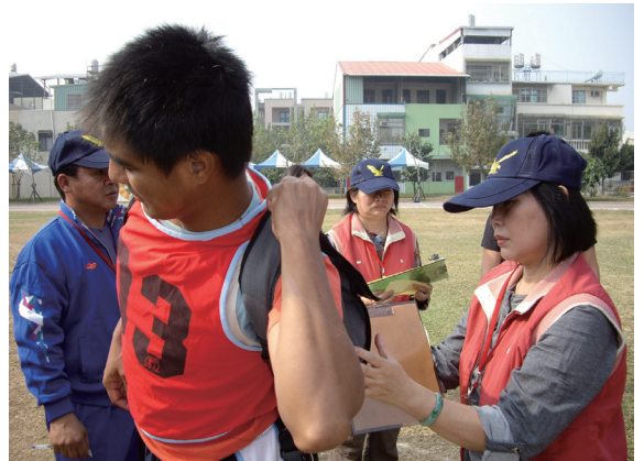
▲屏東林區管理處試務人員幫考生調整沙袋，整裝待發。

為了加強乾燥季節森林巡護工作，這次招考的防火巡邏隊員，將來必須要在第一線從事森林保護的工作，因此，體格健壯，能耐