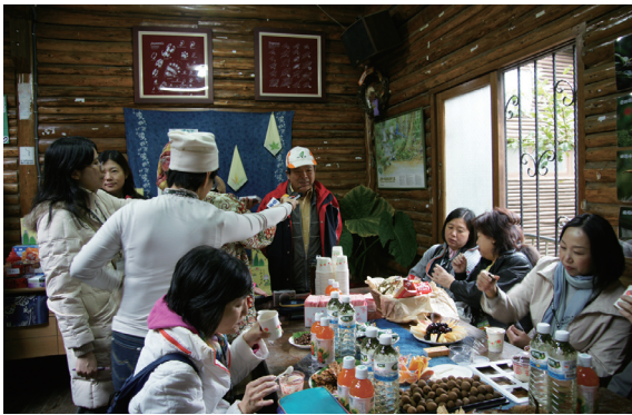
▲記者朋友親身體驗與森林植物有關的在地藍染文化 DIY活動。(攝影／新竹林區管理處 朱懿千)

活動的媒體朋友們在大自然與歷史人文的洗禮中，挖掘出更多優質且膾炙人口的報導媒材。 (新竹林區管理處 朱懿千)