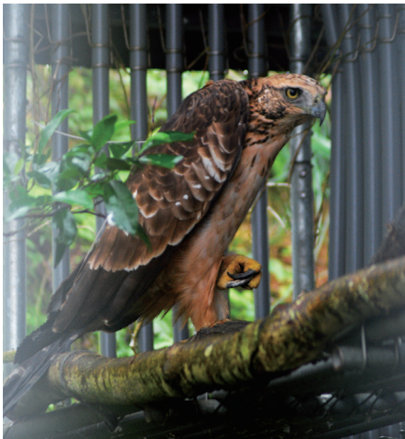
▲熊鷹（烏來）僅在野放籠中來回振翅，並未飛離籠舍，將等待更好的時間點再振翅於大自然。

97年，一隻被十字弓箭射中胸口的熊鷹，在烏來山區被林務局巡山員發現，經林務局緊急聯繫，將當時垂危殆死的熊鷹送往動物園急救，在獸醫師全力搶救下成功救回牠的性命。然而，康復後的熊鷹失去飛行的能力，