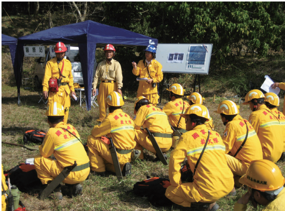
▲屏東林區管理處於恆春事業區25林班進行防火演練。(攝影/屏東林區管理處 黃俊明)

熟悉狀況，訓練工作站救火隊熟悉林火防災、救災SOP，提高真實火災發生時之救火效能。 (屏東林區管理處黃俊明)