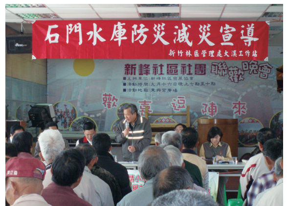
▲新竹林區管理處賴處長親自解答民眾的疑問與困難。

林務局新竹林區管理處為宣導林業政策，於99年1月27日於大溪鎮新峰里里民活動中心召開傾聽民眾聲音及林業政策說明會，會中新竹林區管理處賴聰明處長親自面對民眾溝通林務局林業政策執行目標及方針，傾聽在地民眾及承租人的疑問與困難，並逐一解答及說明，讓承租民眾能確實瞭解林務局