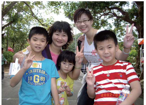
▲全家一起參加定向運動，大朋友及小朋友都好開心。

所有人帶著地圖及控制卡，一起倒數5、4、3、2、1，出發定向去！根據地圖中的等高線、地形地物標示，找到正確的點，再行釘孔，根據點的正确性及所花費的時間進行