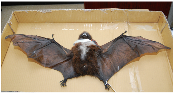
▲台灣狐蝠標本。