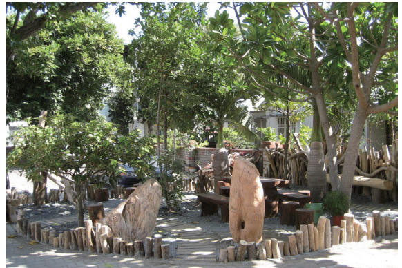
▲恆春工作站利用漂流木作為庭園造景。

八八水災在南部降下強大豪雨，大量漂流木所產生的處理問題，成為最為棘手之課題。林務局近來積極籌劃如何利用漂流木之