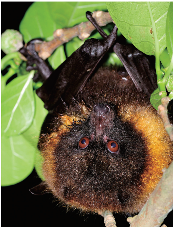
▲覓食中的台灣狐蝠。

年的密集調查，發現龜山島的台灣狐蝠相當活躍，且族群數量也算穩定。研究人員每次登島進行夜間調查從未「白跑一趟」，均可順利觀察到台灣狐蝠活動，包括繞飛、在樹上倒掛休息、理毛、覓食、排泄、鳴叫、以及個體間互動等行為，這些生態紀錄都是國內保育界的首次發現，極為珍貴。