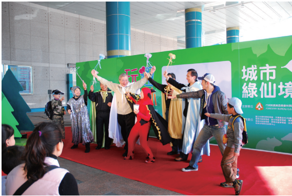
▲在鞋子兒童劇團表演的希望森林保衛戰中，揭開玩趣森林活動序幕。

讓參觀民眾蹲著看、踮腳看、探頭看，體驗並認識棲息於森林裏不同高度的動植物。在「草地放大鏡」中彷彿進入了縮小隧道，比人還高的小草中躲著各式各樣的地被昆蟲與動物；「與動物同棲」的灌木叢迷宮，則有從低海拔到高海拔林間常見的動物影像，配合著動物鳴叫聲，高高低低地出現在枝梢、樹叢中；「雲端漫遊」讓您如鳥兒翱翔於天際，體驗從高空俯瞰台灣山岳之美；「林業隧道」則讓你一窺台灣林業的過往與現今的發展軌跡；運用了富有韻律感及繽紛豐富的大自然元素，展出「彩之心」及「蝶之心」的特展區，將大自然的美妙顏色幻化成螺旋，讓來訪的參觀民眾徜徉在美麗的視覺感官中。