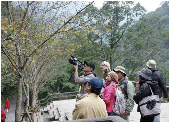
▲記者朋友體驗賞楓觀瀑森林浴的大自然健身活動。