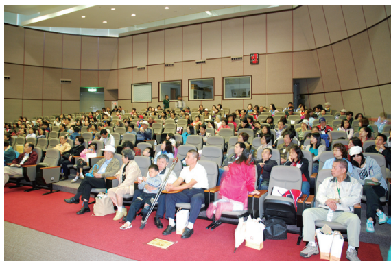
▲「熊熊遇見林，動物生態參訪之旅」熱情參與的同仁及美眷。