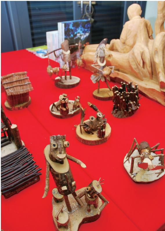
▲記者會現場展示活動期間所累積的豐碩成果。

林務局2009年國家森林遊樂區行銷宣傳系列活動「森動台灣—樂活健康深度遊」成果記者會，於98年12月23日在台北市NGO會館舉行。為期7個月的系列精彩活動共分為五大主題，包括在全台各地國家森林遊樂區舉辦40場主題、DIY及生態體驗等實體活動與網路活動，獲得民眾熱烈響應。