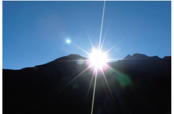
▲越過霧頭山的晨旭，是阿禮部落獨有的美景。

同樣的過程在阿禮部落進行，卻一年就可完成基本雛型。正當大家興高采烈地準備迎接阿禮部落生態旅遊起跑時，民國98年8月8日莫拉克颱風帶來2,000多毫米的大雨，洪水不但使得霧台鄉多處地段成為土石流危險區，