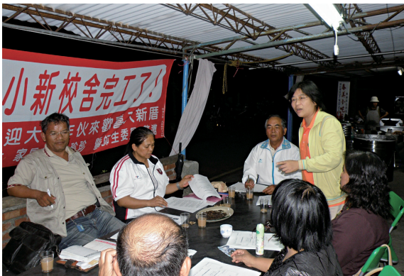
▲夜間，在阿禮部落召開的生態旅遊工作會議。