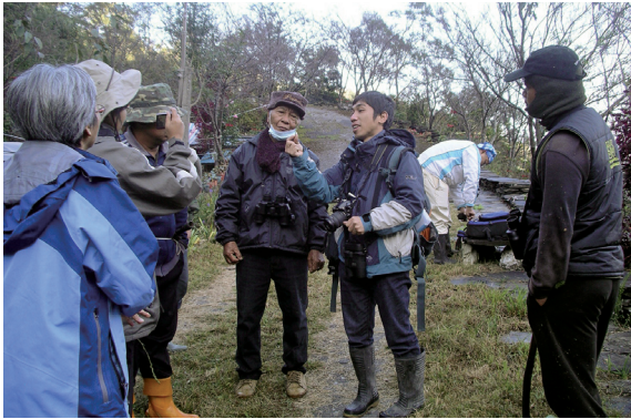
▲解說戶外課實作，族人不畏風寒，聚精會神的聆聽。