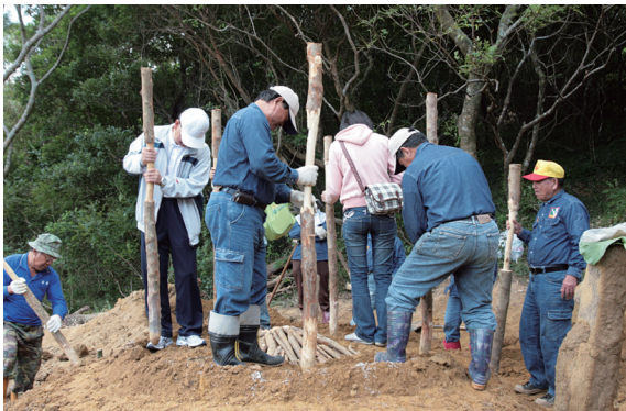
▲鼓勵發展舊有文化－木炭窯製作。