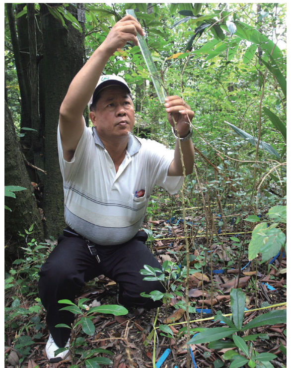
▲解說員參與國有林班地的小苗監測。

由於社頂部落位於墾丁國家公園的核心位置，緊鄰社頂自然公園、高位珊瑚礁保留區、梅花鹿復育區、墾丁國家森林遊樂區、試驗林地及國有林班地。調查發現，社頂地區無論是植物、動物、地質、人文、景觀都