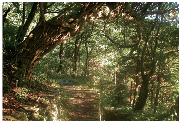
▲生態步道，裡面盡是逗趣的故事，還有無數棲息在此的動植物。