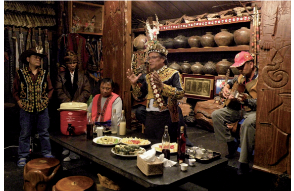
▲頭目正訴說著源遠流長的阿禮傳說。