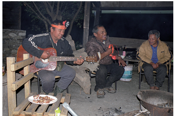
▲生態旅遊遊程的夜間開懷歌唱，聽得見阿禮部落魯凱族的樂天與歌喉。