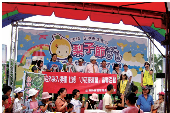
▲東勢林區管理處7月24、25日，配合后里鄉公所梨子產業行銷活動，宣導剷除林木綠癌—小花蔓澤蘭及拒絕嚼檳榔。

林務局東勢林區管理處99年7月24、25日，配合后里鄉公所梨子產業行銷活動，宣導剷除林木綠癌—小花蔓澤蘭及拒絕嚼檳榔，讓后里鄉親及遊客數百人，一起來為保護地球、