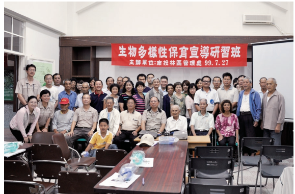
▲參加研習班全體學員合影。

個個神采奕奕，反應熱絡，互動良好，頗受參與學員好評；除增進當地居民對該區內生物資源狀況、生物多樣性保育認知外，並結合鄰近地區住民文化及社區意識，共同維護當地生物多樣性資源，及結合當地政府機關搭起推動生物多樣性保育之橋梁。（南投林區管理處 蔡碧麗）