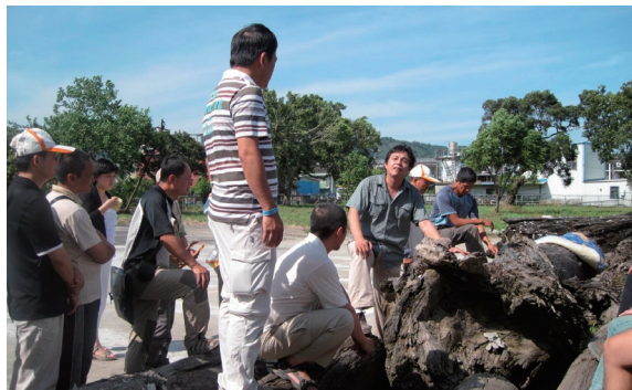
▲漂流木材樹種辨識檢尺講習訓練。（攝影／新竹林區管理處 許曉琪）

樹種辨識檢尺講習訓練，特聘請對木材鑑識學有專精的國立中興大學森林學系黃健能博士授課，透過黃博士深入淺出的講解，提高漂流木木材辨識專業能力，加速現場處理漂流木速度。（新竹林區管理處 許曉琪）