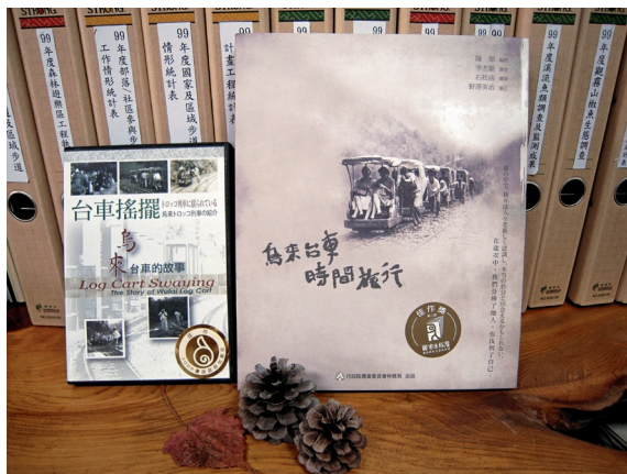
▲「台車搖擺－烏來台車的故事」DVD與「烏來台車時間旅行」。

林務局新竹林區管理處出版的「台車搖擺－烏來台車的故事」DVD榮獲「2008年優良政府出版品獎」佳作，該DVD是部記錄烏來台車的歷史紀錄片，擁有非常多珍貴的歷史片段。2009年出版的「烏來台車時間旅行」