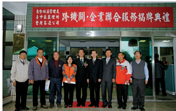
▲東勢林區管理處與台中區監理所豐原監理站、豐原客運公司，於東勢林區管理處梨山工作站成立業務跨機關聯合服務處。

林務局東勢林區管理處與台中區監理所豐原監理站、豐原客運公司，於東勢林區管理處梨山工作站成立業務跨機關聯合服務處，該服務處成立近三個月，服務鄉民49人