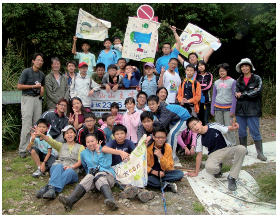
▲「21世紀少年—森林狂想營」學員與八仙山自然教育中心工作人員於八仙山主峰合影

林務局東勢林區管理處為了即將升上6～9年級的莘莘學子，特別在炎熱的暑假提供一個提升身心潛能的好機會，99年7月20～24日在八仙山自然教育中心辦理「21世紀少年—森林狂想營」活動，參與活動的27名學員藉由5天4夜探索大自然的過程與趣味遊戲，學習培養團隊合作默契、體驗爬樹樂趣、進行生態尋寶、夜賞星空、聆聽大自然音樂會。7月23日當天，27名學員不畏路途崎嶇遙遠，全部成功攀上高達2,366公尺的谷關七雄之首—「八仙山主峰」，為今年夏日留下最深刻美好的回憶。（東勢林區管理處 高貴珍）