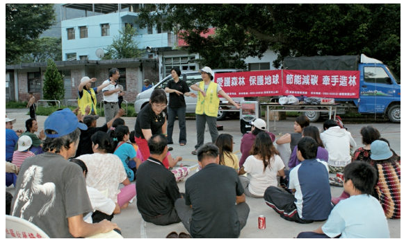
▲東勢林區管理處在象鼻部落舉辦「愛護森林，節能減碳」聯誼活動。

林務局東勢林區管理處日前分別在梅園、士林、象鼻及桃山部落舉辦「愛護森林，節能減碳」聯誼活動，除部落居民外，並邀請當地派出所一同參與活動，讓居民更加了解愛護森林資源的重要及如何保護森林，並傳達防止盜伐、盜獵及竊取林產物的理念。這四個原住民部落與「雪山坑溪野生動物重要棲息環境」相鄰，希望透過宣導活動，將保育觀念融入部落，呼籲部落共同守護森林資源。另為拉近居民距離，特別安排歡唱、有獎徵答、快樂談森林等活動與部落居民分享彼此對森林的愛語，期盼與部落牽手共同守護這片山林，並建立共存共榮的夥伴關係。（東勢林區管理處 楊婉辰）