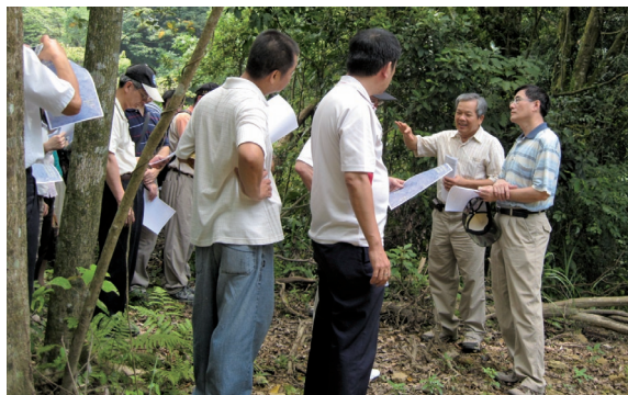
▲板橋地方法院檢察署檢察官與警察機關及相關單位共同勘查盜伐案件現場。

台灣板橋地方法院檢察署99年7月8日召開督導「查緝國土保護案件會議」，由林務局新竹林區管理處帶領該署檢察官、警察機關及相關單位，共同勘查盜伐案件案發現場，並共同研議討論，加強日後檢、警、林