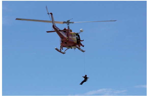
▲台東林管處與特種搜救隊台東分隊等救災單位共同辦理「森林火災陸空聯合防救演練」教育訓練。

林務局台東林區管理處為提升救火效能，99年7月13日邀請內政部空中勤務總隊第三大隊第三隊及內政部消防署特種搜救隊