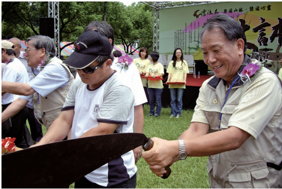
▲所有與會來賓共同為本活動拿起斧頭象徵「福聚聚福」象徵走出八八悲情，築起希望，用愛讓大家「福聚」且「聚福」。

務局屏東林區管理處推動「漂流木多元利用計畫暨林業保育宣導系列活動」，99年7月17日在屏東科技大學集結雕刻好手及工作室現場表演，讓民眾見識大師級鬼斧神工。活動內容包羅萬象，包括架設漂流木利用網站、編撰自然生態教材、舉辦林業實務體驗學習活動、林業寫生活動、雕刻競賽、漂流木裝置藝術設計競賽、開設木藝技能培訓班及漂流木專題研討會等，讓漂流木之生命得予延續融入生活中。