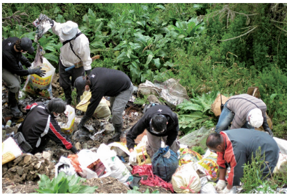
▲以實際行動清理廢棄物，呼籲民眾維護環境衛生。 （攝影／東勢林區管理處 劉曼貞）

林務局東勢林區管理處99年6月1日在梨山華岡地區辦理淨山活動，以實際行動呼籲民眾共同維護德基水庫集水區環境衛生，還給大台中地區居民一口潔淨的水。活動當天，東勢林區管理處邀集南投林區管理處、參山國家風景區管理處等，共36人一起淨山。上午9點從舊華岡派出所出發，一路沿著翠巒產業道路至華岡圓環，直到下午3點，共清理約7立方公尺之廢棄物。（東勢林區管理處 劉曼貞）