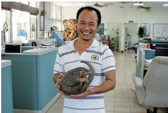
▲民眾拾獲穿山甲送至新竹林管處大湖工作站。(攝影/新竹林區管理處 許文昭)

心。新竹林管處同仁接獲時，立即查看穿山甲身體狀況，初步觀察並無明顯外傷，遇人外力時，卷縮成圓球保護狀態，足見該隻穿山甲為健康成體，隨即專人護送至苗栗縣農業處進行安置、野放。(新竹林區管理處 許文昭)