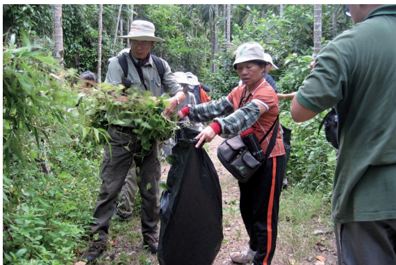
▲在工作假期中邊運動、邊旅遊、認識新朋友，大家一起為社會及大自然服務。（攝影／屏東林區管理處 廖育揚）

本次的工作假期，眾人一起在大自然中工作，除了可體驗自然、舒展身心，並為自然環境付出，亦可與志同道合的朋友們連絡感情、分享心得。往後希望透過類似的活動，招募到更多愛護自然的朋友，一起在工作假期中邊運動、邊旅遊、認識新朋友，一起為社會及大自然服務。（屏東林區管理處 廖育揚）