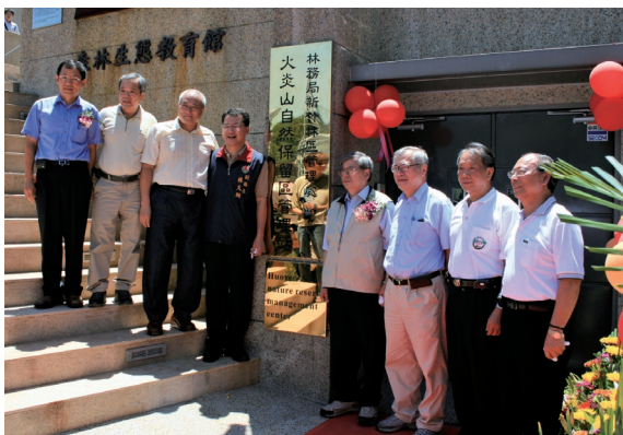
▲與會長官共同揭幕，見證歷史的一刻。

啟用典禮活動當天，林務局局長顏仁德、副局長李桃生、羅東、南投林管處等友處、在地立法委員徐耀昌、康世儒、苗栗縣林副縣長久翔、三義鄉長、苑裡鎮長等各界長官、媒體朋友及當地小朋友共同見證歷史的一刻。（新竹林區管理處 周文鄧）