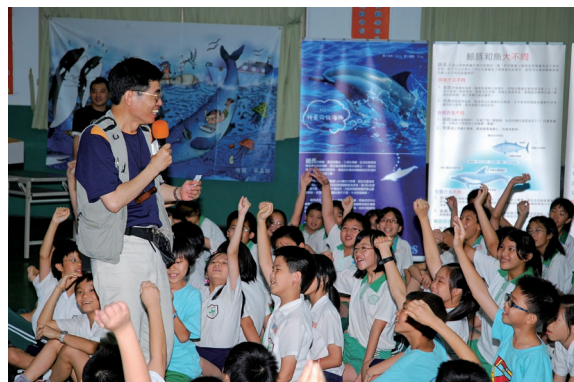
▲海豚的圈圈鯨豚生態影片首映會，小朋友熱烈參與鯨豚生態問答。

黑潮海洋文教基金會96年以「海豚的圈圈」鯨豚影片拍攝計畫獲得林務局「自然生態影像紀錄補助實施要點」近100萬元的補助。歷經兩年多的努力與拍攝，收錄台灣花蓮海域多種鯨豚影像。影片主要是呈現台灣東部海域經常出現的飛旋海豚和花紋海豚的水中活動，群起躍動於海面，展現高超迴旋空中的壯觀畫面，讓人不得不佩服其優雅、柔軟的姿態與敏捷的身軀。此外，弗氏海