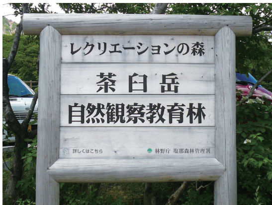
照片13 那須町的自然觀察教育林

增加之趨勢，1969年時，事業所有1,213家，從業人員有7,945人，到2006年時，事業所已增至1,701家，從業人員也增至13,709人。大體而言，那須町的工商業並未因人口的流失而造成產業下滑之現象，反而有逐漸好轉之趨勢，不過若再細究事業所分項時則可知，其實有許多行業在經營上已日益困難，呈現不增反減情況。例如建設業及製造業，其事業所及從業人員有逐年減少之趨勢，1991年時，建設業事業所有216家，從業人員為1,288人，到了2004年時，事業所有208家，從業人員只剩1,081人；同樣地，1991年時，製造業事業所有154家，從業人員為2,584人，但到了2004年時，事業所