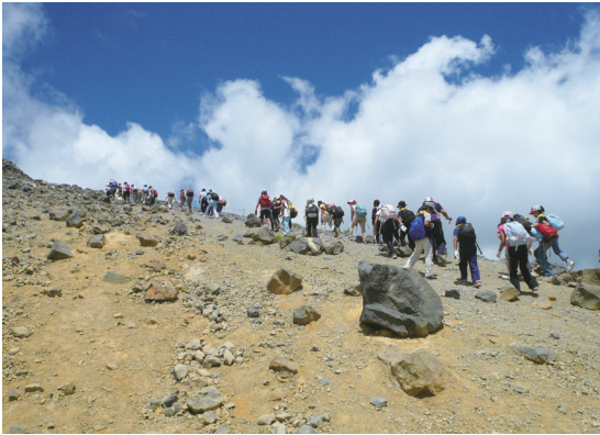
照片10 許多遊客攀登那須岳

化、老齡化、農林業後繼者不足、耕作放棄地增加、小學廢校或整編、地域的相互扶助機能衰退等。有鑑於此，第五次總合計畫提出希望將大子町發展成住得舒服、有活力及美麗的城市三大目標，藉由外部活力的導入，促進內部的活性化，並提出7項重點戰略，包括：子育支援推進、健康長壽社會的推進、學校教育的充實、雇用場域創出推進、農林業所得向上、觀光交流推進、環境保全推進(大子町，2010)。在上述基本構想下，再針對前5年擬定基本計畫及實施計畫。