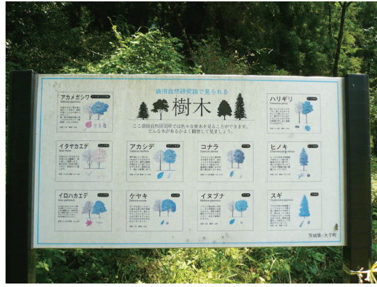
照片4 步道解說牌清楚詳細

大子町的家戶數也逐年減少，1955年時尚有7,779戶，但到2005年時則只剩7,337戶，達到歷年來最低值，2010年時家戶數略有增加，達到7,784戶(大子町企画觀光課，2010b)。如果將總人口數除以家戶數，1955年時其值最高為5.54，之後就一路下滑，2010年時最低為2.67。此數值反映出大子町的家戶人數逐年減少，原先三代同堂的大家庭，逐漸被小家庭所取代。另外，在人口組成方面，2005年時，0-14歲、15-64歲、65-74歲、75歲以上人口比例依序為10.8%、55.0%、15.7%、18.5%，但到2020年時，預估其比例將為7.0%、48.5%、20.1%、24.4%，生育率下降，少子化及老年化情況相當嚴重(大子町，2010)。