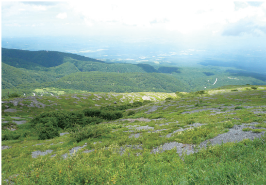
照片12 由那須岳俯瞰那須高原

石。那須町中央部分較為平坦，主要的農業開墾區及聚落大都分布於此。那須町位於關東北部，界於日本北方植物與南方植物接觸地帶，屬於溫帶植物範圍，物種相當豐富。那須町町花為龍膽花，在那須野地隨處可見，淡藍色花朵於春夏之間盛開，町樹為五葉松，象徵堅忍不拔，町鳥則為布穀鳥(那須町總務課，2010)。