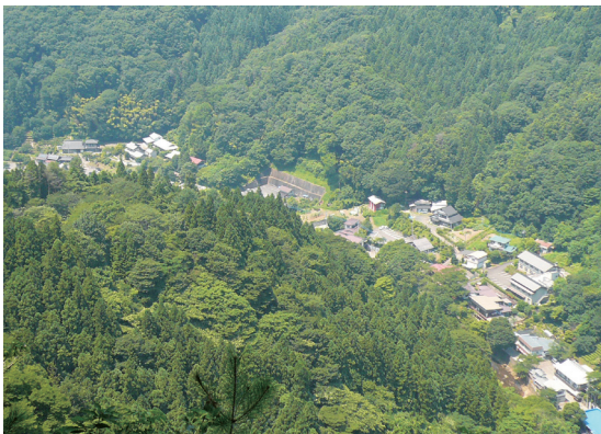
照片5 位在山谷河畔的山村聚落

幸運的是，大子町自然條件得天獨厚，境內擁有許多名勝，吸引眾多遊客造訪，觀光產業在當地經濟發展上扮演重要角色。1988年，大子町的旅遊人數有102萬人，之後遊客人數雖有增有減，但大體上呈現出增加趨勢，1995年時，遊客最多高達162萬人，不過之後就又逐漸下滑，近年來，大子町努力發展觀光產業，遊客人數逐漸增加，2005年時，遊客人數有142萬人(大子町企画觀光課，2010b)。雖然遊客人數不少，但住宿卻不多，從1988年至2005年間，在當地住宿最多有36萬人(1992年)，最低有12萬人(2001年)，住宿率約介於10-30%之間。