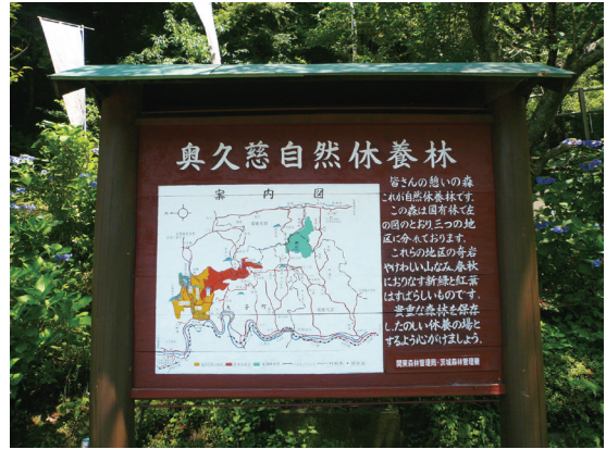
照片7 奥久慈自然休養林