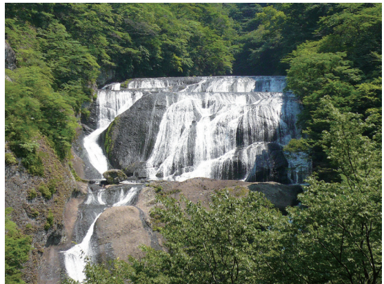
照片1 大子町的袋田瀑布

1953年9月，日本實施町村合併促進法，1955年大子町與附近村町合併，此時人口高達43,124人，不過隨著山村經濟凋敝、人口快速外移，大子町的總人口數也逐年遞減，到2005年時，人口只剩22,103人，50年間人口減少21,021人，約為一半，其中以1965年至1970年間人口流失最為嚴重，高達10.4%，2010年人口更降至20,780人，依此趨勢，預估到2020年時，當地人口將只剩下17,000人。另一方面，