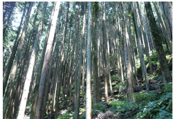
照片8 大子町的人工林