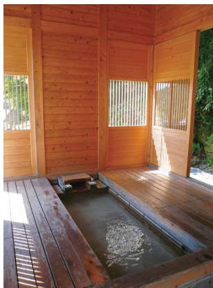
照片 16 那須町公設的足湯

(那須町，2006)：(1)活化綠色和傳統的城市建設：那須町受惠於綠色和水的自然環境，那須連綿的群山和八溝山脈織成的雄偉景觀，讓居民有共同的「故鄉」要素，自古以來所傳承下來的歷史和文化遺產，將如同自然環境一樣，