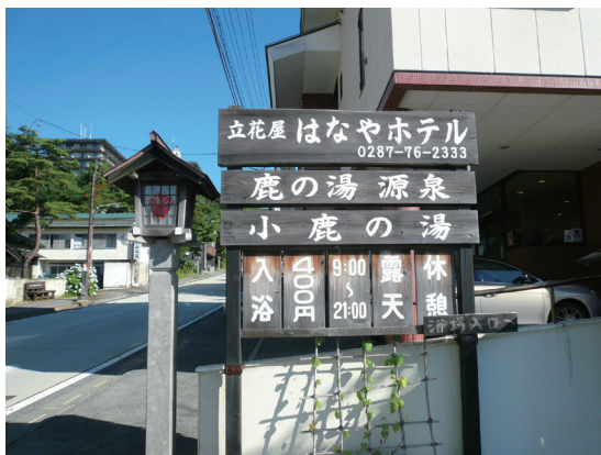
照片14 那須湯本是著名的溫泉勝地

只有124家，從業人員更只剩1,985人。無獨有偶地，另外一項提供主要就業人口的零售批發業亦是如此，1991年時，零售批發業事業所有565家，從業人員為2,023人，但到了2004年時，事業所只有331家，從業人員更只剩1,841人。很明顯地，那須町主要的產業項目包括農林業、礦業、建設業、製造業及零售批發業都在逐漸衰退中，或停滯不前，為何整體的事業所及從業人員卻有逐年增加之趨勢？關鍵在於服務業的快速成長。在那須町的統計報表中(那須町企画財政課，2010)，服務業項目下包括：(1)餐飲、住宿；(2)醫療、福祉；(3)教育、學習；(4)複合服務；(5)其他等，1991年時，服務業事業所有609家，從業人員為4,903人，佔全部從業人員的38.7%，但到了2006年時，事業所遽增至896家，從業人員更高達7,525人，佔全部從業人員的54.9%，換言之，那須町一半以上的從業人員是從事服務業。由於服務業發展迅速，從2004年起，那須町的統計報表已將服務業拆成上述5項分別計之，其中餐飲住宿類不論是在服務業中或是全部的產業中，其事業所及從業人員數目均獨占鰲頭，2004年時，有492家，從業人員有3,702人，2006年時，增加至504家，從業人員更提高到3,815人。