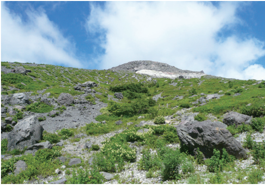
照片9 那須岳是日本百大名山之一