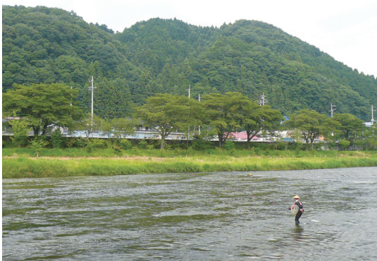
照片6 適合溪釣的久慈川