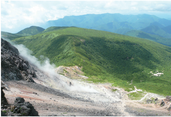
照片11 那須岳火山煙霧裊繞