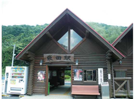
照片2 車站是大子町的重要觀光資源