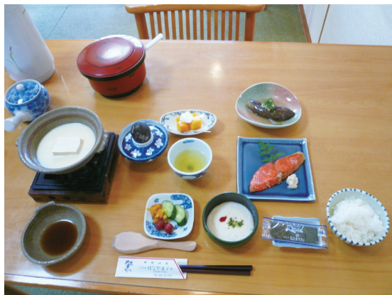
照片 15 那須當地食材所製作的美食