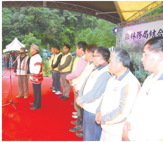
圖4 崙埤社區耆老以懇切的語氣為社區巡守隊祈福

參與「結合社區加強森林保護工作計畫」，為使計畫能夠順利啟動，101年2月8日在宜蘭縣大同鄉公所泰雅