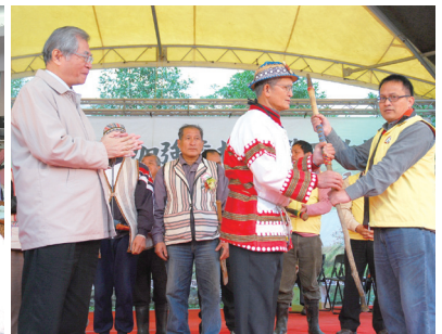
圖3 崙埤社區耆老授仗給社區巡邏隊賦予巡守隊守護家園與維護森林資源永續的責任