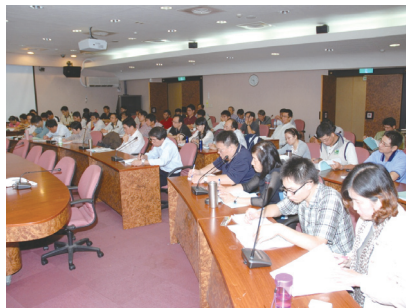
圖2 林務局2011年10月3日辦理「結合社區加強森林保護工作計畫教育訓練」