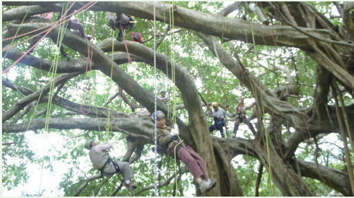
台東林區管理處的國家森林志工在專業講師的帶領下，都能夠克服對於「高度」的恐懼，自在的敞開心胸攀上樹冠層，擁抱大樹。