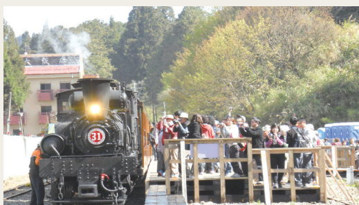
國寶級蒸氣火車於阿里山山花季啟動情形。(攝影／嘉義林區管理處 劉金源)

當天，特請出近百年歷史的國寶級蒸氣火車頭擔任賞櫻專車連掛古意盎然檜木車廂供旅客體驗，由阿里山站鳴笛開往沼平站之火車，行經阿里山派出前彎道稍減速慢行，讓穿梭於櫻花園中旅客聽火車笛鳴！佇足櫻花中按下快門，拍下美麗的一刻。(嘉義林區管理處 吳麗惠)