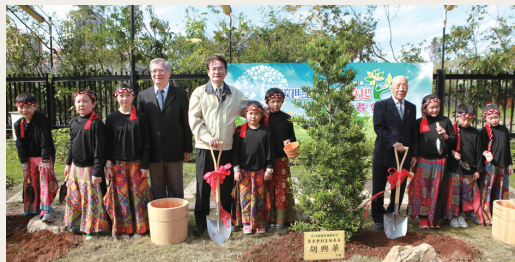
101年植樹月記者會，與會貴賓與小朋友共同種下著名的庭園美化樹種蘭嶼羅漢松。(攝影／林務局 侯祖德)

101年，一個新世紀的開端，林務局以「低碳世紀 森活做起」為主軸，101年2月29日在行政院農業委員會舉行全民植樹動起來開跑記者會。現場由老松國小學生所組成十鼓擊樂隊磅礴鼓聲中揭開活動序幕；農委會副主任委員胡興華、林務局代理局長李桃生與百歲人瑞崔介忱老先生及老松國小小朋友，共同打開「低碳森(生)活寶典」一書，並植下蘭嶼羅漢松苗木，彰顯植樹綠化是永續美好生活的關鍵，同時傳遞「十年樹木、百年樹人」的概念。種樹如同教育從小紮根一樣，從小種下綠色希望小苗，賡續的培育與照護，才能造就未來綠意盎然，庇護全民家園的好環境。(林務局 胡志宜)