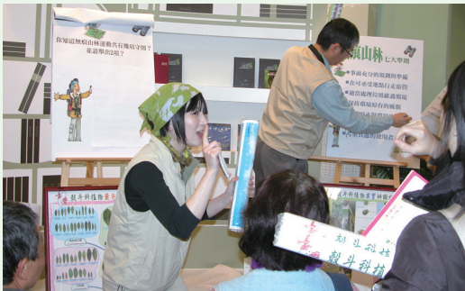
林務局同仁在國際書展推廣活動中，進行有趣的互動問答，現場民眾反應熱烈。

第20屆台北國際書展101年2月1日至6日在台北世貿盛大展開，林務局2月1日於政府出版品館辦理「有影秀台灣6支合輯影片」推廣行銷活動；羅東林區管理處今年亦獲邀以「蘭陽山林步道情」與「太平山的故事」兩書參展，並於2月2日於政府出版品館辦理推廣活動。林務局之推廣活動透過風趣多元化的宣導主題，同時與現場觀眾進行趣味互動問答、提供精美小禮物，增加民眾的目光與參與度；「蘭陽山林步道情」與「太平山的故事」兩書的相關資訊，也在羅東林區管理處同仁熱力推廣下，現場銷售良好民眾反應