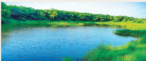
桃園高榮野生動物保護區是台灣史上面積最小的保護區。(林務局提供)

我國的法定野生動物保護區再添生力軍，依據野生動物保育法完成劃定「桃園高榮野生動物保護區」，保存北台灣埤塘生物多樣性，成為台灣第18個野生動物保護區，也是台灣史上最小的自然保護區域，亦是桃園眾多埤塘中，第1個依法劃設的保護區，面積僅1.11公頃，面積雖小卻別具意義。(林務局 陳至瑩)