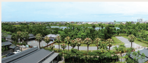
「羅東林業文化園區」以昔日「羅東林場」舊稱登錄為文化景觀。