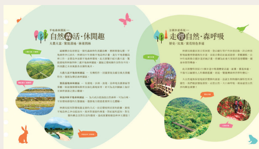
「LOVE愛森活－跟著大地森呼吸」特展DM。

為展現植樹造林的多元效益，提供民眾對森林的感動，找回深呼吸的渴望，植樹月期間，林務局於101年3月6日至5月6日期間，於國立國父紀念館1樓東西文化走廊特別策劃推出「LOVE愛森活－跟著大地森呼吸」特展。特展內容有全國步道系統中別具特色的歷史古道、紅葉步道及賞花步道的介紹，另呈現大農大富、鰲鼓濕地、林後四林等三處平地森林園區之園區規劃、環境、景觀特色及獨特風采，冀望透過此次的展覽，讓民眾學習對資源的尊重、對社區的認知、對生態的概念及對生活的態度，落實植樹造林的多元價值。(編輯部)