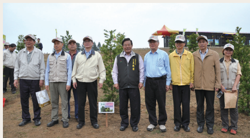
與會嘉賓植樹合影。(攝影／屏東林區管理處 劉心慧)

林務局與澎湖縣政府101年3月17日在澎湖休憩園區榕園辦理「低碳世紀 森活做起—植樹有氧澎湖慢活」親子植樹活動，現場近1,500位澎湖鄉親一起共襄盛舉。農委會副主委胡興華、澎湖縣長王乾發及現場民眾，共同種下羅漢松、水黃皮、樟樹與日本女貞、厚葉石班木等17種喬木與8種灌木，場面溫馨，相信未來榕園會變成澎湖鄉親們最美麗的休閒遊憩中心。(屏東林區管理處 朱惠絨)