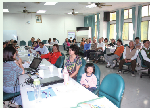
屏東林區管理處生態旅遊策略聯盟說明會第1場次圓滿達成。

林務局屏東林區管理處為推廣生態旅遊、社區林業及環境保護觀念，101年3月9日於六龜工作站舉辦「生態旅遊策略聯盟」說明會，將政府資源及合作模式提供與會民眾參考，本次說明會共30多個團體業者熱情參與，高雄市政府特請原民會及社會局派員與會說明各類型合作社之登記申請辦法，說明會圓滿成功。(屏東林區管理處 李淑貞)