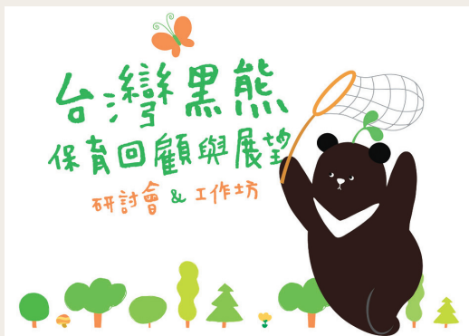
台灣黑熊保育回顧與展望研討會及工作坊海報。

林務局為了改善台灣黑熊的保育狀況，並且讓台灣黑熊更受民眾所重視，自101年2月5日起籌劃近2個月的時間，辦理「台灣黑熊保育回顧與展望研討會及工作坊」，於3月28日終於圓滿劃下句點。會中除了回顧近期台灣黑熊生態及人文調查的調查成果和保育成效，於工作坊中邀請世界自然保育聯盟(IUCN)熊類專家群組主席來台與國內學人交流，共同討論研擬台灣黑熊保育行動綱領，在亞洲地區亦屬首創之舉。(林務局 陳至瑩)