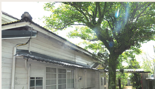
「羅東林區管理處處長宿舍」以日治時期獨特的宿舍建築特色登錄為歷史建築。