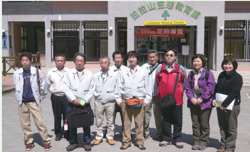
日本栃木縣日光市西川財產區議會等一行人於拉拉山生態教育館前合影。(攝影／新竹林區管理處 詹為異)

進行導覽及解說，並就拉拉山與該市在森林經營、環境教育及森林保護等議題進行意見交流。(林務局 黃兆吟)