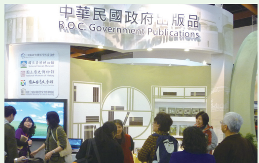
台北國際書展一走進蘭陽山林步道推廣活動。