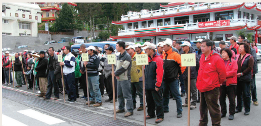
活動參與人員於旅客服務中心前方廣場集合並舉辦隆重的開幕儀式，隨即展開淨山活動。

林務局嘉義林區管理處與中華郵政股份有限公司嘉義郵局101年3月13日共同辦理阿里山國家森林遊樂區櫻花季序幕－「愛青山迎花季 把垃圾帶下山」淨山活動。所有參與本次活動的人員於旅客服務中心前方廣場集合並舉辦隆重的開幕儀式發送垃圾袋、工作手套、鐵夾及礦泉水等清潔工具後，即按原訂規劃展開淨山清潔活動，除加強遊樂區內環境之清潔維護與廢棄物之清理，更針對周遭環境及區內各車道、鐵路沿線、步道與各景點等區域進行全面性的清潔工作，另備有垃圾車隨時巡迴遊樂區清運垃圾及廢棄物，以達遊樂區整體清潔，提供民眾一個整潔清新的賞花環境與遊憩空間。(嘉義林區管理處 黃淑芳)