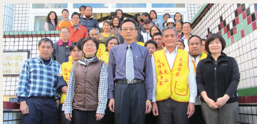
義盛插天山護林森力軍正式成軍，為保護山林共同努力。