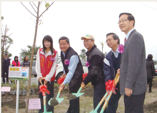
與會貴賓一起種下胭脂樹。

活動當日除有多項表演、頒獎活動、政風及政令宣導有獎徵答外，南投林區管理處考量該地空曠較易有風沙，在現場規劃栽種白千層、樟樹、胭脂樹、毛柿、紅芽石楠及厚葉石斑木等800多株抗風耐旱植物，等樹長成後，對環境將有不小助益。為了讓民眾了解種樹的方法，林管處特地安排一場種樹達人秀，教導民眾種樹小秘訣，會後還準備肖楠、七里香、平戶杜鵑及桂花各500株，合計2,000株苗木供民眾攜回栽植。(南投林區管理處 簡盈宜)