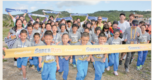
無痕山林馬拉松關懷兒童公益路跑。

林務局配合SuperRun賽事，協助國際運動自台灣出發，強化台灣品牌，林務局屏東及台東林區管理處102年1月26、27日配合「社團法人台灣體育運動競技協會」辦理國際體育賽事，推動體育外交，以浸水營古道為起點，穿越古道環繞南台灣。為推廣山林保護，林務局配合賽事前、後結合淨山活動與影像紀錄，行銷台灣山林之美同時宣導「無痕山林」的環保觀念，並在最後3公里「關懷兒童陪跑活動」，參與同仁和育幼院青少年一起為所有選手加油打氣，全體人員精神抖擻整齊有紀律，充分展現林務人員捍衛山林資源之精神，並期能成為模範，鼓勵孩子們挑戰自我並共同推廣公益慈善活動。(屏東林區管理處 廖國棟)