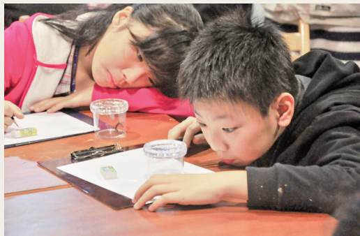
掉落式陷阱生物觀察。

林務局羅東自然教育中心102年1月24、25日舉辦小達文探險營活動，讓小朋友們和達爾文孩童時一樣，走入自然。小朋友們利用隨手可得的物品，製作屬於自己的觀察工具，用50公分的距離認識樹林、草地裡的毫髮世界，透過想像、實作、觀察、分析探索環境，誘發孩童的好奇心，發掘未曾留心過的事物。參與活動的孩童們都感受到原來大自然的一切是這麼有趣而豐富，有了難得的體驗與感動，也種下心中對於環境中不同物種的認識，對於資源的運用多了更深一層的思考。(羅東林區管理處 楊暄慧)