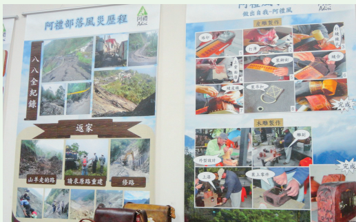
會場透過圖片說明阿禮部落風災的歷程。