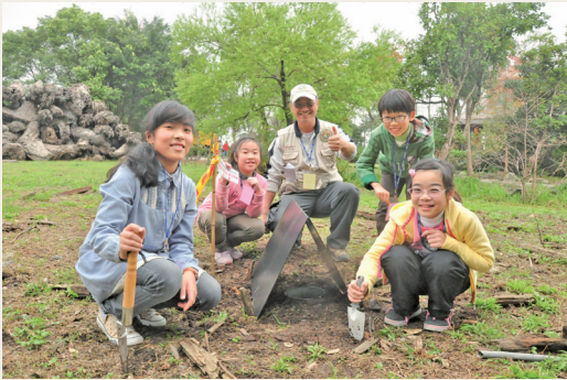
掉落式陷阱設置完成~來張合影吧！