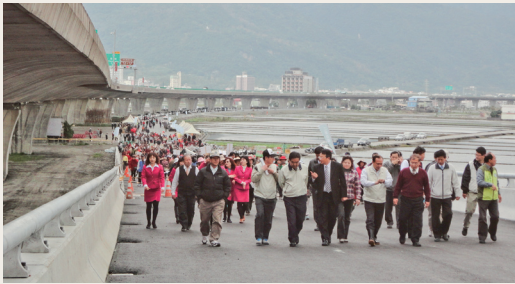
千人參與健行植樹活動。