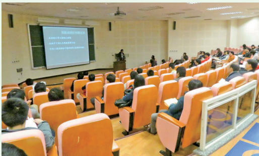
2013年動物行為暨生態學研討會與會人員聆聽報告。

林務局多年來投入自然保育相關研究，成果豐碩，為讓學術界及外界瞭解林務局於自然保育上的研究成果及保育政策方向，102年1月25、26日與國立東華大學共同舉辦「2013年動物行為暨生態學研討會」。林務局於會中發表「丹大地區水鹿活動調查及其對林木之影響」、「從愛知目標談國內生物多樣性政策發展方向」、「台灣中華白海豚的七年族群動態探討」等計18篇計畫成果，並邀請林務局輔導的富興、港口、池南、三棧及秀林5個在地社區，於會場展示推廣社區特色商品，獲得很大迴響。(林務局 鄭伊娟)