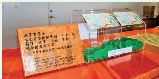
投綠幣表示認同節能減碳政策。(攝影／羅東林區管理處 吳思儀)

保署於101年12月25日「101年度綠行行動傳唱計畫暨環保餐館成果發表會」中，針對全台投綠幣數量超過6,000枚以上之6家業者進行表揚，太平山莊為績優業者之一。(羅東林區管理處 吳思儀)