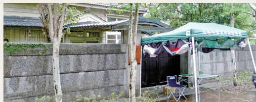
命題闈場設置於羅東林業文化園區的歷史建物內。

林務局所屬新竹、東勢、南投、屏東、羅東等5個林區管理處，102年招考75名約僱森林護管員，採分區報名，分區錄取，統一命題方式，命題闈場設於羅東林區管理處，由羅東林區管理處副處長擔任闈場主任。命題委員由各林區管理處推薦2名優秀人員並於101年12月7日至羅東林區管理處待命，俾經局長事先遴選4名命題委員加密後，由林務局人事室主任會同政風人員當場拆封並入闈。12月8日中午12時，闈場完成印製筆試測驗作文與森林概論試卷並運回林務局，相關林區管理處人員於當日14時到林務局領回試卷，入闈人員於筆試最後一科考完收卷後出闈。 (羅東林區管理處 黃水桐)