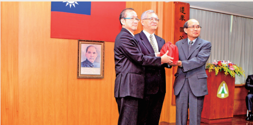
花蓮林區管理處新、卸任處長交接儀式。