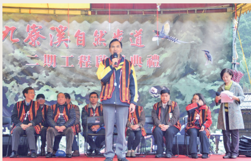
九寮溪自然步道二期啟用活動。

在許多自然步道愛好者參與及在地耑埤社區的泰雅竹炮禮讚下，林務局羅東林區管理處轄管之九寮溪自然步道二期路線在102年1月3日舉辦啟用典禮，同時也宣告九寮溪自然步道邁向一個嶄新的階段，蛻變為更具特色的遊憩新據點。九寮溪自然步道豐富的自然資源及泰雅原住民的人文歷史，絕對是放鬆心情、舒緩工作壓力的絕佳去處。(羅東林區管理處 林育賢)