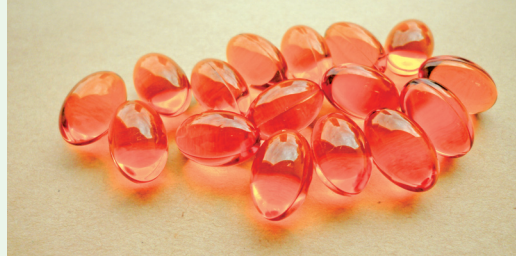
海洋哺乳類野生動物產製品—海豹油。