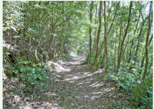
貫穿南台灣東西古道，蘊含豐富自然資源。

的加羅坂部落，沿途留有許多古道遺跡及蘊含高生物多樣性之生態景觀，動物相包含至少有17種哺乳類、88種鳥類、7種爬蟲類等，植物林相為原始闊葉林，有柳葉柯、假沙羅、南洋沙羅及豐富稀有植物等，堪稱全台數一數二，其中又以蕨類及蘭科植物最為豐富精彩，是一條富含人文史跡與特殊自然生態景觀之步道。(屏東林區管理處 廖國棟)