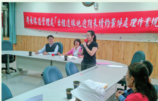
高屏地區林農參加說明會踴躍聆聽發言。