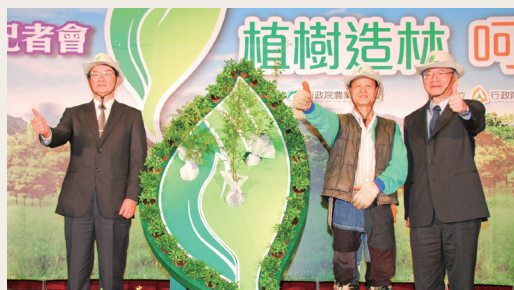
102年植樹月活動正式啟動。(攝影／林務局 侯祖德)

為迎接一年一度植樹月，林務局102年2月26日於農業委員會舉辦102年「植樹造林 呵護台灣」啟動記者會。在五位化身為花及樹精靈的舞者表演「森林天使 希望守護」的舞蹈中，為植樹月活動揭開序幕。農委會副主任委員胡興華、林務局局長李桃生與「種樹達人」賴倍元先生一齊將代表「希望」的台灣杉、「生命」意涵的台灣櫟及「守護」意味的台灣肖楠等樹苗，種入以交握之雙手勾勒出台灣輪廓的模型中。希望、生命和守護的枝葉，照護著台灣大地，象徵全民攜手、共同延續台灣生命線。(林務局 陶靜芝)