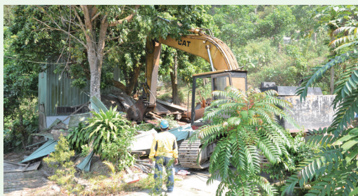
順利拆除工寮及工寮廁所。

高雄地方法院民事執行處102年2月25日強制拆除高雄市旗山區天上宮廟前水泥平台、草坪平台；法院檢察署亦執行沒收廟旁兩側平台、工寮及工寮廁所，面積合計1,599.14平方公尺，並責由林務局屏東林區管理處拆除。執行前經林管處事先與廟方溝通及宣導，拆除過程和平，信徒、廟方也理性配合。(屏東林區管理 林湘玲)