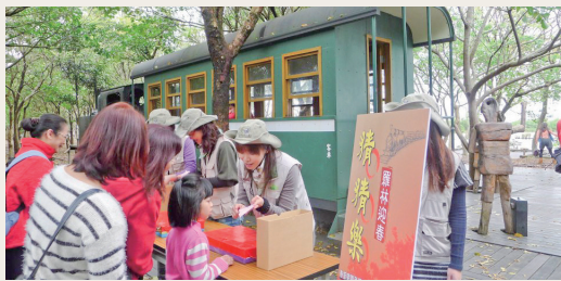
民眾熱情參與「羅林迎春猜猜樂」活動情形。(攝影／羅東林區管理處 王美娟)

林務局羅東林區管理處為增添過年熱鬧氣氛，102年2月11日至14日(農曆春節初二至初五)，下午1時10分至40分在羅東林業文化園區竹林車站廣場辦理「羅林迎春猜猜樂」活動。以文化園區為主題，配合戳戳樂遊戲方式與民眾互動，只要遊客答對題目，即可獲得精美小禮物，現場遊客參與熱絡，為園區增添蛇年喜氣及樂趣。(羅東林區管理處 王美娟)