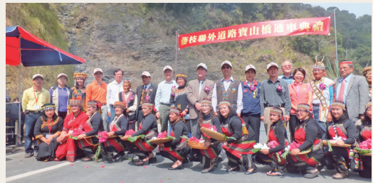
參加通車典禮來賓一起合影留念。

高雄市藤枝林道聯外道路受莫拉克風災重創毀損嚴重，沿線大型崩塌地有16處，中小型路基災害32處；林務局為求居民行的安全及施工品質，於地質破碎及路基嚴重毀損路段，努力克服困難，分別完成舊潭橋(5K)、寶山一號橋(10.6K)及寶山二號橋(12.6K)等3座橋梁，並於102年2月24日舉行通車典禮，當地居民在感恩歡喜心情下共同參與。典禮由農委會主任委員陳保基主持，居民以布農族報戰功祈福方式及傳統歌舞表演展現原住民族文化魅力；以芒草結繩方式作為剪彩繩、竹子加工作為竹炮，增添典禮會場熱絡氣氛。活動溫馨熱情，所有與會人員也參訪了寶山假日市集，對於原住民親手作傳統飾品讚不絕口。(屏東林區管理處 張嘉倫)