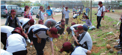
台中啟聰學校師生熱情參與植樹活動。

林務局東勢林區管理處、台中市政府及台中啟聰學校102年3月9日於國立台中啟聰學校共同舉辦「植樹造林 呵護台灣」植樹月活動。為了讓啟聰學生能夠了解植樹方式及重要性，東勢處同仁特別以2個月的時間學習手語，演出生動活潑的「植樹解說行動劇」，劇中有「蟲、林、鳥、獸、魚、樹精靈」角色扮演，希望能拉近大自然與人類的距離。啟聰學校與特殊教育師生們也準備了「獨輪車」、「天使合唱團」、「臭皮匠樂團」、「灰姑娘奇遇記」等特別表演，活動現場贈送山櫻花及桂花各2,500株，希望民眾一起響應植樹減碳、綠化家園；台中市政府也在現場安排農產品攤位的展出，活化推展在地的農業。(編輯部)