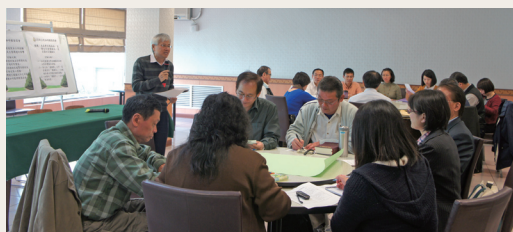
公民咖啡館座談會討論實況。

林務局102年3月6日舉辦公民咖啡館座談會，談論「為落實保護森林，宣導全民愛護樹木，是否須訂定護樹日」及「外來樹種印尼肉桂(又名陰香)對本土肉桂類樹種及生態環境之影響」二項議題。座談會當日邀請來自不同背景之專家共襄盛舉，包含林業試驗所、中華民國荒野保護協會、綠色陣線協會、台灣愛樹保育協會、福田樹木保育基金會專家及林區管理處代表參加，分享植樹與護樹等觀念並交流印尼肉桂野外生態觀察與其伐除後木材多元性利用之相關經驗。本次座談會相關意見將提供林務局及相關單位參採，並於辦理各項宣導活動時，將護樹觀念列入宣導主軸。(林務局廖國吟、藍佩芬)