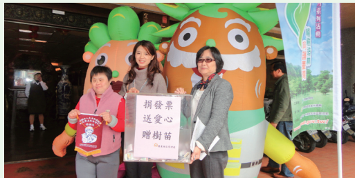
捐發票、送愛心、贈樹苗。