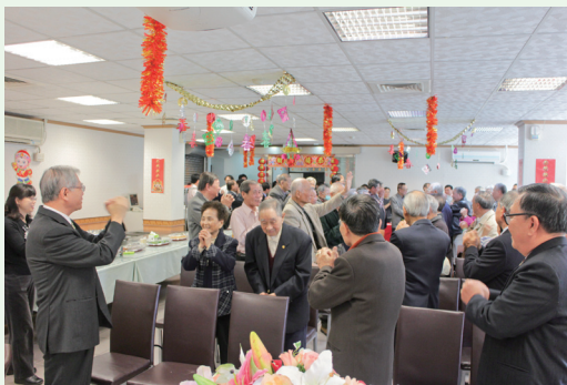
「102年新春茶會」現職同仁及退休人員熱情參與，互道恭喜。(攝影／林務局 黃文璇)

為慶祝新春佳節，激發同仁向心力並聯繫情誼，102年2月18日在林務局7樓餐廳舉辦「102年新春茶會」。活動由人事室、秘書室及職工福利委員會共同精心策劃，以「經驗傳承」為題，邀請退休人員返局共襄盛舉。局長李桃生親自主持活動，農業委員會副主委胡興華亦蒞臨會場，與各級主管、現職同仁及退休人員新春團拜，並期勉員工能在退休前輩奠定的基礎下，一棒傳一棒，發揚林業人勤勞質樸的精神，堅守崗位，做好林業的千秋事業，總計參與人數約300餘人。(林務局 陳雪瓶)