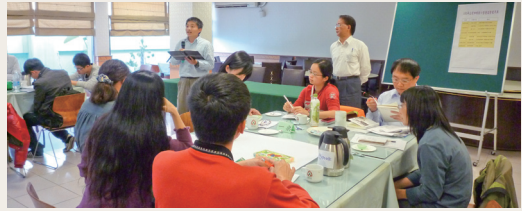
當天與會者就二項議題進行熱烈討論與分享。(攝影／林務局 陳至瑩)

林務局102年3月8日邀集關切「石虎保育策略」及「高風險入侵性外來種」二項議題的NGO團體、專家學者及本局同仁，召開「102年公民咖啡館－石虎保育策略及高風險入侵種源管制座談會」，會中就此二項議題作出了「加強石虎全國性生態分布資料及繁殖等面向研究」、「嘗試與在地雞農合作並建立石虎避護所」、「加強外來入侵種宣導及環境教育」及「定期追蹤監測已完成之外來動植物調查資料」等12項建議及共識，作為未來保育行動執行之依據。(林務局 陳至瑩)