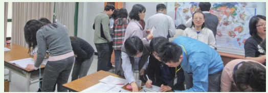
學員認真討論與投入生物多樣性活動。(攝影/林務局 許曉華)

為協助行政院永續會生物多樣性分組相關部會、縣市政府及農委會所屬同仁，增進「永續發展」及「生物多樣性」之觀念，林務局於龜山員工教育訓練中心辦理「生物多樣性推動方案實務訓練班」，3月28、29日為基礎班，4月8、9日為進階班。邀請行政院永續會委員與專家學者，針對愛知目標、我國生物多樣性推動策略、海洋資源保育與永續利用、外來入侵種、從生態足跡談永續發展、生物安全及生物多樣性的經濟潛力等議題進行授課，期提升業務推動及落實永續發展之能力。(林務局 許曉華)