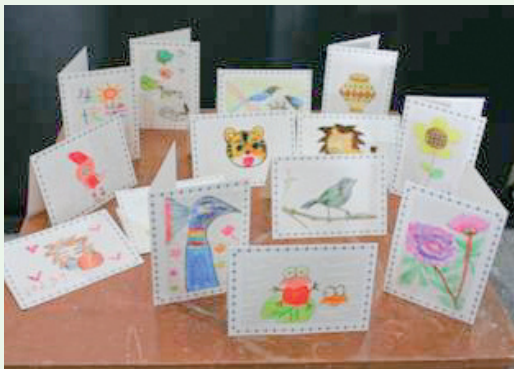
蘆草紙花及卡片創作。

林務局新竹林區管理處與蘆草文化藝術工作室合作於102年1月12日至3月30日，在東眼山國家森林遊樂區辦理「蘆草創藝趣展覽活動」，展示國、內外人士的蘆草工藝作品。展覽期間邀請具有60-70年經驗豐富手藝的蘆草達人，現場表演蘆草髓心通脫及削紙體驗，並於1月26日、3月9日及16日辦理3場民眾體驗蘆草紙茶花、櫻花創作、蘆草棒DIY製作及蘆草卡片繪畫等活動，參與民眾計約150人次。(新竹林區管理處 陳鳳珠)