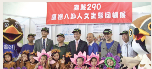
參與「2013鷹揚八卦—賞鷹系列活動」開幕記者會貴賓合影。

林務局南投林區管理處、彰化縣政府、交通部觀光局參山國家風景區管理處、行政院文化部、國立彰化生活美學館等單位，為推廣生態旅遊，帶領民眾體驗彰化八卦山自然及人文之美，102年3月14日在彰化縣政府一樓中庭召開「2013鷹揚八卦—賞鷹系列活動」記者會，介紹地方觀光產業特色及結合自然保育與大眾旅遊。八卦賞鷹系列活動結合自然保育、環境教育與生態旅遊，期使生物多樣性保育觀念向下扎根，使民眾藉此活動拋磚引玉作用，潛移默化間得以了解生態保育之重要性並維護自然資源，以維護野生動物棲息環境及保存物種多樣性，提高國民生活品質並維護國家良好形象。(南投林區管理處 蔡碧麗)。