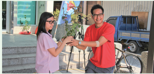
民眾挽袖捐熱血，獲贈鮮紅玫瑰花一株。

102年3月9日林務局台東林區管理處配合台東捐血站的節能主張，將贈苗活動會場移師至捐血站廣場舉辦，並結合創世基金會、哈拿希望之家辦理愛心義賣。台東鄉親助人不落後，民眾挽袖捐出67袋鮮血；募集1,848張發票及愛心義賣收入高達近1萬5千元，台東處所提供的苗木1,800株也索贈一空。(台東林區管理處 林素夷)