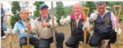
林務局局長李桃生(左二)與立法委員徐耀昌等人，在美麗的永和水庫畔種下山櫻花與蘭嶼羅漢松。

丹共1,000株供民眾索取外，與會貴賓也與民眾共同在波光盪漾、風景旖旎的水庫畔種下蘭嶼羅漢松與山櫻花，期待來年綠樹成蔭，櫻花翻飛。(新竹林區管理處 黃婉如)