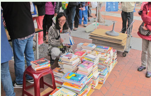
新竹林區管理處與誠品文化藝術基金會合作共募得約千本書況良好與書種優良書籍，活動意義非凡。

林務局新竹林區管理處與誠品文化藝術基金會合作，102年3月14日辦理「捐二手書換一手苗」活動，分享二手書換樹苗的交流行動，結合資源、閱讀與知識分享的理念。期盼達到捐書種樹，多換一本書，少砍一棵樹，使地球資源充分利用，達地球永續發展的目的；也讓參與者了解植樹減碳、資源重複使用的重要性。此次活動是新竹處首度於植樹月結合贈苗與募書辦理的交流活動，也是誠品募書首創方式。期待更多單位加入推廣閱讀的行列，讓書從書架上出走，分送到真正需要的地方，讓每一個角落都有機會打開閱讀之門，看見世界外，更盼能拋磚引玉，開啟愛樹、愛書、珍惜資源的行動力。此次活動提供了桂花、平戶杜鵑、茶花、含笑花等1,200株樹苗供民眾兌換，民眾迴響熱烈，現場共募得了書況良好且為3-15歲兒童及青少年閱讀的中英文書籍、生活風格類書籍以及藝術、文史哲學、社會科學等相關書籍約千本，募捐的書籍，全數交由誠品文化藝術基金會轉送至有閱讀需求的申請單位。(新竹林區管理處 黃婉如)