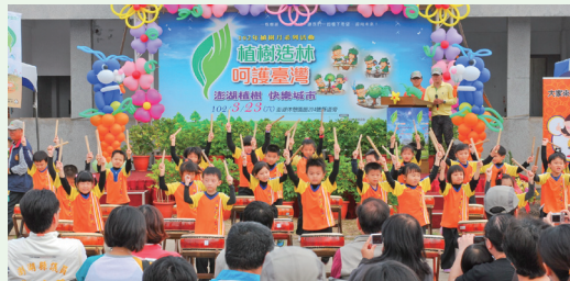
明穗幼稚園表演鼓動獅群迎春花為植樹活動添活力。(攝影／屏東林區管理處 陳紀伶)

林務局屏東林區管理處與澎湖縣政府102年3月23日在澎湖休憩園區204號縣道旁舉辦102年植樹活動，活動由明穗幼稚園以活潑可愛動作帶來熱鬧的民俗表演及明園幼稚園小朋友的騎馬舞鼓勵大家擁抱希望，為植樹活動揭開序幕。本活動參與鄉親約1,200人，共種下約5,300株樹苗，為菊島增加3公頃綠地。活動現場還邀請了澎湖監理站、澎湖縣農會、漁會、縣政府各局處、澎湖郵局、澎湖縣防務指揮部、台電、中油、台灣澎湖地方法院地方及法院檢察署等機關團體共同參與環境教育宣導，各攤位前大排長龍，民眾反應熱烈，也獲得很多環境教育的知識；另外家畜防治所也特別提供流浪動物認養，讓有愛心的民眾可以認養。(屏東林區管理處 朱惠絨)