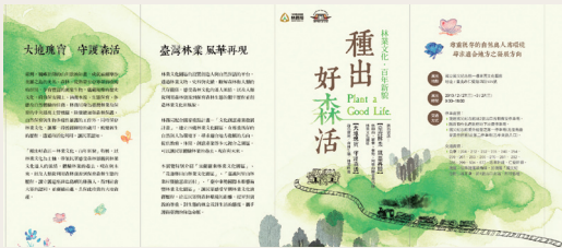
「種出好森活－林業文化·百年新貌」特展DM。

意森活村等四處林業文化園區之規劃、環境、景觀特色及獨特風采。冀望透過此展覽，讓民眾感受早期林業文化演繹的歷程，提升對資源的尊重，攜手護衛台灣的綠色命脈，並落實植樹造林的多元價值。(編輯部)