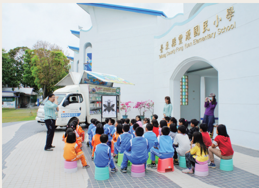
「小達爾文的探險旅程」－「故事隨車跑」在豐源國小正式啟動！

林務局台東林區管理處知本自然教育中心辦理之「小達爾文的探險旅程」－「故事隨車跑」於102年3月26日在台東縣豐源國小正式啟動！活動由知本自然教育中心與財團法人一粒麥子社會福利慈善事業基金會的行動書車「群英號」一起進行校園巡迴，提供學童閱讀由林務局翻譯出版的科學繪本－《小達爾文的探險旅程》，並規劃多項寓教於樂的體驗活動。期望透過活動啟發學童對大自然的好奇與興趣，在學習自發性自然探索與科學實驗能力之外，也同時培養友善環境與尊重生命的態度。(台東林區管理處 王琦瑩)