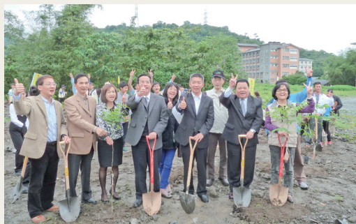
攜手種苗木，雙手捐愛心。(攝影／羅東林區管理處 陳冠璋)

林務局羅東林區管理處與聖母醫護管理專科學校102年3月31日，在聖母護專校區旁空地辦理「植樹萬歲 羅東林管處暨聖母護專植樹活動」，在國立宜蘭特殊教育學校廣東獅隊表演中熱鬧開場，並有大隱國小直笛隊、護專學生的樂團及熱舞表演，活動精采豐富，大家更攜手種下600株苗木也奉獻了滿滿的愛心。當日除有羅東林管處提供贈苗攤位、無痕山林、政風的宣導，更有羅東稽徵所、三星鄉衛生所、國立宜蘭特教學校、宜蘭地檢署等機關學校推出多樣化宣導互動攤位，現場參與民眾達800多人，活動溫馨、熱鬧。(羅東林區管理處 陳冠璋)