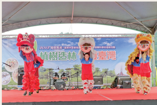
由國立宜蘭特殊教育學校廣東獅隊表演開場，提供多元舞台，幫助弱勢孩童成長。