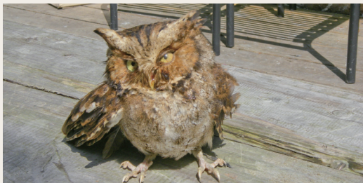
拾獲的黃嘴角鴞。(攝影／羅東林區管理處 張順能)

102年3月4日林務局羅東林區管理處太平山工作站明池駐在所護管員，於大溪事業區第50林班執行林野巡視時，拾獲受傷黃嘴角鴞1隻。黃嘴角鴞屬台灣特有亞種，依野生動物保育法列為第二級珍貴稀有的保育類野生動物，經同仁緊急包紮送至宜蘭縣動植物防疫所置留照護康復後，3月21日於原拾獲地點野放山林展翅飛翔。(羅東林區管理處 張順能)