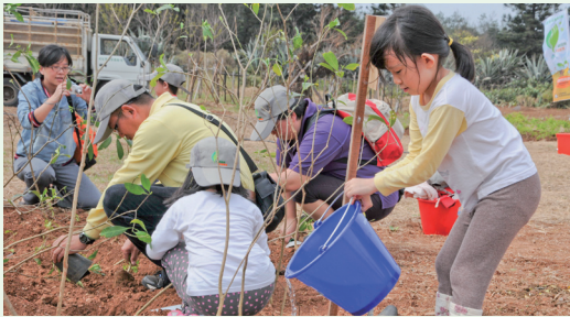
親子植樹樂淘淘。