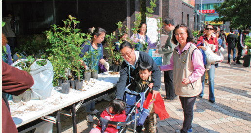
民眾扶老攜幼踴躍參與建造美麗綠色家園的行列。

為鼓勵大家多種樹，建造美麗的綠色家園，林務局102年3月8日適逢婦女節辦理贈送樹苗活動。上午不到7點已有民眾前來排隊，民眾扶老攜幼踴躍參與，現場氣氛相當熱絡，不到2小時3,000株杜鵑、茶花、桂花、羅漢松樹苗全部發送完畢。本次贈苗活動約800人次參與。此外，林務局結合回收廢電池領取苗木，共計收回達48公斤的廢電池，共同改善提升居家環境。(編輯部)