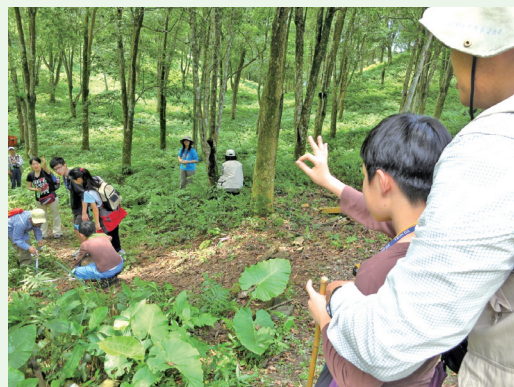
野地測量、方位判別。

臨時的庇護所；並且學習在自然環境中獲取食物來源的方法，認識並找尋可食用的野菜；練習就地取材搭設陷阱的技術，以及在野外補充水分的重要性，學習與自然共生的技能，體驗回歸山林的生存之道。(羅東自然教育中心 謝佳玲)