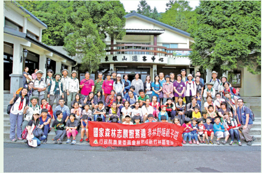
春林野趣親子遊活動大合照。

林務局新竹林區管理處國家森林解說志工隊自88年起，每年均與林區管理處合作，協助弱勢團體體驗森林美好的活動。今年春林野趣親子遊於102年5月19日由新竹處的10位志工帶領新竹家庭扶助中心65位小朋友及家長至東眼山國家森林遊樂區。有鑑於家庭扶助中心的小朋友接觸森林的機會較低，本次設計森林體驗生態遊戲，尋找躲在大自然中的昆蟲，提升小朋友的觀察力並引發興趣，並進行小水滴旅行，了解水的循環與其珍貴性，過程中，小朋友們盡情與山林互動，笑聲不斷。此次活動除新竹處及志工隊投入人力及物力，也感謝善心人士贊助，讓活動更加圓滿，參與的小朋友及家長也留下美好的回憶。(新竹林區管理處 鍾欣芸)