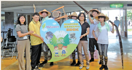
愛心募集~讚！

將這些募集的愛心物資，全數捐贈給聖嘉民啟智中心做公益使用；捐贈儀式當日，同仁扮演過去林場的工人與學員一起晨間律動。羅東處支持宜蘭在地以服務、照顧與關心宜蘭身心障礙朋友的聖嘉民啟智中心，也希望能夠為宜蘭弱勢子弟盡一份心力。(羅東林區管理處 陳冠璋)