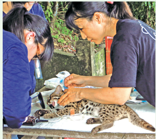
獸醫為虎妹進行麻醉、抽血取樣、測量體長重量及裝戴無線電發報器。(攝影／新竹林區管理處 余建勳)

電發報器，過程中獸醫師也為虎妹進行抽血取樣以及測量體長重量。完成追蹤器裝戴後，研究人員讓虎妹休養幾天，評估追蹤器的安裝是否妥當，便選定良辰吉日將牠野放，野放後研究人員將持續進行追蹤，以了解其野外適應情形。(新竹林區管理處 余建勳)