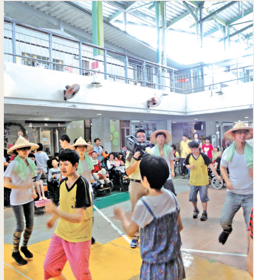
羅東林區管理處員工扮演過去林場的工人與學員做晨間律動。