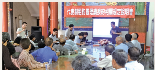
南投林區管理處在南投縣國姓鄉北山村南天宮首度舉辦「代表制租約辦理續換約相關規定」說明會，吸引許多民眾參與。

林務局南投林區管理處為提高代表制租地造林地之續約率，並展現協助承租人辦理續約之誠意，102年4月24日在南投縣國姓鄉北山村南天宮首度舉辦「代表制租約辦理續換約相關規定」說明會，幫農民解決相關租地問題。說明會吸引約40位林農參加，民眾反應熱烈，過程平和理性。因類似的租約問題層出不窮，該處希望以此為示範點，讓承租人都能順利取得應有的合法租約，也呼籲所有的承租農民或者現使用人，要多留意相關訊息，以保障自身權益。(南投林區管理處 簡盈宜)