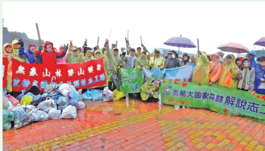
林務局南投、東勢、花蓮林區管理處及太魯閣國家公園舉辦合歡山春季淨山活動，撿拾超過400多公斤的垃圾。

林務局南投、東勢、花蓮林區管理處及太魯閣國家公園管理處聯合舉辦合歡山春季聯合淨山已邁入第四年，102年4月27日四個單位員工及志工160人，利用假日舉辦淨山活動。以遊客最常停留的武嶺停車場、合歡主峰、合歡東峰、合歡北峰與石門山、台十四甲線昆陽至合歡山莊等地點撿拾垃圾，大家頂著風雨與攝氏10度以下的低溫清出400多公斤垃圾。遊客將垃圾留在山上的行為，不僅有礙觀瞻，破壞山林美感，並對高山生態造成莫大衝擊！大自然必須永續及保育，台灣山林之美迫切需要大家一起加入守護行列，讓生態環境維護達到「無痕山林」的境界。(南投林區管理處 簡盈宜)