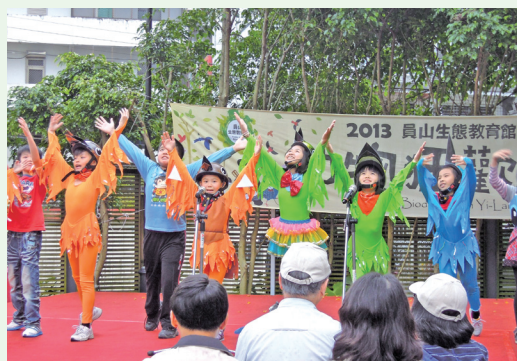
「動物狂歡節」館慶系列活動。