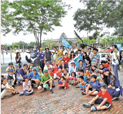
守護生物多樣性大遊行。