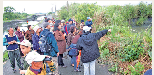
在地社區參與資源調查。(攝影／員山生態教育館 曹瀾)

林務局羅東林區管理處員山生態教育館102年首場「自然資源調查研習班」於4月13日在後埤社區推出「植物及鳥類篇」。研習活動邀請專業講師帶領學員認識植物及鳥類的科學調查方法，並透過田野實習，實際操作在地社區的資源調查。後埤社區巧妙地將在地植物及鳥類資源，融入民俗文化及通俗印象中，連銀髮族的成員也能融會貫通。在了解資源調查的重要性後，期望社區能做長期監測，累積在地自然資源資料，並善用此項資源作為社區及生態旅遊發展之基礎。(員山生態教育館 曹瀾)