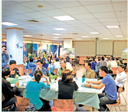
「山林守護尖兵之另一面」媒體採訪情形。