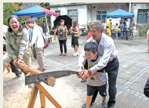
跨越世代鴻溝，祖孫共同體驗早期林業伐木辛苦與樂趣。