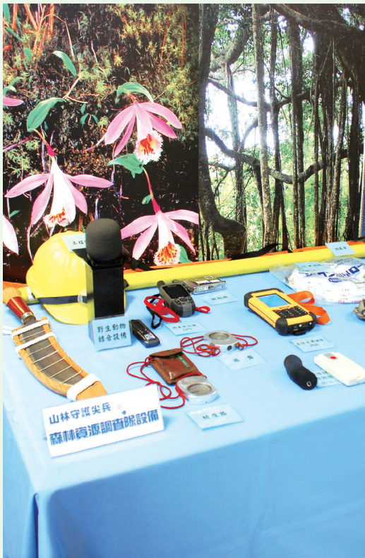
深山特遣隊出動時之裝備。(林務局提供)

為提升林務局森林護管業務之正面形象，林務局102年4月16日以公民咖啡館形式辦理「山林守護尖兵之另一面」媒體採訪活動，計有農業線14家媒體15位記者出席採訪，受訪對象為各林區管理處執行林野巡護及第四次森林資源調查時，具故事性或特殊成效之11位現場同仁，經由記者的深入採訪、報導，讓民眾了解林務工作者在捍衛山林、維護森林資源永續時，勇於面對各種威脅及挑戰，勞苦實做的工作內涵及翻山越嶺、艱苦卓絕的精神。(林務局 林媯妃)