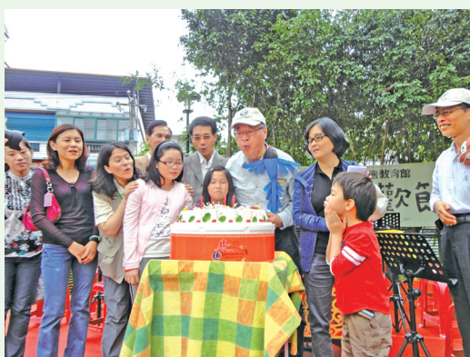
員山生態教育館~生日快樂！

動在彼此承諾願持續努力維護生物與環境的美好及參與貴賓與現場民眾祝福下，圓滿落幕。(員山生態教育館 曹瀟)