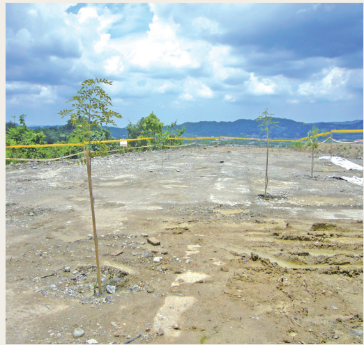
天上宮拆除工作執行完畢，並完成復舊造林工作。

關切，以及包商承受許多抗議民眾不理性的言語。為防止民眾不理性的抗議行為，延宕工程進行，屏東處每天派員現場巡視監控。本次執行拆除平台、停車場及加強邊坡水土保持工程，對於主殿方面，則行文地檢署裁定相關權屬，避免國有林班地遭持續佔用。(屏東林區管理處 林湘玲)