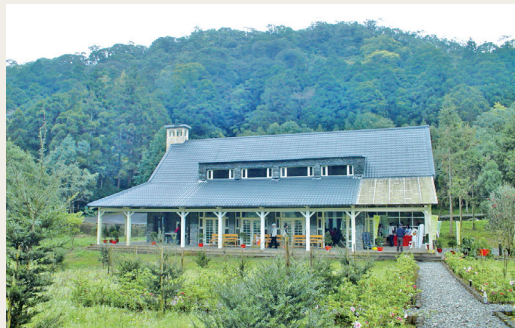
四堵駐在所。

林務局羅東林區管理處礁溪工作站102年4月10日成立四堵駐在所，由處長林滌貞主持揭牌儀式。駐在所配置3名巡視員，護管區域內除有涵養翡翠水庫之水源保安林，及依文化資產保存法設置「坪林台灣油杉自然保留區」外，並有培育原生樹種與平地綠美化樹種之「四堵苗圃」。該駐在所成立後所配置之人力將長期駐守，執行新北市坪林區森林資源保護、國土保安與生態保育工作，交通便利而與鄰近村落居民來往熱絡，配合林業生態系經營，確保森林自然資源之永續。(羅東林區管理處 吳伯宏)