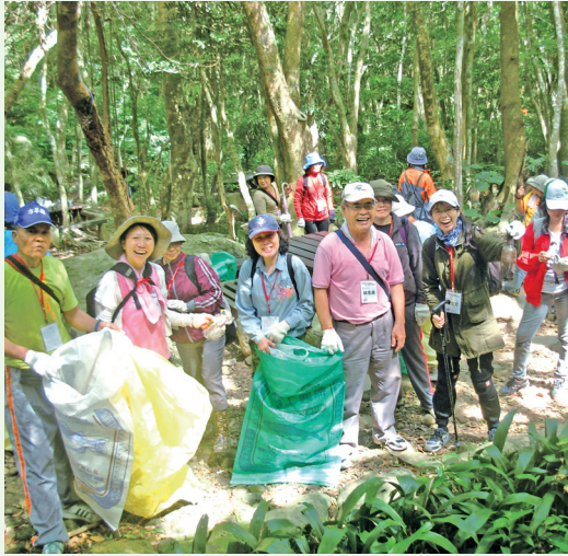
屏東社區大學義工與屏東林區管理處同仁共同清除了13公斤的垃圾。(屏東林區管理處 廖國棟)