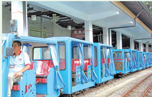
烏來台車102年5月6日正式復駛。

林務局新竹林區管理處轄管之烏來台車，自101年年7月起陸續進行颱風災害搶修、邊坡改善、枕木更新與軌道調整、建物基礎補強、防墜石網設置以及台車車體整修等工程。歷經十個月修復，經全面檢視，加強人員訓練及場地整理後，102年5月6日正式復駛，為期待已久的遊客，帶動烏來商圈人潮。(新竹林區管理處 鄒兩余)