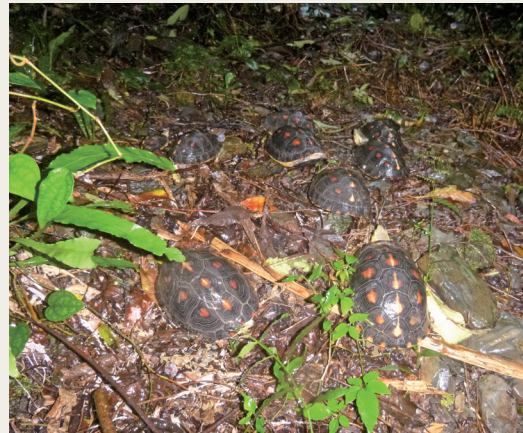
野放的食蛇龜「龜速」向前。(攝影／羅東林區管理處 黃愷茹)

地，夏季常可在森林邊緣看到食蛇龜的蹤影，本次野放的食蛇龜一經工作人員擺放到草地上，馬上探出頭來，一溜煙就爬入森林，衝勁十足，完全推翻「龜速」的形象。(羅東林區管理處 黃愷茹)