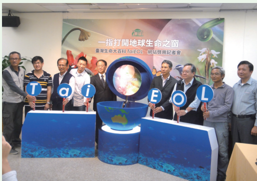
一指打開地球生命之窗—生命大百科網站啟用記者會。(攝影／林務局 許曉華)

133種、鳥類561種、哺乳類97種、昆蟲3,200種、珊瑚200種、蜘蛛130種，總計完成近13,000種物種解說與照片資料，可促使我國生物多樣性科普資訊流通傳遞，更有助國內跨機構、跨生物類群資料庫的內容蒐集及整合，並與國際同步發展及無縫接軌。(林務局 許曉華)