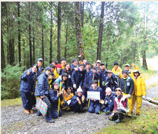
森林保姆「森林關鍵報告」。

一群充滿活力的高中生及大學生，在羅東自然教育中心帶領下，一同走入「棲蘭野生動物重要棲息環境」，以「森林關鍵報告」為活動主題，認識低度人為干擾的檜木森林的功能、體驗森林保姆－護管員的工作，進一步瞭解健康的森林對人類的影響，推廣森林經營的重要性。(羅東林區管理處 楊暄慧)