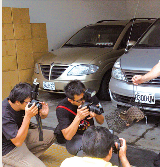
在台東成功鎮山區捕獲第一隻活體雌性鼬獾，多家媒體記者聞訊前來拍照。