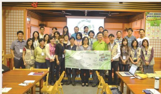
公部門、民間組織建立合作的夥伴關係。