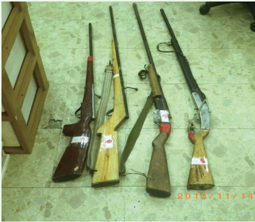
查獲盜獵用之違法槍枝。