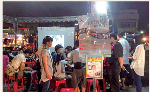
週末夜市的2013生態電影節活動，竟有粉絲追尋，專程來看電影。

週末夜市的2013生態電影節活動，竟有粉絲追尋，專程來看電影。現場除了播放影片，還設有DIY攤位，讓民眾免費製作「守鸞吊飾」及「手鸞卡」，掀起一波波搶做潮，大人伸長了手領取材料，小朋友即使沒有位子，趴在一旁的圓凳子上認真著色，大家都對Q版守鸞吊飾好奇不已，紛紛詢問，經由現場工作人員的說明，成功行銷2013生態電影節活動及「守鸞的人」！(台東林區管理處 林素夷)