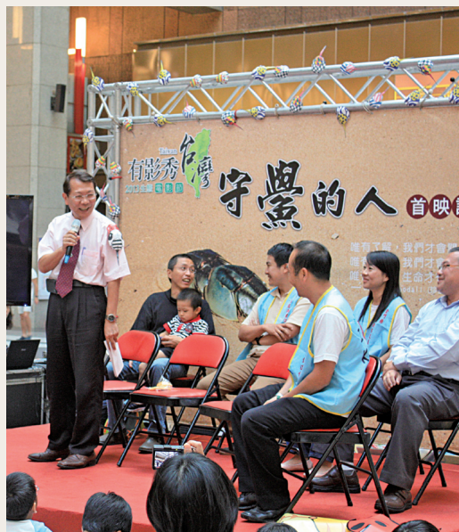
2013生態電影節第9支首映片《守鸞的人》回到台北首映，與民眾一起觀影展、聊生態、看台灣，守候美麗台灣！(攝影／台東林區管理處 林素夷)

《守鸞的人》導演洪淳修以金門在地觀點，由洪門港漁人的生活面切入，呈現人與鸞之間的關係，並紀錄金門水試所、澎湖海洋生物研究中心的鸞復育工作；影片中的「地陪」阿舜，則帶著大家在金門轉來轉去，深入瞭解金門人守「鸞」的脈絡。為了吸引大家了解鸞、關心鸞，進而愛護鸞、保護鸞棲地，台東處特別設計了「手鸞書籤」及「守鸞吊飾」，邀請民眾動手DIY，一起在北車守「鸞」！(台東林區管理處 林素夷)