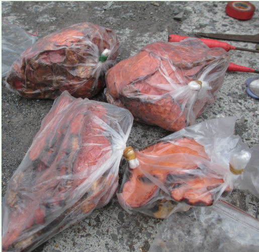
屏東林區管理處聯合森林警察隊及潮州分局當場查獲牛樟芝及牛樟芝菌絲體。