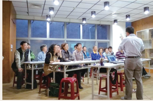
與在地社區、團體和相關學術單位座談情形。