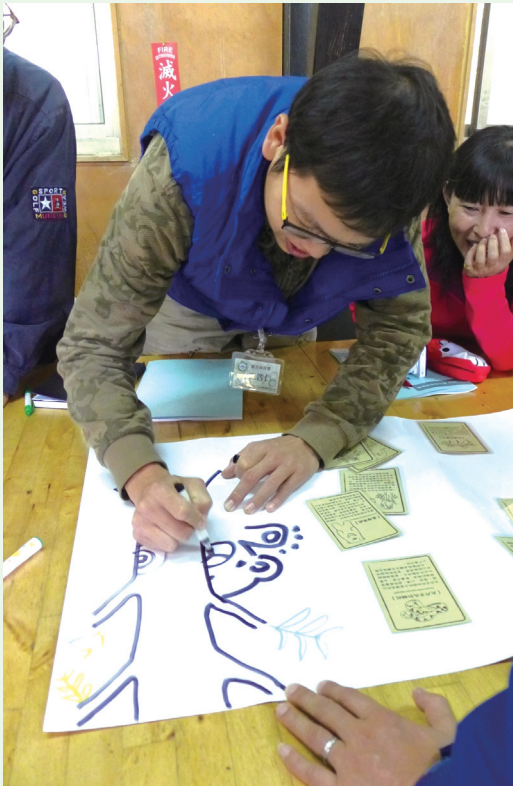
「新」方舟～新觀念、新體繪。