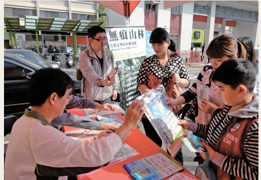
無痕山林及生態電影節宣導。(攝影／羅東林區管理處 傅正義)

第七屆聯合盃作文大賽宜蘭區初賽102年10月26日在宜蘭市復興國中舉行，現場共一千六百餘人參與，林務局羅東林管處獲聯合報系的邀請於現場設攤宣導。透過這個難得的機會，於現場教導親子共組烏龜怪方蟹生態摺紙，烏龜怪方蟹生態摺紙DIY是羅東處辦理2013生態電影節活動吸引民眾的創意宣導品，過宣導品的手作、解說，了解生活在龜山島海底溫泉邊的神祕生物，而本次活動透過親子共同創作培養孩子專注力與合作的能力。(羅東林區管理處 陳冠璋)