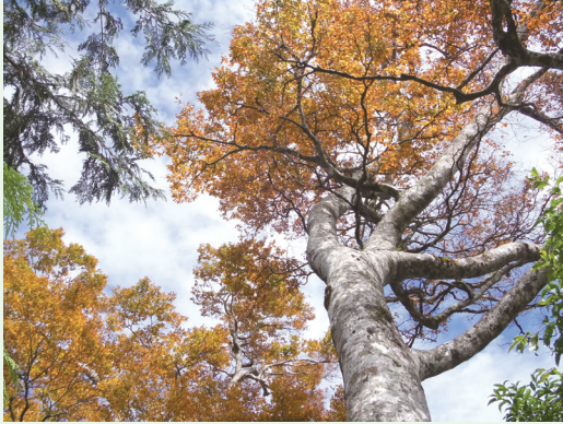
黃金山毛櫸。