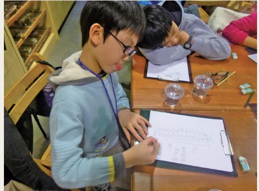
畫～秋天的林業文化園區。

秋季來臨，林務局羅東林區管理處羅東自然教育中心102年10月19日舉辦「繪森繪影」活動，看看秋天的林業文化園區裡生命脈動行列，探索環境從周邊做起，利用生態繪畫的方式，記錄僅屬於自己的手繪相本，帶著小朋友走出戶外，放慢節奏、拉近距離，利用繪畫方式細細紀錄眼前的一切，發現原野裡的新世界。(羅東林區管理處 楊暄慧)