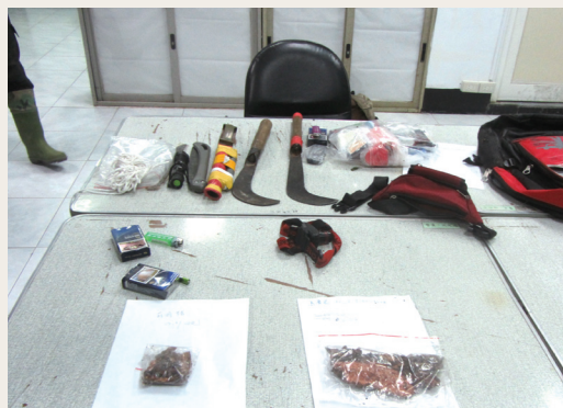
林、警不定期聯合深山巡護，共同逮獲2名山老鼠所攜帶的盜伐工具。(攝影／屏東林區管理處 黃俊明)

天兔風災過後，林務局屏東林區管理處六龜工作站同仁除忙災害搶修，也上緊發條並與高雄市政府警察局六龜分局桃源分駐所及森林暨自然保育警察隊屏東分隊聯合執行深山巡護、勘災，102年10月17日在旗山事業區第73林班共同查獲2名嫌犯共同組成盜採國有林產物的犯罪集團，利用災後政府機關進行搶修作掩護，盜採國有林班地森林副產物牛樟菇93.58公克，全案已移送偵辦。(屏東林區管理處 黃俊明)