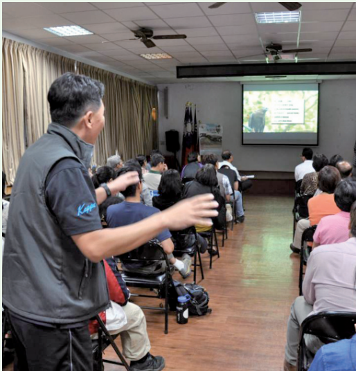
新竹市消防局同仁因勤務需求常得出勤捕蜂、摘蜂窩，特別於映後座談提出有趣經驗與導演分享。