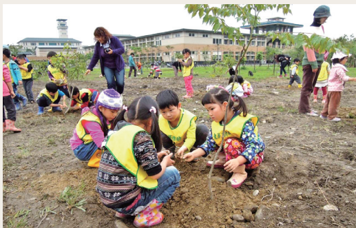
東華大學附設托兒所小朋友們認真地參與植樹活動。(攝影／花蓮林區管理處 陳莉鵠)

由林務局花蓮林區管理處、花蓮縣政府及國立東華大學合辦103年度「植樹造林 呵護台灣」區域植樹活動，活動當日林務局主任秘書張彬(現任副局長)、花蓮林區管理處處長吳坤銘、花蓮縣政府農業處處長張智超、東華大學校長吳茂昆等共同參與並親手栽植牛樟樹苗。當日東華大學附設托兒所小朋友也開心地參與植樹活動，期許透過植樹過程啟發小朋友們對自然環境的好奇心，並學習愛護環境，尊重生命，保護地球。(花蓮林區管理處 陳莉鵠)