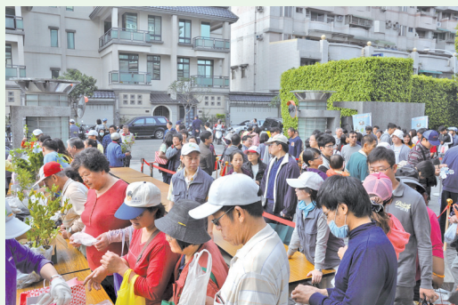
民眾踴躍參加贈苗活動。

台灣屏東地方法院政風室、屏東縣政府衛生局也共襄盛舉，一併參與業務宣導。活動參加民眾超過800人，發票和舊書已分別捐予屏東創世基金會和屏東家扶中心，廢電池及廢光碟則交給屏東縣環保局。(屏東林區管理處 陳澄威)