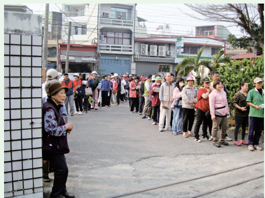
活動當日民眾排隊兌換樹苗。

在植樹節當日，屏東林區管理處轄內的旗山、六龜、潮州、恆春4個工作站同步辦理贈苗活動。首先，在上午8點半最先開始的是恆春工作站，除邀請財政部南區國稅局恆春稽徵所等機關共同參與外，亦結合社區(水蛙窟社區的草地之星樂團)及鄰近的恆春國小師生共襄盛舉。上午9點整則是由潮州、旗山、六龜工作站同步辦理贈苗活動，潮州工作站設計了許多與民眾互動的環境解說機智問答，並同步廣告「林後四林平地森林園區」即將開園。旗山工作站吸引近300名民眾熱情參與，更有鄰近的旗山國小由老師帶領一群天真活潑的小朋友參與，使活動更顯教育意義。六龜工作站所贈送的桂花、樹蘭、羅漢松、含笑花、黃梔花、黃金扁柏、桃花心木、印度紫檀等樹苗，不到1小時即贈送完畢。4場活動計有1,000多名民眾熱烈參與，不但傳達了「植樹造林 呵護台灣」的觀念，亦達到林業相關工作的宣導。(屏東林區管理處 陳誼)