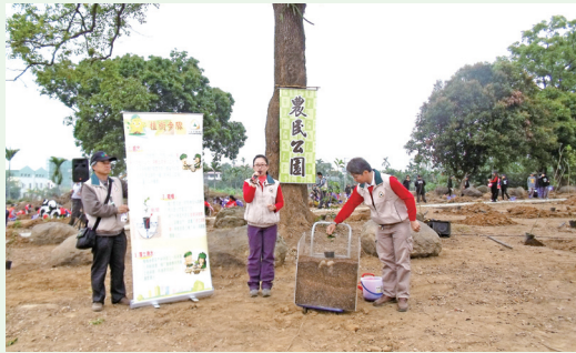
農民公園植樹活動，現場示範植樹方法及步驟。(攝影／嘉義林區管理處 黃淑芳)

農民節與植樹節活動結合，林務局嘉義林區管理處處長廖一光、嘉義縣縣長張花冠、中埔鄉公所代理鄉長許彰敏、中埔鄉農會理事長田坤顯、常務監事林武揚、總幹事李碧雲及中埔鄉傑出農民帶領小朋友們，103年3月11日於中埔鄉社口幼兒園旁，共同種下風鈴木、藍花楹、鐵刀木、桂花、春不老等共2,680株樹苗，傳達「農民植樹，全民乘涼」薪火相傳的意象，同時將植樹地點命名為「農民公園」並進行揭牌儀式，假以時日待樹木成林，將成當地最重要的休閒綠地。(嘉義林區管理處 黃淑芳)