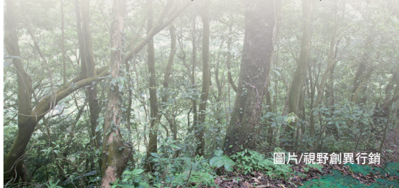
圖片/視野創異行銷

為鼓勵大家多種樹，建造美麗的綠色家園，林務局103年3月7日辦理贈送樹苗活動。清晨6點多已有民眾冒雨趕來排隊，林務局特別贈送排隊前10名民眾苗木及精美用品，現場民眾扶老攜幼踴躍參與，氣氛相當熱絡，估計達800人次，3,000株杜鵑、茶花、桂花、羅漢松樹苗不到1個半小時全部發送完畢。此外，林務局結合回收廢電池領取苗木，共收回約42公斤的廢電池，共同對環境保育盡一份心力。(林務局 廖國吟)