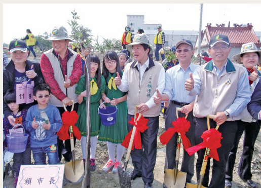
台南市長賴清德、林務局副局長楊宏志、嘉義處處長廖一光及台南市農業局長許漢卿及台南市童軍會共同植樹。