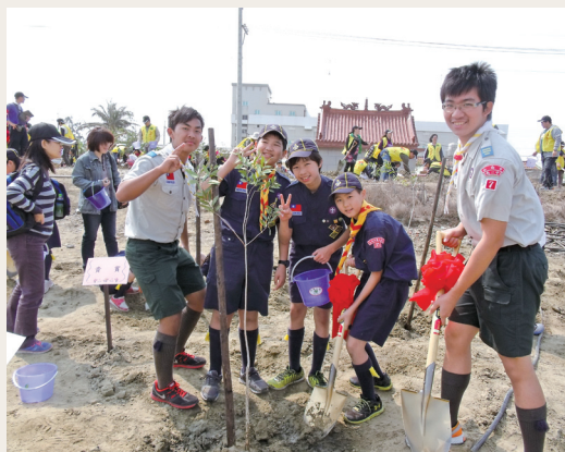
台南市童軍會植樹。

春天是最適合賞花的季節，更是植樹的最佳時機，林務局嘉義林區管理處、台南市政府、台灣中油公司、台南市童軍會103年3月15日在台南市七股濱海濕地植物及生態園區辦理「鹽田植樹 創造奇蹟」植樹活動，計有1,800位愛樹愛環境的民眾參加，場面盛大。海岸造林與平地及山區造林不同，海岸地多為砂質地，土壤層薄且鹽化，又有強風吹襲，對植物而言及對造林工作是一大考驗，樹種的選擇及造林的方式更是重要，本場活動造林樹種選擇抗風、抗鹽的木麻黃、白千層、黃槿、欖李、苦檻藍等的濱海植物，比較特別的栽植方式，於植穴底層加蚵殼阻擋鹽份上升，增加林木成活機會，屆時林木長成將為周遭社區居民，擋強風、擋砂，擋鹽霧，帶來更優質的生活。林務局楊副局長宏志，嘉義處處長廖一光、台南市長賴清德、台灣中油總經理陳綠蔚及台南市童軍會童軍帶領大家植樹，於七股海岸造林種下約3,000株樹苗。(嘉義林區管理處 黃淑芳)