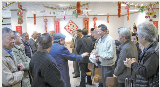
「103年度新春茶會」現職同仁及退休人員熱情參與，互道恭喜。

林務局為慶祝新春佳節，激發同仁向心力與聯繫情誼，103年2月5日在林務局7樓餐廳舉辦「103年新春茶會」。本次活動以「經驗傳承」為題，邀請退休人員返局共襄盛舉，由局長李桃生親自主持，行政院農業委員會副主委胡興華亦蒞臨會場，帶領各級主管、現職同仁及退休人員進行新春團拜，並期勉員工能在退休前輩奠定的基礎下，一棒傳一棒，發揚林業人勤勞質樸的精神，堅守崗位，做好林業的千秋事業，讓我們生存的環境能永續發展，生生不息。參與人數約300餘人。(林務局 瞿漢強)