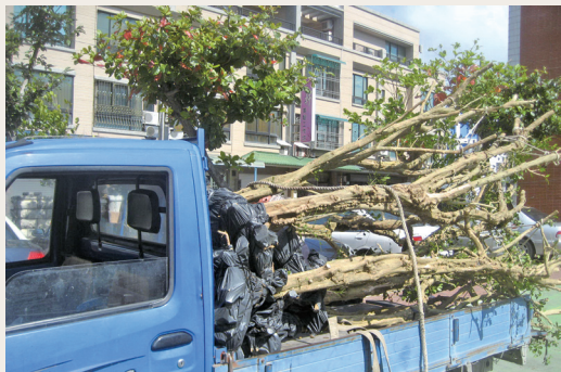
共查獲8株盜挖之七里香。(攝影/屏東林區管理處 鍾英煒)

春節剛結束，覬覦七里香者即有蠢蠢欲動的跡象，林務局屏東林區管理處恆春工作站同仁，不分日夜加強巡視，果不出預期，103年2月27日凌晨即發現嫌犯蹤跡，經通報相互聯繫，旋即由屏東處恆春工作站、屏東縣恆春警察分局及森林警察隊，經冒雨徹夜守候埋伏於恆春事業區第33林班內，凌晨3時逮捕陳姓嫌犯，查獲賊木樹齡約150年的七里香8株及車輛一台，嫌犯經押回恆春分局做筆錄後依違反「森林法」法辦。(屏東林區管理處 洪顯砮)