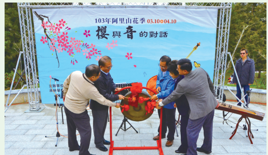
阿里山花季開鑼！

林務局嘉義林區管理處103年3月10日舉辦阿里山花季開鑼儀式，邀請香林國小學童朗誦阿里山詩集作品<我是專情的阿里>及<三月的晚霞>，更邀請台南藝術大學音樂學院同學演奏，獻給3月初春的阿里山。為帶給遊客驚喜，花季期間加碼出動國寶級蒸汽火車頭加掛檜木車廂，再現蒸汽火車穿梭花間林梢的經典畫面。嘉義處除成立遊樂區FB粉絲團，讓遊客分享賞花心得之外，更首度推出創新推出「阿里山賞櫻趣－行動導覽APP」，供遊客即時掌握賞花路線、最新花況、日出時刻及森林鐵路班次表等資訊，以利遊程規劃。(嘉義林區管理處 黃玟璇)