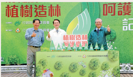
農委會副主任委員胡興華、林務局局長李桃生及森情大使劉克襄先生共同揭開植樹月序幕。(林務局提供)

農委會103年2月26日舉辦103年「植樹造林 呵護台灣」植樹月啟動記者會，正式宣告植樹月開鑼。會中邀請「關懷環境保育」為主題表演的「蘋果劇團」進行「植樹造林 呵護台灣」舞碼，更邀請到知名生態作家劉克襄先生擔任「森情大使」，為植樹月活動拉開序幕！本次記者會活動，劉克襄先生除了親自為廣告配音代言外，更摘錄新作「老樹之歌」中的部分創作，為今年植樹月量身打造詩句，並製作一款獨家酷卡，深深感動人心！林務局邀請全民勇敢表現，將呵護台灣的感情分享給大眾及親朋好友，共同攜手實踐「愛林護地，從生活做起」。(林務局 陶靜芝)