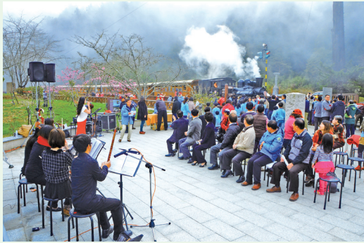
國寶級蒸汽火車頭加掛檜木車廂，再現蒸汽火車穿梭花間林梢的經典畫面。