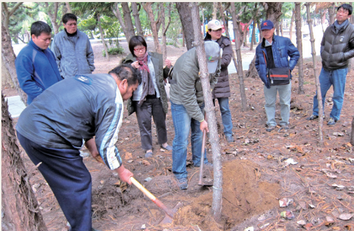
邀專家學者勘查澎湖地區小葉南洋杉疫病及取樣。

近日澎湖縣政府農漁局發現澎湖地區數十株小葉南洋杉枯萎，隨即向林務局屏東林區管理處詢求協助鑑定。屏東處獲報後即邀林業試驗所林木疫情鑑定與資訊中心專家吳孟玲組長等員前往共同勘查、取樣，鑑定結果均無發現感染褐根病，林木枯黃狀非由病蟲害因子引起，應為環境及氣候等非生物性因子所引起。屏東處將持續協助觀察及監控，待氣候回暖後林木是否能回復生長。種樹雖兼具環保及節能減碳功效，但「林木健康管理」也不容忽視，林務局亦與林業試驗所合作成立林木疫病小組、設置「林木健康服務網」，除將診斷服務案件彙整通報，作為瞭解各地林木疫情之參考外，更提供林木病蟲害防檢疫監控資訊，及民眾之林木健康檢查開放性服務窗口。(屏東林區管理處 張雯婷)