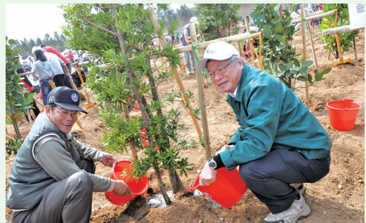
林務局局長李桃生和澎湖縣縣長王乾發共同為小樹澆水。(攝影／屏東林區管理處 劉至上)

灣」植樹及贈苗活動，澎湖縣縣長王乾發致詞時特別感謝林務局局長李桃生所帶領的團隊，長期在澎湖強風、鹽水的惡劣氣候環境下，仍然不畏艱難持續進行造林工作，造林成果如今已展現成效，縣長更希望民眾共同維護每一棵樹，讓澎湖的綠化成績一年比一年更進步。林務局自81年在澎湖迄今已造林了2,084公頃的面積，於102年已完成110公頃的造林工作、103年預計造林70公頃、104年造林20公頃，一定會達到造林200公頃的目標，在樹種的選擇上，已規劃茄苳、苦楝、台灣欒樹、恆春山枇杷等具景觀變化的樹種，更增添澎湖炫爛、美麗的色彩，讓澎湖成為一個國際知名的渡假低碳島。(屏東林區管理處 陳誼)