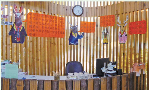
一起來認識達達馬的鹿麻吉。(攝影／員山生態教育館 魏嘉儀)

林務局羅東林區管理處員山生態教育館「Dear Deer—達達馬的鹿麻吉」春節特展，103年2月1日熱鬧登場。由於台灣沒有原生的馬科動物，本次特展藉由主角「達達馬」介紹三位鹿麻吉—台灣水鹿、梅花鹿、山羌的家族成員與生態習性。開展至今已超過1,500位大小朋友前來參觀，透過有趣豐富的學習單，學習辨別公鹿、母鹿與幼鹿的外型差異，以及相關保育知識；現場展示真實的鹿科排遺，與「決戰腳印海」小遊戲，使活動增添許多歡樂與熱鬧氣息。(員山生態教育館 魏嘉儀)