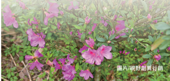
圖片/視野創異行銷

林務局羅東林區管理處與宜蘭縣壯圍鄉公所103年3月2日於公館國小舉辦「愛您一樹健康起步行—2014呵護台灣植樹造林暨春季淨灘活動」，活動豐富精彩，包括植樹、淨灘及健行活動、二手物愛心義賣(跳蚤市場)、愛心捐發票換樹苗等活動，吸引上千位民眾共襄盛舉，一同齊聚公館海灘，手植林投樹、清理廢棄物，為創造宜蘭最美麗的海岸線而努力!(羅東林區管理處 陳冠璋)