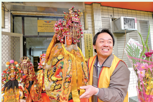
太平山莊黃經理恭請媽祖。

至翠峰湖，該夜恭駐太平山莊鎮安宮，藉此虔誠的心轉化為信仰的力量，使山區辛苦工作的員工於寂寥低潮時有份心靈的依靠、精神的寄託，並祈許太平山地區「風調雨順，柏泰林安！」(羅東林區管理處 徐俊聖)