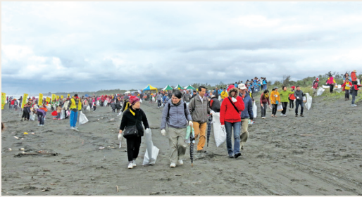
千人共同參與淨灘活動。