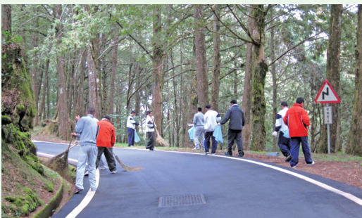
阿里山社區居民一起淨山。(攝影／嘉義林區管理處 吳宗杰)

每年3月至4月阿里山百花相繼綻放，數以萬計的遊客爭相到訪阿里山國家森林遊樂區，欣賞繁花盛開的美景，林務局嘉義林區管理處鑑於每年花季期間上山賞花的遊客絡繹不絕，為維護優質的遊憩環境，迎接103年阿里山花季，103年3月4日在阿里山國家森林遊樂區舉辦「愛青山，迎花季淨山暨森林防火宣導活動」，邀請阿里山當地居民、商店、旅社、機關、學校與國家森林志工一起參與淨山活動清理家園，並鼓勵前來阿里山的遊客共襄盛舉，為阿里山國家森林遊樂區乾淨清潔的旅遊環境盡一份心力，共同維護阿里山清淨自然的風貌。(嘉義林區管理處 吳宗杰)