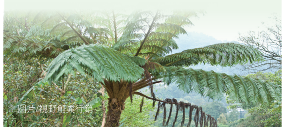
圖片/視野創異行銷