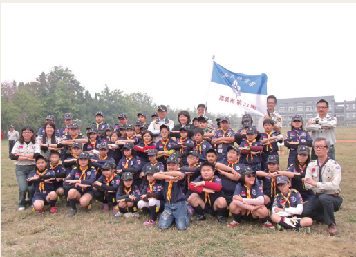
植樹活動後嘉義市童軍會合影。