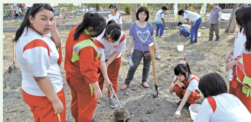
杉林國中生合力植樹。

碧如更不忘提醒同學們在種下小樹之後，要常常來觀察小樹的生長情形，也提供了同學們課堂之外最真實的自然科學教育。(屏東林區管理處 陳澄威)