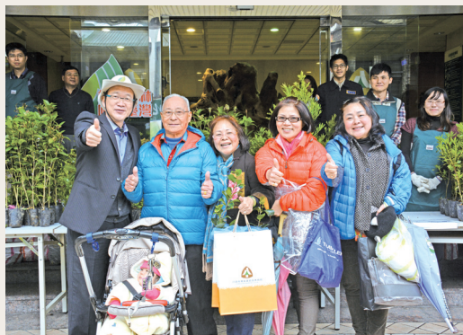
林務局免費贈送苗木，四代同堂不落人後排隊領苗。