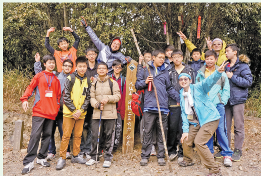
大墩國中學生攀登八仙山主峰後留影。

台中市立大墩國中自100年起，連續4年與林務局東勢林區管理處八仙山自然教育中心共同辦理科學營活動，103年八仙山自然教育中心以森林探險教育及科學探索為主題，讓學生在活動中學習大自然的智慧，並安排一天攀登八仙山主峰、挑戰自我，引導孩子體驗森林之美，探索森林與人類的關係，並培養孩子團隊合作的能力。(東勢林區管理處 李彥屏)