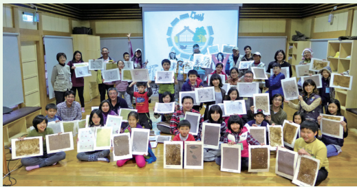
木本小蔡倫手抄紙成果秀。