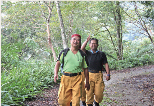
參訓之護管人員背負巡護需用裝備，完成10公里的競走路程。(攝影／台東林區管理處 林素夷)

徒步巡護，穿越險坡、湍流，克服高山峻嶺等天然險阻，有時還需面對土石流、森林火災等災害的衝擊，因此每個人亟需具備良好的體能，才能在森林環境中，確保自身安全，以完成所交付的任務。(台東林區管理處 林素夷)