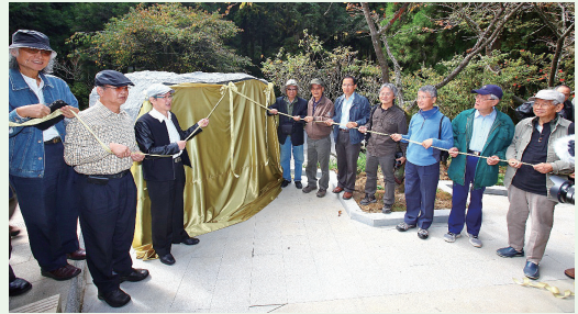
阿里山詩路入口意象揭幕。

林務局嘉義林區管理處103年10月25日在阿里山國家森林遊樂區舉辦「阿里山詩路入口意象」揭幕活動。活動現場嘉賓雲集，向明、鄭愁予、隱地、李魁賢、林煥彰、陳填、蕭蕭、白靈、渡也、路寒袖等當代詩人齊聚現場，並帶領遊客同遊詩路。15位現代詩人以阿里山為背景創作詩歌，並打造成詩碑座落於阿里山國家森林遊樂區沼平公園內，成為全台最高的「詩路步道」，站在沼平公園內詩詞步道內，讓人透過詩人的文字重新體驗阿里山，隨著四季的變化，更能體驗阿里山自然美景。(嘉義林區管理處 陳彥伶)