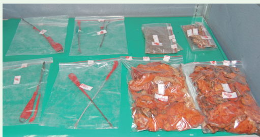
屏東處於現場取出作案工具及盜採牛樟菇等約1.6公斤。(攝影/屏東林區管理處 劉怡亨)

林務局屏東林區管理處接獲線報，有山老鼠由來義出發前往台東山區竊取牛樟芝，立刻派出查緝小組會同森林警察屏東分隊在幾處出口埋伏近6小時，無畏黑夜寒風及蚊蟲叮咬，103年11月10日晚間終於在來義林道當場查獲6名山老鼠，並查扣牛樟芝1,400公克及牛樟芝菌絲體179公克，市價近50萬，該批查獲牛樟芝數量龐大，僅次於去年查獲最多紀錄1,500公克，全案已依違反森林法及竊盜罪偵辦。(屏東林區管理處 劉怡亨)