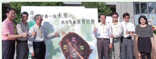
大家一起為保護烏龜「讚」。(攝影／嘉義林區管理處 黃淑芳)

開幕活動當天與會貴賓一同貼下「許龜一個未來，我的烏龜保育行動」，民眾更寫保育行動小卡，透過大眾的力量一同進行龜類動物保育。嘉義處並將在觸口設置「台灣龜類保種與研究中心」，持續進行龜類動物之保育及宣導工作。(嘉義林區管理處 黃淑芳)