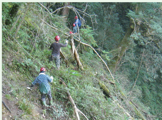
森林巡護特遣隊拔山涉水巡護山林。