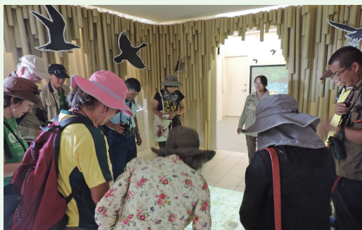
台北市野鳥學會服務國內外遊客。

林務局嘉義林區管理處與台北市野鳥學會完成「鰲鼓濕地森林園區觀海樓及東石自然生態展示館暨鰲鼓濕地森林園區旅客服務中心駐館委託專業服務」簽約，台北市野鳥學會自103年10月1日起進駐經營管理，將有助於推展鰲鼓濕地森林園區濕地保育與環境教育的價值。(嘉義林區管理處 莊茵琇)