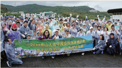
羅東處與七星、南山志工等，共築600公尺堆砂籬完成合照。

林務局羅東林區管理處、七星生態保育基金會及南山人壽志工，103年11月15日在新北市萬里區大鵬段的海岸砂地，以建構600公尺長的堆砂籬作為企業認養海岸林地的開始，每個人手拿桂竹竹芒，努力的編紮堆砂籬，短短1、2小時，原本平緩的海邊已經堆起2排堆砂籬，像一座座小城牆矗立在海邊，開始默默的執行它堆砂、定砂的任務；同時並舉辦淨灘活動，使原本滿布海飄物的沙灘，還它原本乾淨的面貌。(羅東林區管處理 林秀珍)