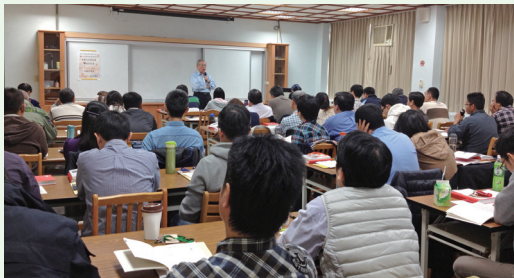
林務局局長李桃生與學員討論野生動物保育法爭議性問題。(攝影／林務局 謝書綺)

林務局為因應野生動物保育法多次修正及保育業務擴增，並提升執法人員對案件蒐證技巧、刑事與行政法規移送程序、聯合查緝平台、保育類野生動物產製品鑑識等專業技能訓練，103年11月26至28日舉辦「執行野生動物保育法新進人員專業職能實務訓練班」，邀集行政院海岸巡防署、內政部警政署保安警察第七總隊、縣(市)府、林區管理處等執法人員，計60人參與，以加強區域內政府機關案件查察通報之橫向聯繫。(林務局 謝書綺)