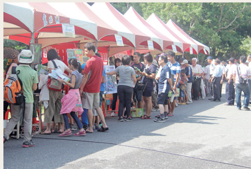
「墾丁瘋猛禽」宣導攤位吸引民眾駐足觀賞。

列活動。一早即有一群充滿好奇的民眾駐足觀海樓，等待觀賞灰面鵟鷹利用上升氣流盤旋而上形成的「鷹柱」、「鷹河」、「鷹海」等自然景觀。另外也邀請海洋生物博物館、國立中興大學、屏東科技大學、林業試驗所、後灣人文暨生態自然保育協會等機關學校及社區，以自然保育及社區林業成果展為主題之設攤及闖關活動，並於遊客中心搭配展示靜態恆春半島猛禽標本生態展及生態電影節片播放，藉以多樣化的活動與民眾互動，進而引導民眾認識自然保育的重要。(屏東林區管理處 林槿婷)