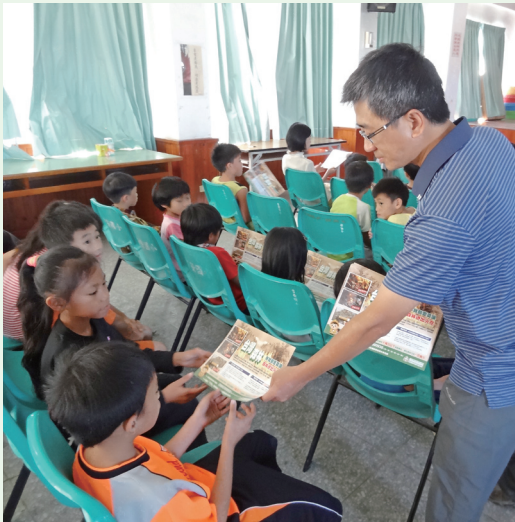
推動實施「校園愛林、護林及保林觀念宣導」工作，森林防火觀念宣導。