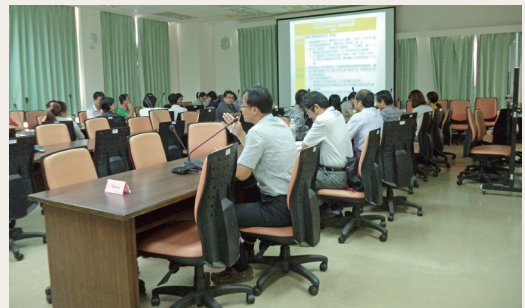
廠商針對議題發言，相互交流。

議題提案討論，期藉由雙向溝通、意見交流等方式，凝聚提升採購品質之共識，並結合公私部門力量，建立廉政夥伴關係，並強化外部風險監督機制，形塑廉能透明公正之採購環境。(屏東林區管理處 黃瑋琳)