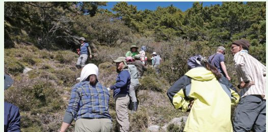
參加步道工法工作坊的志工在步道上排成人龍，以接力的方式搬運石塊，合力修復受損的步道。(攝影／台東林區管理處 楊凱琳)

智、徐銘謙等，帶領林務局及各林區管理處同仁、手作步道種子師資合計30人，在林務局台東林區管理處進行研習課程。全體人員並於21日至23日期間，實際前往嘉明湖國家步道，進行修整高山步道沖蝕溝的實務操作及學習。(台東林區管理處 林素夷)