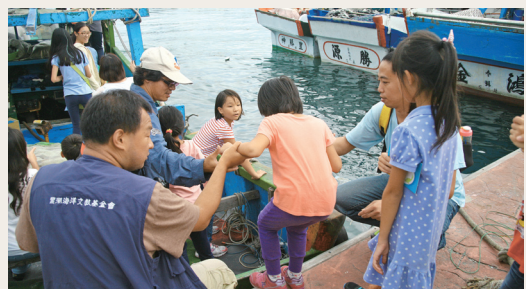
登上鰻魚船體驗海上漁夫的生活。

台灣是一個島嶼型國家，海洋魚類是我們重要的食物來源，然而台灣民眾對於餐桌上的海鮮佳餚卻普遍缺乏認識，既不瞭解它從何而來，也不清楚它所面臨的困境。林務局花蓮林區管理處池南自然教育中心103年10月25日舉辦「年年有魚」主題活動，邀請黑潮海洋文教基金會分享世界漁業資源所面臨的問題，並且一同踏查花蓮漁港，享用一頓由永續海鮮料理而成的美食。同時，在享受美食與走訪漁港之際，寓教於樂，向民眾說明海洋保護區的重要性，並且說服民眾依循「海鮮指南」來買魚、吃魚，好讓大家未來都能年年有魚！(花蓮林區管理處 陳美彤)