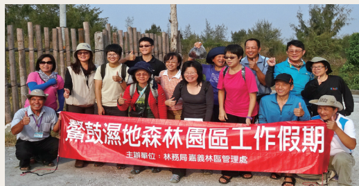
鰲鼓濕地平地森林園區生態工作假期圓滿完成。

林務局嘉義林區管理處103年10月14、15日於鰲鼓濕地平地森林園區舉辦二天一夜「砍除入侵銀合歡 維護生物多樣性」生態工作假期，本次參加工作假期的志工主要來自北部地區，參與志工表示這是一個有意義的活動，並且深入體驗園區自然人文及認識在地特色產業。期望藉由這次移除對生態有害的入侵銀合歡，營造候鳥宜居環境之外，並可藉由活動培訓種子志工，宣導大眾認識入侵種對生態環境的危害。(嘉義林區管理處 莊茵琇)