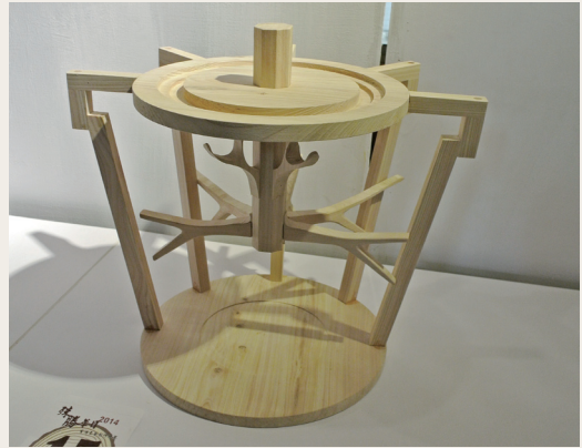
疏伐木競賽作品第一名：「小樹根」。(攝影／屏東林區管理處 楊中月)

林務局屏東林區管理處103年11月5日至17日，在墾丁國家森林遊樂區遊客中心2樓展出木工班以及疏伐木創意競賽得獎作品，期望藉由展出推廣研究、生產、製造、銷售的一貫化理念，漸而讓民眾瞭解疏伐目的之最高利用。目前台灣的木材自給率約1%，而疏伐木是經由合理林業經營的疏伐作業產出的小徑木，小徑木的價格及材質不如大徑材且在市場接受度較差，希望利用本次展覽，展現小徑木透過設計、創意與藝術構思所產出的各式生活工藝用品，不僅實用且可添增生活美學，恰恰合乎「殊勝華目」：利用珍貴稀少的自產材、由莊嚴尊重的設計理念，製成可以美化我們雙目與心靈的木製品之寓意。(屏東林區管理處 楊中月)