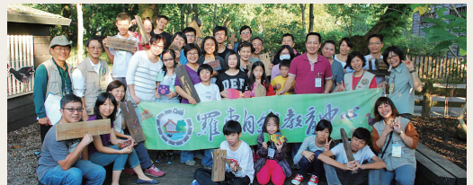
舊木奇遇記活動，大家滿載而歸！

林務局羅東林區管理處羅東自然教育中心103年11月22日舉辦「舊木奇遇記活動」，請大家一起來聽舊木頭說故事，並以簡易的木工技術改造僅屬於自己的實用、手做、獨一無二的新作品，賦予廢木材永續的新生命，更藉此活動認識國際上永續林業相關驗證系統，共同落實永續林業觀念於生活消費行動中！(羅東林區管理處 楊暄慧)