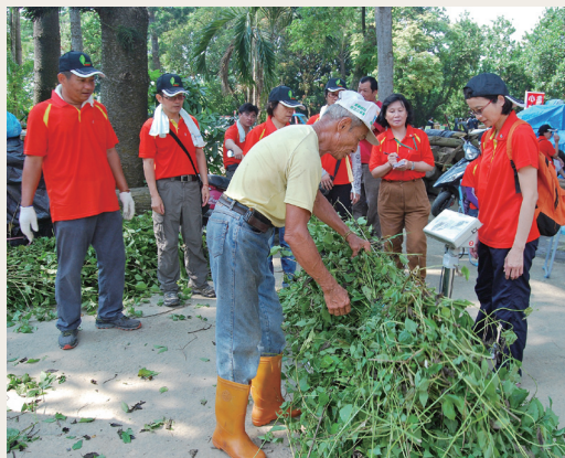
於國立中興大學新化林場進行小花蔓澤蘭防治宣導活動。

購量較去年多近4,392公斤，經檢討原因為今年特別與嘉義縣、台南市當地社區、機關及國立中興大學新化林場、國立嘉義大學社口林場合作舉辦4場小花蔓澤蘭的擴大防治宣導。另台南市政府農業局亦配合到社區辦理收購服務，亦提高民眾參加意願，亦有2,400公斤，相較比去年增加1,850公斤，成效顯著。(嘉義林區管理處 呂宜馨)