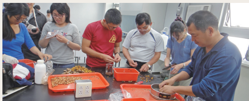
種子研習課程處理種實情形。

仁學習了解造林樹種的物候及種實的特性、處理、貯存等方法，以提升同仁自行採取的優良種源所培育苗木之苗木品質，使育苗作業與造林工作得以銜接地更加順利。(羅東林區管理處 林秀珍)