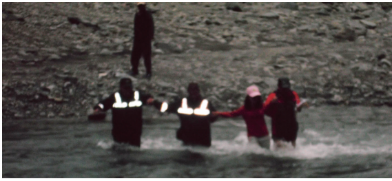
▲大武工作站人員及員警涉水渡溪前往取締擅入大武山自然保留區的民眾。