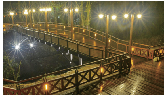
▲ 祝山林道人車分道三期新建工程－舟型跨橋夜景。

山森林遊樂區第一執勤室整修工程」及「鰲鼓濕地森林園區串連生態體驗步道二期工程」等 4 件工程獲得佳作，獲獎數量是歷年之最。（嘉義林區管理處 陳彥伶）