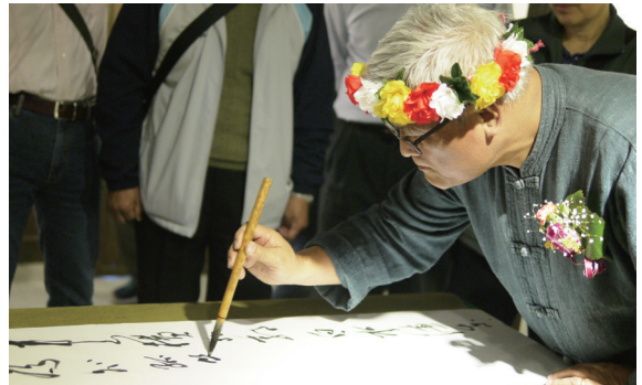
▲孫大川教授當場揮毫致贈墨寶。

林務局花蓮林區管理處於林田山林業文化園區林業生活館辦理「山海·原藝·大川趣—孫大川教授闔家塗鴉藝事」展覽，展出孫大川教授闔家共 50 多幅大作，有書法、油畫及塗鴉等多樣貌的藝術創作。104 年 1 月 24 日開幕茶會當天很榮幸邀請到孫教授闔家蒞臨，孫教授一一介紹作品，並當場揮毫致贈墨寶予花蓮處典藏，場面溫馨又熱鬧。（花蓮林區管理處 吳玫霏）