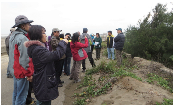
▲桃園縣新屋鄉笨子港段造林成果現勘照片。（攝影／新竹林區管理處 蔡乙源）

林務局新竹林區管理處轄屬之新北市林口區大南灣段及桃園市大園區內海墘段、蘆竹區坑子口段、新屋區笨子港段之海岸林，冬季因受強烈東北季風影響，造林須面對強風、飛沙、鹽霧、強烈日照等嚴苛環境，且行政區從新北市至苗栗縣縱長逾 150 公里，早期為了經濟開發建設形成海岸林帶普遍明顯不足，使該海岸造林工作較其他地區更為嚴峻也更為重要。103 年 12 月 2 日林務局邀請專家、學者及各林區管理處同仁至現場勘查探討海岸復育造林技術，並由林務局局長李桃生親自召開「海岸林復育造林地現勘及研商造林技術會議」，充分討論並給予技術指導，各林管處同仁也針對現場及辦理海岸林所遭遇的樣態經驗作交流討論及提供寶貴意見，對嗣後海岸造林工作有很大的助益。新竹處也將長期投入專業及人力，持續厚植海岸林資源，達成海岸國土保安的長遠公益目標，造福全民。（新竹林區管理處 蔡乙源）