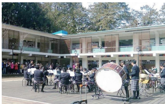
▲嘉義市博愛國小管樂表演。