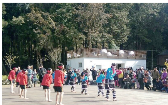
▲香林國小鄒族舞蹈表演。