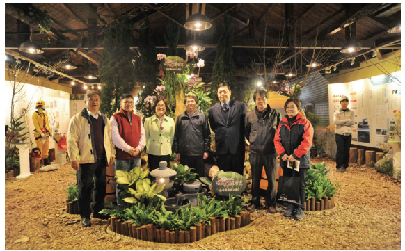
▲「森林護管員・守護森林之戰」特展。