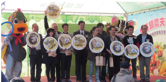
▲石虎平安龜保育展開幕典禮活動。

石虎的保育，首要的工作是了解其地理分布及族群量，並且針對不同的威脅因子進行適當的經營管理措施。由於石虎與人類的活動範圍重疊度高，人類對棲地的開發利用直接影響到石虎的存續。林務局南投林區管理處、特有生物研究保育中心、南投縣政府、台北市立動物園及集集鎮公所等單位，104年1月11日在南投縣集集鎮集集驛站聯合舉行「石虎平安龜保育與創作特展」開幕典禮活動，宣導石虎及食蛇龜保育觀念及行動，活動當日計約500人次參與。此外，南投處與研究團隊正積極與當地農民溝通，希望能讓他們了解石虎的價值及重要性，並減少藥物使用，創造友善石虎的棲地，供其自然繁衍棲息。(南投林區管理處 蔡碧麗)