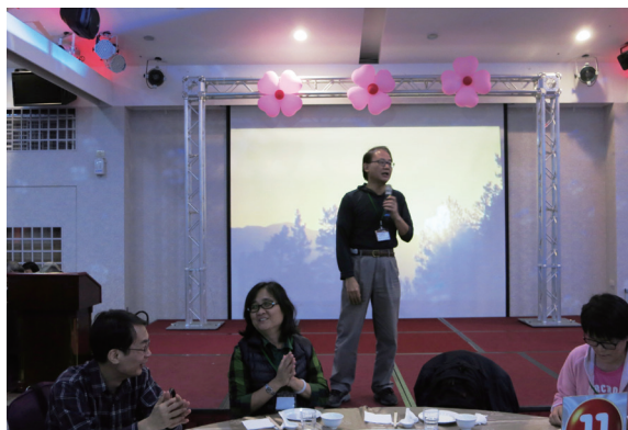
▲林務局69周年局慶研習活動中副局長楊宏志期勉同仁善盡社會公民的責任，重視環境教育，並積極走入社區、走進校園，為捍衛山林之美共同努力。（攝影／林務局 陳璿憶）

「69周年局慶－森體力行、體驗自然環境教育研習」，期藉登山健行、觀景及森林浴活動，體驗自然環境生態。本次活動由人事室會同羅東林區管理處、森林育樂組及政風室精心策劃，以「森體力行、體驗自然環境教育」為活動宗旨。活動當天除有政風室設置攤位，以有獎徵答方式宣導政風法令外，羅東處亦請林美社區設置攤位，陳列地方特色產物。當天氣候涼爽宜人，總計約有 250 人參加。（林務局 陳璿憶）