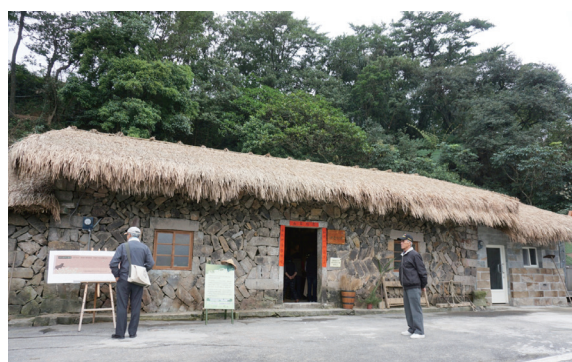
▲可做貢寮區水梯田環境教育教室的田邊聊寮。(攝影／林務局 許曉華)

空間設計，名為《田邊聊寮》，作為環境教育活動的教室，104年1月落成啟用，由生產班農友與林務局管立豪組長一同為土地板完成最後的夯實，見證貢寮水梯田復育成果的新里程碑。期讓民眾瞭解保育濕地生態系及復育水梯田理念，並提供相關解說資訊，逐步聊出更多友善生活的可能。(林務局 許曉華)