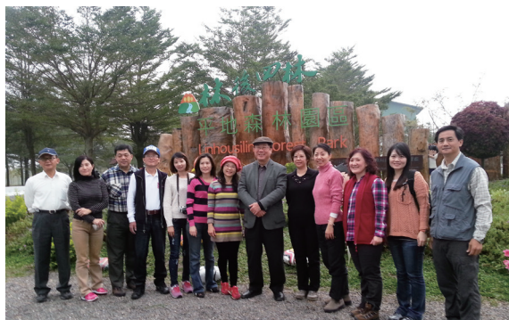
▲農委會主委陳保基及主秘戴玉燕在林後四林平地森林園區與記者相見歡。（攝影／林務局 林娉妃）

林務局推動愛台 12 建設之植樹造林計畫，設置花蓮大農大富、嘉義鰲鼓濕地及屏東林後四林三處大型平地森林園區，至 103 年均已全數完成，提供了國人豐富景觀、多元生態、節能低碳且更易親近之平地森林生態旅遊及環境教育新場域，教導民眾及學童對資源環境的尊重、對社區的認知、對生態的概念及對生活的態度。另自 91 年起全面建置國家步道系統，並將建置成果轉化成步道歷史叢書，以故事行銷方式讓民眾認識台灣山林之美，如走過五百年的浸水營古道，是一條貫穿台灣歷史的步道，是曾經生活在這島嶼上的人們，以生命血肉寫成的感人故事。林務局為推展生態旅遊、環境保育、無痕山林理念，103 年 12 月 26、27 日辦理「林後四林慢慢遊 浸在眼前古道幽」媒體參訪活動，邀請媒體記者走訪林後四林平地森林園區及浸水營古道，共有 12 位記者參與，農委會主任委員陳保基及主任秘書戴玉燕並親自南下與記者交流，活動也邀請古道研究巨擘楊南郡及徐如林老師隨隊解說。（林務局 林娉妃）