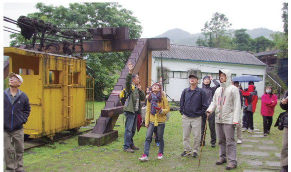
▲欣賞「哪啊哪啊～神去村」影片，會後由環境教育教師帶領學員認識池南國家森林遊樂區的林業機具。（池南自然教育中心提供）

愛護森林，從林業開始！由於國土保育的需要，近年來林務局的林業政策由伐木、造林轉為森林生態保育為主軸，一般大眾只能透過靜態的展示瞭解那些逐漸沒落的林業歷史、文化與生活。林務局花蓮林區管理處池南自然教育中心 104 年 1 月 24 日舉辦山林影展主題活動，播放日本影片「哪啊哪啊～神去村」，透過有趣的影片故事，帶領民眾領略林業生活的辛苦與甘甜。同時，透過影片結束後的有獎徵答與分享活動，傳達林務局現階段的造林工作與林業政策，讓民眾也能瞭解森林永續經營以及保育工作的重要性。（花蓮林區管理處 陳美彤）