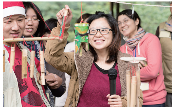
▲學員利用竹子製作風鈴。

心辦裡「耶誕木工坊」主題活動，邀請民眾發揮創意製作耶誕風鈴。「風鈴」是東方文明中非常重要的傳統工藝，無論是風鈴本身的材質還是造型都相當的多變，行走在八仙山森林小徑上收集落葉、枝條，結合各式的木片、竹筒，讓學員發揮個人創意，親手 DIY 創作屬於自己的手作木工紀念物，讓山風拂過時可清楚的感受到耶誕節的暖意。（東勢林區管理處 李彥屏）