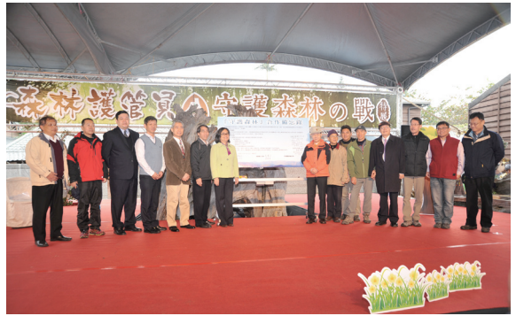
▲登山團體結盟及MOU簽署。

林務局羅東林區管理處為使民眾了解「森林護管員」工作內容、型態之重要性、危險性以及不可取代性，特於太平山百年系列活動中舉辦「森林護管員・守護森林之戰」特展，希望透過深入淺出方式，展現其工作辛苦一面；104年1月17日活動開幕當日，另邀請登山團體、執行加強森林保護計畫社區協會，並在宜蘭地檢署姜檢察長見證下，舉行「愛林、保林、護林結盟儀式」，一同簽署MOU（合作備忘錄），共同為太平山百年做見證，成為山林守護者。（羅東林區管處理 李威震）