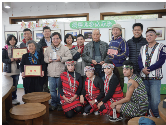
▲東眼山之美攝影比賽成果展。

透過鏡頭來捕捉東眼山自然環境與生態之間的美麗景像，並以行動落實無痕山林之輕裝簡行的秋之旅，經由專業評審小組從一百三十多件攝影作品中，挑選出二十五件作品，103年12月27日於東眼山國家森林遊樂區進行頒獎暨攝影成果展，展期至104年3月份，讓民眾體驗森林生態環境以及閱讀一望無際的柳杉樹海以及壯麗的雲瀑景觀等生態景緻。 (新竹林區管理處 陳鳳珠)