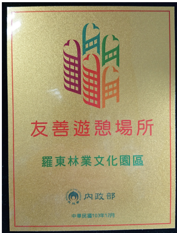
▲羅東林業文化園區獲選為友善遊憩場所。