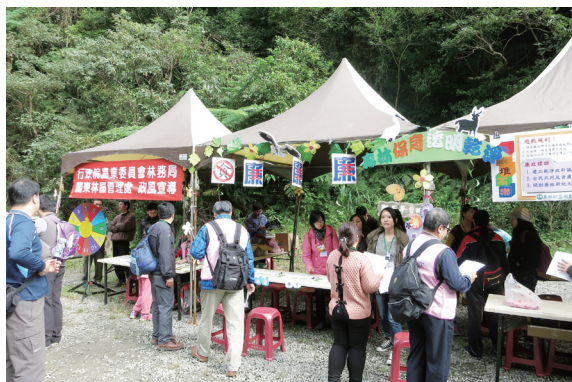
▲政風室設置攤位宣導政風法令。