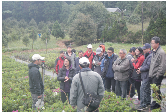
▲監工講習育苗現場取樣說明。

有鑑於以往培育造林所需苗木多採外包作業，致使種源無法掌控，導致所培育苗木品質良莠不齊，影響造林成效；為提升苗木品質，並使育苗作業與造林工作可以銜接，培育更多形質優良的苗木，林務局羅東林區管理處 103 年 12 月 2 日於四堵苗圃辦理造林育苗監工講習，對造林監工職責及現場執行工作進行經驗分享，充實林業人的本職學能，讓造林工作更加順利，期待能為下一代留下一片森林。（羅東林區管處理 林秀珍）