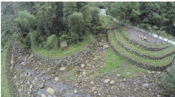
▲野薑花溪。

嘉義縣梅山鄉瑞里山區的「野薑花溪」是一處風光明媚著名的登山健行景點。因莫拉克風災後造成河道嚴重淤積、邊坡土石崩塌、自然生態景觀遭受破壞，林務局嘉義林區管理處採「生態工法」辦理治理復育工作，以「就地取材」、「穩固邊坡」、「植生綠化」、「棲地重建」及「景觀再造」為治理方針，另與沿線地景作融合，廣植野薑花、腎蕨、山櫻花等當地樹種，綠美化周邊景色並涵養水源，創造賞景、休憩駐足空間。工程完工後深受當地居民及遊客讚賞，另外節能減碳之優異成效，更增加「環境教育」的附加價值。野薑花溪工程經 103 年公共工程委員會金質獎評審小組評鑑，獲得第 14 屆金質獎－水利類優等獎之肯定，並於 103 年 12 月 12 日由嘉義處處長廖一光代表受頒。（嘉義林區管理處 黃洸駿）