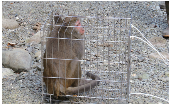
▲掀開布幕準備野放台灣獼猴。(攝影/屏東林區管理處 徐伯玖)

林務局屏東林區管理處六龜工作站巡視人員103年12月19日巡視十八羅漢山自然保護區時，發現一隻誤中獸夾之台灣獼猴，左腳掌嚴重受傷，經聯繫屏東科技大學獸醫及研究人員協助救傷後，將該獼猴帶回學校進行治療，違法陷阱立即拆除並沒入。經過近一個月之治療後，被研究人員取名「六龜」之台灣獼猴原本鮮血淋漓的傷口已康復，研究團隊和現場巡視員評估及討論後，104年1月13日進行原地野放，雖然台灣獼猴略顯緊張，但在鐵籠開啟後，仍迅速回到山林，野放過程順利。(屏東林區管理處 廖宸玉、徐伯玖)