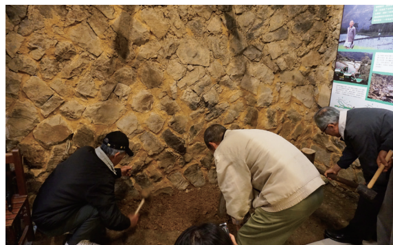
▲田邊聊寮開張前由當地老農進行泥土地板最後夯實工作。