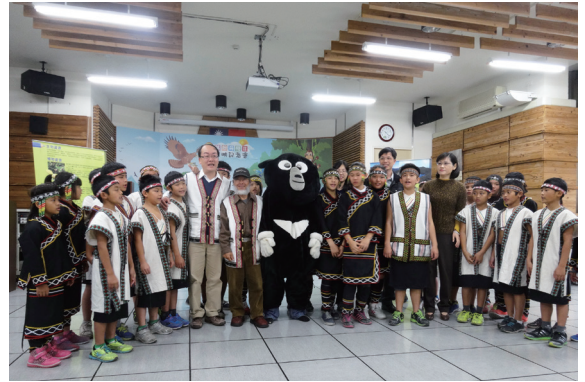
▲大家一起齊呼：大家好！我們都是一家人，不論人類族群、動物及森林都應該相親相愛，相互尊重。