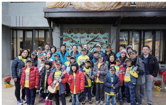
▲阿里山生態館啟用香林國小畫作參與情形。(攝影/嘉義林區管理處 陳弘益)

生態教育館正式啟用，隨後現場貴賓與師生們於祈願卡寫下對自然保育的期許與遠景，最後由專業駐館解說服務人員導覽參觀生態教育館，為整個開幕活動畫下圓滿句點。(嘉義林區管理處 吳宗杰)