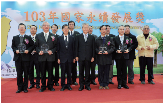
▲ 行政院院長毛治國與 103 年國家永續發展獎得獎單位代表合影。（攝影／侯祖德）

年 12 月 30 日於行政院一樓禮堂由毛治國院長親自頒發獎座，以資鼓勵。此為林務局連續第三年獲得永續發展獎，頒獎前永續會委員余範英女士，特別指出林務局因為局長帶領同仁推動業務的方向正確，所推動的業務均符合永續發展的概念，得到永續發展獎是實至名歸。（林務局 許曉華）