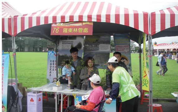
▲捐發票送樹苗。

票 10 張，即可用愛心捐發票方式獲得苗木 1 株，除支持社會公益及表達對身障者的關懷外，並將募得之發票統一捐贈給聯合勸募基金會，讓民眾在響應愛心活動之餘也為綠化家園盡一份心力。（羅東林區管處理 陳美貞）