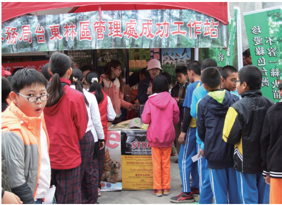
▲定點防火宣導活動現場師生踴躍參加。（攝影／台東林區管理處 黃妙霖）

場共有成功國小、三民國小及成功鎮立幼兒園等，合計 200 餘名師生踴躍參加。消防人員及台東處成功工作站人員對小朋友進行保林防火、保育知識的有獎徵答，答對者贈送精美紀念品，小朋友們競相參與、反應熱烈；現場同時以電腦播放影片的方式，教導幼稚園兒童愛護綠蠺龜、山羌、台灣獼猴等野生動物，不隨意餵食、捕捉、獵殺等，期望藉由問答及播放影片，使愛林、保林、護林觀念能自小教育、向下紮根。（台東林區管理處 黃妙霖）