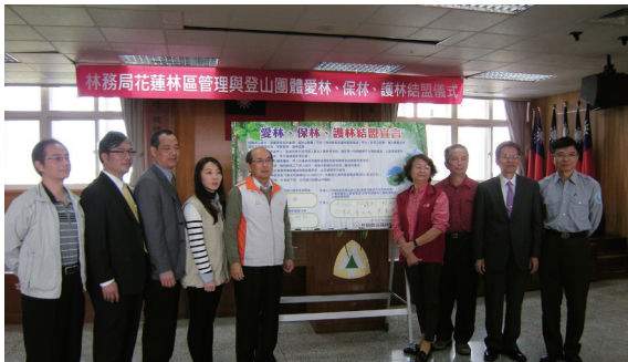
▲「愛林、保林、護林結盟」宣言簽署與會來賓大合照。（攝影／花蓮林區管理處 許爾文）

管理處、花蓮縣警察局、保七第九大隊、花蓮地區的登山協會參與結盟，由檢察長親自出席見證了整個結盟儀式，使得這個活動更具有意義。（花蓮林區管理處 吳耀楠）