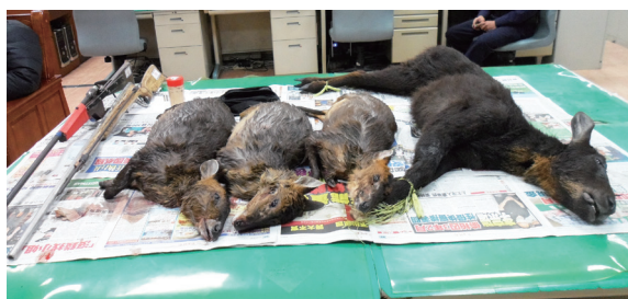
▲查獲之2把土造獵槍，獵殺台灣野山羊1隻、山羌3隻。