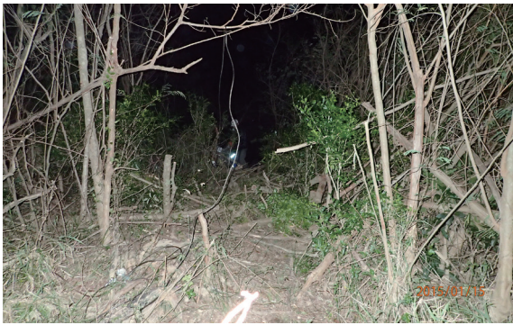
▲盜挖七里香現場。（攝影／屏東林區管理處 吳俊鈴）

立即衝出上前逮捕，當場逮捕陳姓嫌犯，另2名嫌犯趁亂逃逸，但查緝人員仍不放棄追捕，經過追逐，又逮獲另1名嫌犯，而另1名嫌犯則逃逸無蹤，目前警方仍持續追緝中。本案一共查獲6株賊木樹齡約20至110年不等之七里香，併查扣犯案工具1批與查扣車輛1台，全案由恆春分局依違反「森林法」偵辦中。（屏東林區管理處 吳俊鈴）