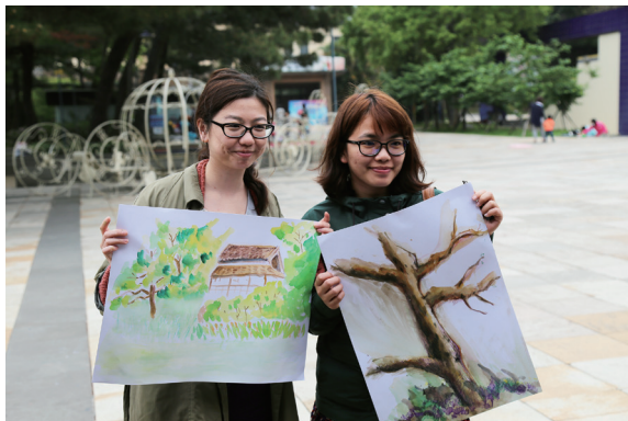
▲邀請民眾彩繪老樹風貌，用不同的角度探索老樹與記錄巨木之美，為老樹留下美麗的印記。