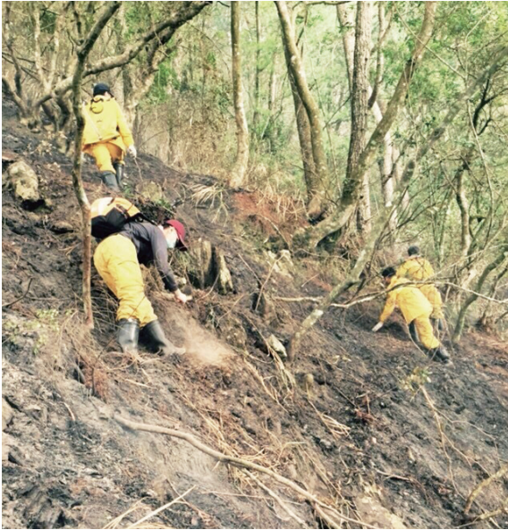
▲搶救森林火災現場照片。