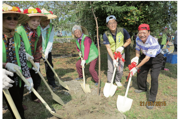
▲臺東縣縣長黃健庭和臺東處處長張鐵柱一起協助迦南銀髮生活福祉中心的長者鏟土種樹。

林，再添生力軍。今年的音樂同樂會表演團體精湛的表演獲得全場熱烈的掌聲！最後三組同樂曲目讓全體演員都樂開懷，嗨翻森林公園，為今年的音樂同樂會，畫下完美的句點！（臺東林區管理處 林素夷）