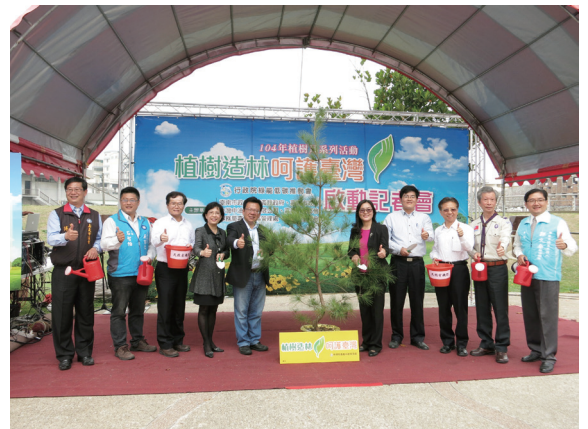
▲植樹月啟動儀式。（攝影／嘉義林區管理處 黃淑芳）

林務局嘉義林區管理處 104 年 2 月 26 日於嘉義市森林之歌辦理 104 年「植樹造林 呵護臺灣」植樹月系列啟動記者會，鼓勵大家「春天來種樹」，現場約有 500 位熱情民眾參與。蒞臨活動的貴賓，共同為臺灣五葉松樹苗鬆土、施肥、澆水，象徵 3 月 1 日至 3 月 31 日植樹月「植樹造林 呵護臺灣」活動正式啟動。嘉義處除以「植樹與護樹」為活動主軸，分別與臺南市政府、臺南市童軍會、嘉義市政府、嘉義市童軍會、嘉義縣政府、台灣中油等 6 單位共同合作辦理 3 場區域植樹、護樹活動外，於嘉義處轄區 3 個地點在植樹月辦理「天天贈苗活動」，臺南市政府則發動 25 個區公所街道同步植樹，6 個社區響應植樹，預計將種下 3 萬株苗木。（嘉義林區管理處 黃淑芳）