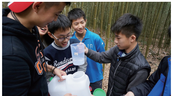
▲學生在竹林測試不同的地被狀況與地表逕流的影響。