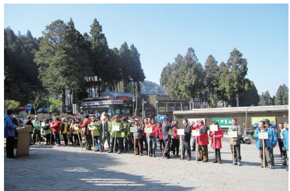
▲ 阿里山社區居民一起參與淨山活動。（攝影／嘉義林區管理處 吳宗杰）

每年 3 月至 4 月期間阿里山百花相繼綻放，數以萬計的遊客爭相到訪阿里山國家森林遊樂區，欣賞繁花盛開的美景，林務局嘉義林區管理處鑑於每年花季期間上山賞花的遊客絡繹不絕，為維護優質的遊憩環境，迎接 104 年阿里山花季，104 年 3 月 3 日於阿里山國家森林遊樂區舉辦「愛青山，迎花季淨山暨森林防火宣導活動」，邀請阿里山當地居民、商店、旅社、機關、學校與國家森林志工一起參與淨山活動清理家園，並鼓勵當日前來阿里山的遊客共襄盛舉，為阿里山國家森林遊樂區乾淨清潔的旅遊環境盡一份心力，共同維護阿里山清淨自然的風貌。（嘉義林區管理處 吳宗杰）