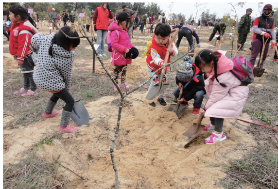
▲小朋友在凜冽寒風中種小樹熱情不減。（攝影／羅東林區管理處 郭倩文）

林務局羅東林區管理處 104 年 3 月 11 日受邀參加金門植樹節活動，金門縣政府選擇於原生產油原料已廢棄的長石礦區舉行，藉由植樹以恢復植生。當日軍民一同種下金門原生植物—豆梨、相思樹、潺槁樹、苦楝、黃連木及朴樹 6 種樹苗。此次栽植之豆梨，盛開時風采不輸流蘇。因豆梨果實小且乾澀，不適合人類食用，而可留下，成為鳥類的最愛，提供前來金門棲息的鳥類食物的來源。（羅東林區管理處 郭倩文）