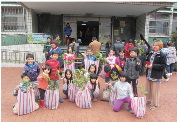
▲新竹處大門口準備桂花等計 1,200 株，民眾反應熱烈，活動現場還有幼兒園老師帶著小朋友共襄盛舉。

林務局新竹林區管理處為響應「行政院綠能低碳推動會系列宣傳活動之低碳社會節能生活」及「植樹造林 呵護臺灣」植樹月宗旨，首波活動於 104 年 3 月 5 日上午於新竹處大門口及所屬工作站，烏來工作站三峽分站門口、海岸林工作站門口、大溪工作站停車場、竹東工作站門口、大湖工作站門口等 6 個地點揭開序幕，同步贈送桂花、杜鵑、茶花、含笑等 5,000 株的苗木給民眾種植，活動憑 104 年 1-3 月份統一發票兌換苗木，每 2 張兌換 1 株苗木，收集的發票將轉送慈善團體，鼓勵民眾自主參與植樹活動及綠美化家園，共同呵護臺灣美麗的綠色資產外，也號召大家一起來做公益。（新竹林區管理處 黃婉如）