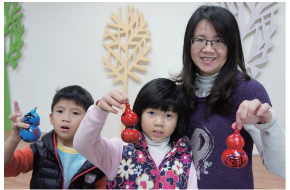
▲將蝙蝠印象彩繪在福氣葫蘆上。

「蝙蝠一定住在山洞裡嗎？」「牠們都會吸血嗎？」林務局嘉義林區管理處觸口自然教育中心104年2月7日辦理的「『蝠』氣到我家－蝙蝠保母訓練」，解開了許多民眾心中對於蝙蝠的疑惑，並讓民眾將蝙蝠印象彩繪在福氣葫蘆上，帶著滿滿的「蝠」氣回家迎接104年春節的到來。由於蝙蝠晝伏夜出的生態習性，黑夜中的身影往往給人神秘奇特的觀感，為了拉近民眾與蝙蝠的距離，觸口自然教育中心環境教育教師設計生動有趣的「『蝠』氣到我家」主題活動，帶領民眾親自體驗蝙蝠生態；例如「蝙蝠在黑夜中都怎麼找食物呢？」民眾透過閉起眼睛、利用聽覺尋找目標，模擬蝙蝠回聲定位，了解黑夜中蝙蝠的覓食方式。（嘉義林區管理處 陳淑芳）