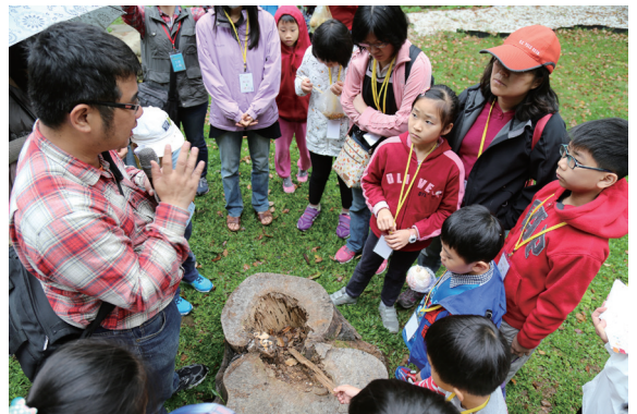
▲老樹健診保育中，用具體行動實踐國際森林日理念。(攝影／新竹林區管理處 黃婉如)

3月21日國際森林日，為鼓勵民眾實地親近大樹，喚起國人對珍貴老樹的關心及傳遞正確的生態保育觀念，林務局新竹林區管理處與新竹市政府、林業試驗所104年3月21日在新竹公園舉辦「閱讀老樹－導覽解說、健診保育及寫生」植樹節系列活動，規劃以在老樹下邊走邊學的概念為主軸，除了有老樹達人分享老樹與土地故事外，並由林驗試驗所專家教大家辨別樹木的身體語言、讀懂老樹發出的SOS，活動當日更有將近200位的大小朋友加入老樹寫生活動，結合藝術與自然生態，用不同的角度探索老樹與記錄巨木之美，新竹處並送給完成寫生民眾小樹苗，呼籲大家一起撫育小樹、守護大樹。(新竹林區管理處 黃婉如)