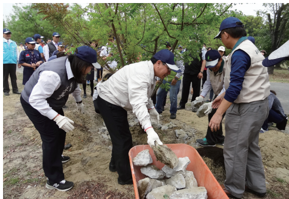
▲林務局副局長楊宏志、嘉義處處長廖一光、嘉義市市長涂醒哲、李俊俚立法委員等貴賓，用大鐵鎚將阻礙樹木成長水泥敲開。（攝影／嘉義林區管理處 黃淑芳）

開，讓樹木深呼吸，接著鬆土，施肥，澆水，讓種下的樹木有更好的生長環境，樹木才會健康成長、茁壯成大樹。政府的資源有限，民間的力量無窮，該場地為興嘉國小代管地，每年需花費財力、人力管理，國泰慈善基金會展現企業社會責任，認養後續護樹工作，活動中進行護樹認養儀式，希望拋磚引玉，讓有心想為台灣社會與環境做事的企業，一起投入護樹的行動。（嘉義林區管理處 黃淑芳）