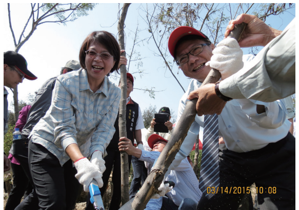
▲屏東處處長黃妙修及屏東縣縣長潘孟安共同剷除銀合歡。

活動共剷除 0.66 公頃銀合歡，並種下臺灣海桐、臺灣樹蘭及黃心柿等 300 株原生林木。現場由屏東處、社頂部落分別推出銀合歡羊咩咩及木片種子 DIY，水蛙窟社區則展示銀合歡的鑰匙圈、燭臺、盤子等作品，高士社區的香菇椴木讓遊客瞭解香菇如何生長；海生館則展出養魚不換水、種菜不施肥的魚菜共生示範。而經過屏東處炭化處理後的銀合歡，則具有除臭、調節濕度、淨化水質等功能，一系列的多目標展示，讓民眾瞭解銀合歡剷除後的相關用途。（屏東林區管理處 陳誼）