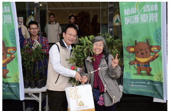
▲熱情民眾從清晨 5 點多即至林務局門口排隊領苗，拔得頭籌。

樹造林心手相牽—廉潔飛揚」填問卷及拍拍樂送宣傳品，現場氣氛相當熱絡，2,500 株杜鵑、茶花、桂花、春不老樹苗不到 1 個半小時全部發送完畢，共回收廢電池 55 公斤，期望透過贈苗活動能將植樹造林、綠化環境及環境保育的觀念深植人心。（林務局 廖國吟）