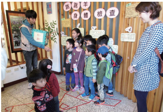
▲玩跳跳羊的身體檢查認識野山羊特徵。（攝影／員山生態教育館 洪致文）

林務局羅東林區管理處員山生態教育館為迎接新春到來，104年2月1日起推出應景春節「喜羊羊迎春趣」特展，與遊客歡慶農曆羊年。今年特展主角是山林間的輕功高手——「台灣野山羊」，展示內容將平日難以見到的野山羊外觀特徵、生態習性透過可愛活潑的形式呈現在大家眼前，另外搭配特展設計趣味小任務，還有利用紅包創作窗花DIY活動。（員山生態教育館 洪致文）