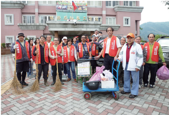
▲臺東處知本工作站人員及建興里居民的合作用下，清掃成果「收穫滿滿」，社區內的街道巷弄及水溝都變得更乾淨。