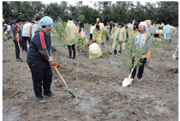
▲美崙國中師長帶領學生參與林管處植樹活動，直呼是一場有意義的環境課程體驗。

104 年花蓮縣區域植樹活動 104 年 3 月 11 日在花蓮市大本運動公園盛大舉行，林務局花蓮林區管理處、花蓮縣政府及花蓮市公所共同辦理，花崗國中、美崙國中及國風國中學生由師長帶領前往，參與民眾及學生非常熱烈約有 1,000 人到場。花蓮縣縣長傅崐萇、花蓮市市長田智宣、花蓮處處長吳坤銘等長官共同帶領民眾及學生，一起進行愛林宣言並種下具耐風、耐鹽、耐寒、耐旱的之毛柿、台灣海桐、厚葉石斑木及木麻黃防風樹種。活動會場由機關、學校及社區設置 23 個闖關攤位，提供學生及民眾參與，透過互動傳達植樹造林、節能減碳、愛護臺灣的觀念。（花蓮林區管理處 陳靜儀）