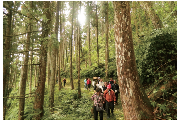
▲南投處帶領媒體深入山區採訪情形。

特別邀請南投地區媒體朋友一同前往，並參訪以生產穗條培育扦插苗以供造林應用之牛樟採穗園，當日由資深同仁現場示範牛樟採穗及扦插畫面，藉此讓媒體了解林業工作之專業及辛勞，並獲得客家電視台等媒體正面報導。 📷