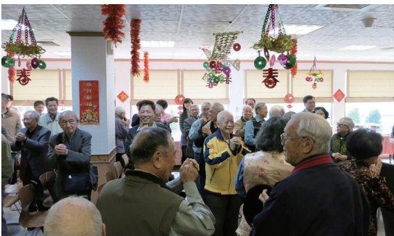
▲「104年度新春茶會」林務局現職同仁及退休人員熱情參與，互道恭喜。

林務局為慶祝新春佳節，延續激發同仁向心力並聯繫情誼，104年2月24日（大年初六）在林務局7樓餐廳舉辦「104年新春茶會」，本次活動係由人事室、秘書室及職工福利委員會共同精心策劃，以「經驗傳承」為題，邀請退休人員返局共襄盛舉，由局長李桃生親自主持，帶領各級主管、現職同仁及退休人員進行新春團拜，並期勉員工能在退休前輩奠定的基礎下，一棒傳一棒，發揚林業人勤勞質樸的精神，堅守崗位，做好林業的千秋事業，讓我們生存的環境能永續發展，生生不息。總計參與人數約300餘人。（林務局 洪郁茜）