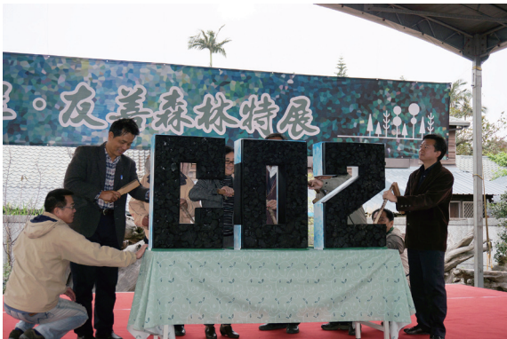
▲ 貴賓合力擊破CO 2 。