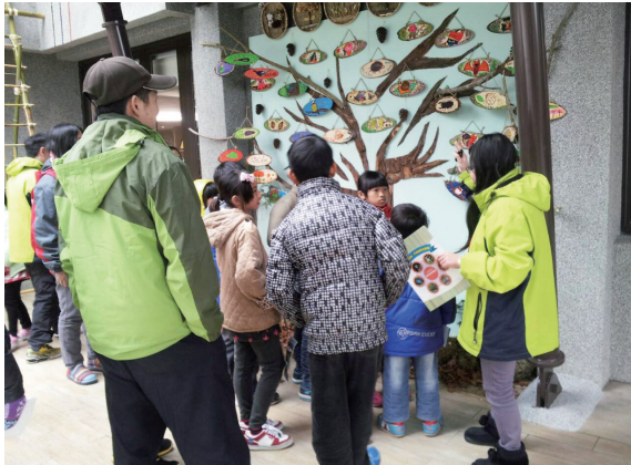
▲帶小朋友認識阿里山常見的動植物。

動植物生態、林業文化歷史並傳遞正確的保育知識，讓參與的小朋友驚呼「原來阿里山這麼好玩」，也感受到加成公司及嘉義處在寒冬過後的溫暖。（嘉義林區管理處 許玉青）