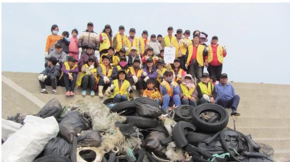
▲外埔漁港淨灘活動清理出來的大型垃圾。

精心策劃了主題多元、內容豐富宣導攤位，包括保林愛林、外來種入侵防治、治山林道永續環境、生態保育、環境教育推廣等內容，一一秀給大家。同日另一場外埔漁港淨灘活動，係由新竹處也與苗栗縣後龍鎮公所合力辦理，由後龍鎮公所動員轄下 17 個環保義工隊熱情參與，此場活動除了針對海灘卵石區域進行垃圾撿拾外，也針對海岸線周邊保安林區域進行環境清潔。104 年 3 月 22 日，兩地千人同步守護海岸線活動圓滿成功，是日清理出來垃圾量一般廢棄物高達 8 公噸、資源回收物約 4.5 公噸，除了用行動 HOLD 住海洋外，也為西海岸減塑，加綠。（新竹林區管理處 黃婉如）