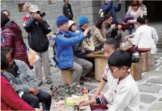
▲吸引國內外遊客駐足茶席聽音品茗。