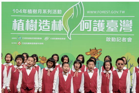
▲陽光校園合唱團演出植樹月主題曲「愛心樹 遍人間」，深深感動人心。