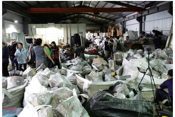
▲破獲盜採國有林牛樟木現場照片。(攝影/東勢林區管理處 陳幸欣)

林務局東勢林區管理處、臺中地檢署、刑事警察局及森林警察等單位，104年3月18日下午在苗栗縣公館鄉某工廠共同埋伏破獲盜採國有林牛樟木，起出非法牛樟木 5,092 塊，重 87,311 公斤，市值逾 2 千萬元。因贓木數量龐大，若未即時處理，恐有遺失或遭掉包風險，東勢處立即動員超過 50 名人力連夜清點，並請新竹處大湖工作站就近派員協助，連夜商請吊運卡車及堆高機停休加班，歷經 3 天 2 夜，動用 8.8t-17t 吊卡車 19 台、23t 吊卡車 4 台、堆高機 5 工等，將贓木運回雙崎工作站統一保管。（東勢林區管理處 陳幸欣）