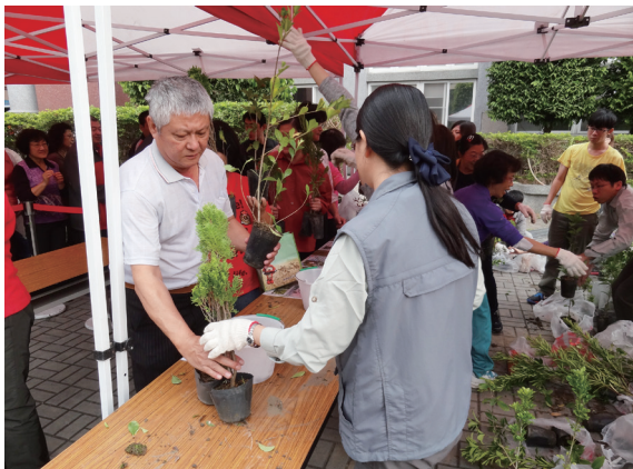
▲民眾依序排隊領苗。

等候，屏東處則規劃設計有獎徵答活動，在主持人妙語如珠及幽默風趣的帶動下，場面更顯熱鬧有趣。林後四林平地森林園區的拔除外來種換樹苗活動，達到了移除外來種及植樹減碳的雙重效益；雙流、墾丁以入園發票換樹苗，讓遊樂區的遊客個個有意外驚喜；恆春、旗山、六龜工作站的場次則吸引了鄰近學生及里民來參加，大家紛紛領取了喜歡的樹苗回家種植。今天共計送出 4,600 株樹苗，看到民眾拿廢電池到場換取樹苗，也自行攜帶裝樹苗的容器，對於大家願意付諸行動改善居住環境感到相當高興，而所收集到的廢電池於兌換現金後，也將全數捐予公益團體。（屏東林區管理處 陳誼）