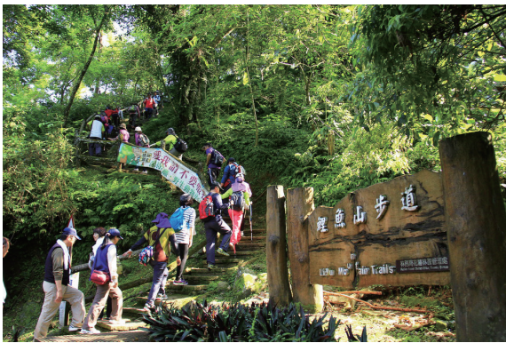
▲民眾任擇登山口向上攀登。

盡情享受森林芬多精。活動當日，500 多位民眾由鯉魚潭潭南大草皮出發，任擇一處登山口蒐集活動戳章，沿途輕鬆漫步林間、俯瞰幽靜潭面。中午時分，許多完成活動路線、兌換推廣品的民眾一手拎著樹苗、一手拎著餐盒，紛紛表示明年還要再來參加這麼低碳樂活、開心健行的植樹月活動。（花蓮林區管理處 陳佳玫）