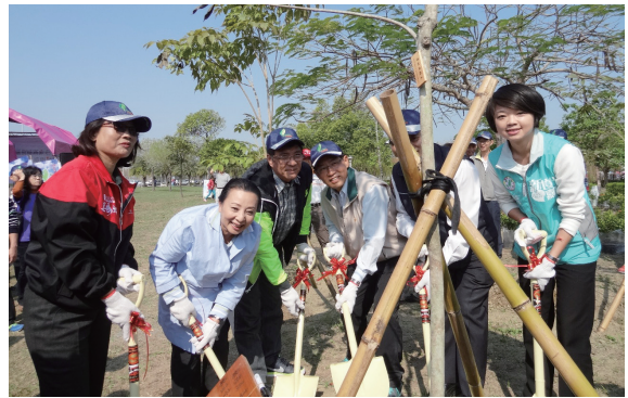
▲ 縣長張花冠、嘉義處處長廖一光及其他貴賓共同植樹。（攝影／嘉義林區管理處 黃淑芳）

林務局嘉義林區管理處、嘉義縣政府 104 年 3 月 1 日嘉義縣太保市嘉己人公園辦理「造林呵護咱臺灣植樹綠滿家己人」植樹活動，計有 500 位愛樹愛環境的民眾參加。為鼓勵社區參與社區綠美化，會中並頒獎給參與綠美化成績優良模範社區獎中埔鄉瑞豐社區發展協會。當天嘉義處處長廖一光、縣長張花冠等多位貴賓及現場民眾共同種下洋紅風鈴木、矮仙丹，為公園增加美麗的花海景觀。活動還安排廉政、反貪政令宣導有獎徵答，林業試驗所中埔分所現場提供民眾植物養護資訊，現場民眾爭相體驗森林護管員深山特遣重裝備（20 公斤）體驗活動，現場並準備桂花、茉莉花 1,000 株苗木免費贈送，民眾反應熱烈，不到 1 小時即贈送完畢，嘉義處廖處長特別贈送苗木給現場參加活動的嘉義縣近百歲人瑞李女士。（嘉義林區管理處 黃淑芳）