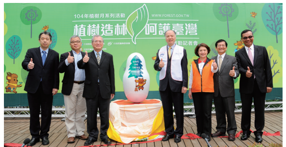
▲林務局局長李桃生及103年認養國有林地之民間團體共同揭開植樹月序幕。（林務局提供）

農委會104年2月25日舉辦104年「植樹造林 呵護臺灣」植樹月啟動記者會，正式宣告植樹月開鑼。會中邀請陽光校園合唱團合唱植樹月主題曲「愛心樹 遍人間」，更邀請到103年認養國有林地之民間團體共襄盛舉，為植樹月活動拉開熱鬧序幕！本次植樹月主題曲「愛心樹 遍人間」，歌詞傳唱「一棵一棵愛心樹 我願植樹到天邊 願這綠蔭遍人間 永遠妝點人世間」，正與植樹月主軸精神「植樹造林 呵護臺灣」相謀合，深深感動人心。林務局藉由植樹月系列活動，邀請全民一齊植樹造林作環保，更推動民間團體認養造林和社區植樹，期望共同攜手實踐「愛林護地，從生活做起」。（林務局 劉皓芸）