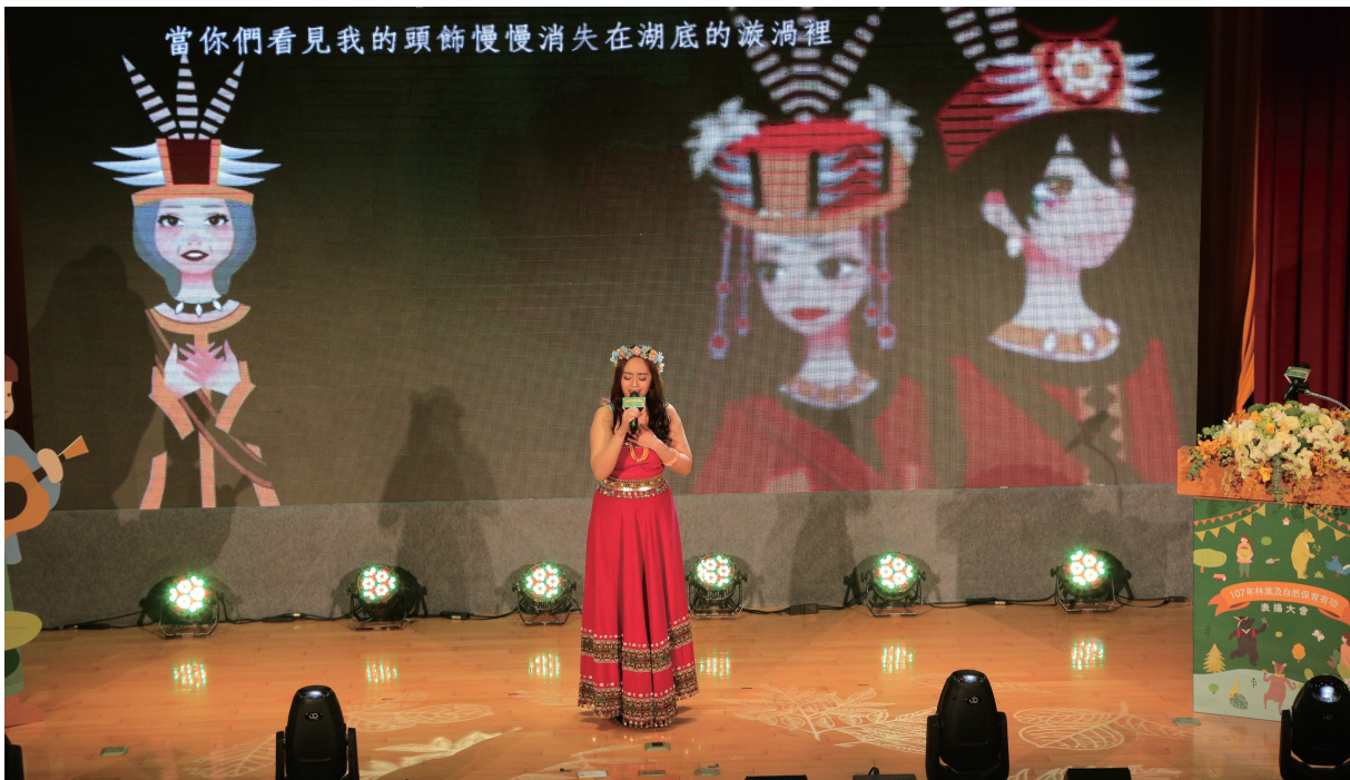
舞思愛·羔露於大會中演唱鬼湖之戀。