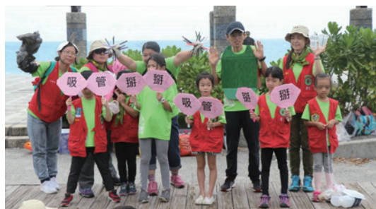
以實際行動響應今年「愛海無句吸管掰掰」淨灘主題。