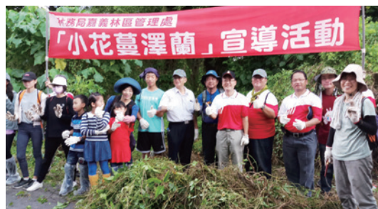
蔓蔓來快快除！大家一起加入除蔓護蛙行列！