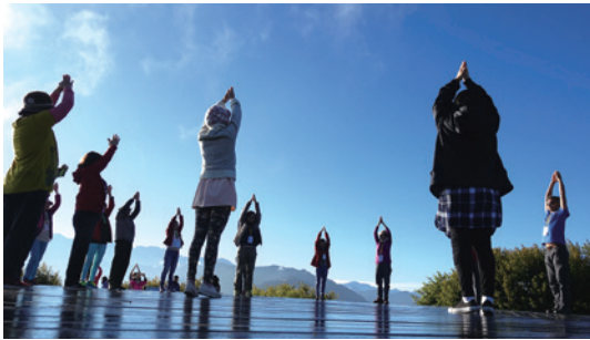
小笠原山觀景平台一肢體伸展。