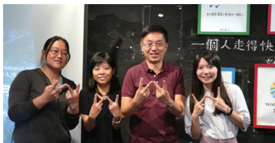
「林務局×女人迷—撕下標籤！我就是獨一無二的臺灣女孩」座談分享會。