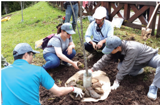
學員實作體驗—鋪設刈草蓆。