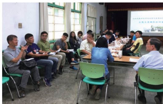
施工廠商分享兼顧生態是未來新趨勢，也將朝此目標施作。