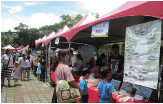
東勢林區管理處透過「夏日荷風稅月傳情」園遊會活動，加強推廣東勢林業文化園區、永續林業、生態保育的重要性。