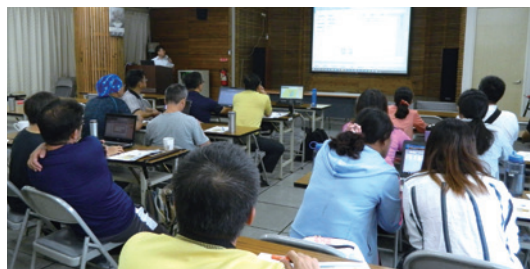
9月27日南投林區管理處在本處三樓大禮堂舉辦ICS森林火災監測系統教育訓練。