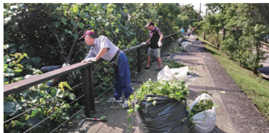
動手移除危害林木的小花蔓澤蘭，讓海岸保安林更健康生長，保障沿海海聚落的居住安全。