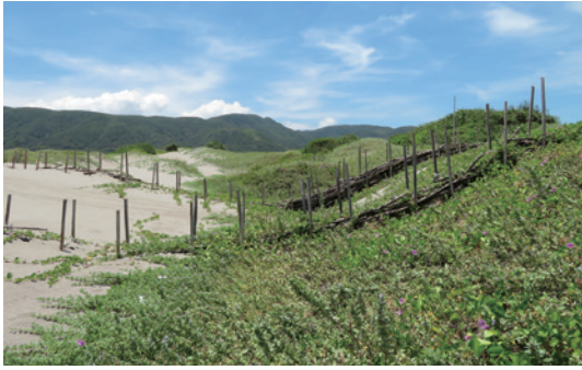
部分堆砂籬上已覆蓋馬鞍藤、蔓荊及貓鼠刺等植物。