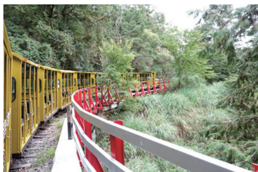
蹦蹦車列車迂迴穿梭林間。