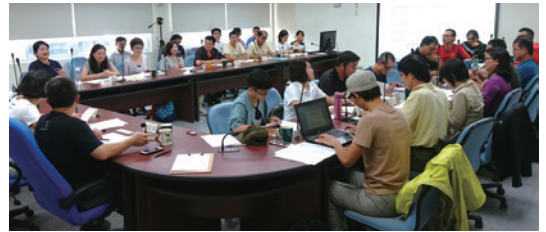
「嘉明湖步道及山屋屢現黑熊之後續處理研商會議」現場討論情形。