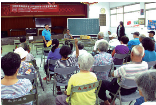
南投林區管理處丹大工作站於2018年8月15日假南投縣水里鄉民和村活動中心辦理小花蔓澤蘭植物體收購宣導說明會。