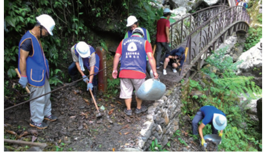
公私協力維護新寮瀑布步道 確保遊客行走安全。