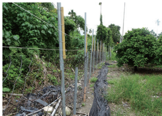
林務局鼓勵農民申請架設電圍網，防止獼猴進果園取食。