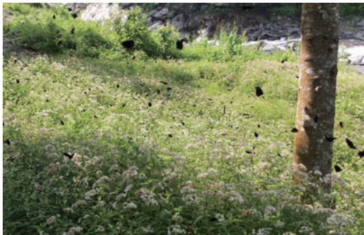
成千上萬的紫斑蝶在林間飛舞。