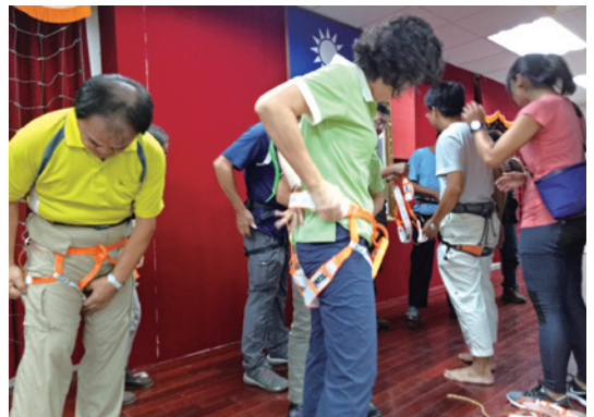
林政志工練習吊帶的穿著。