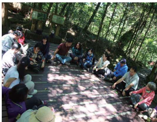
森林療癒課程。