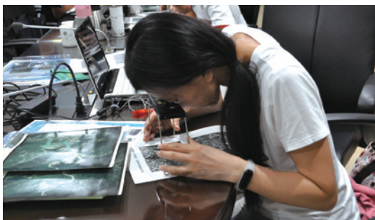
觀察不同土地覆蓋類型影像輔助現地勘查，可快速累積判釋能力。