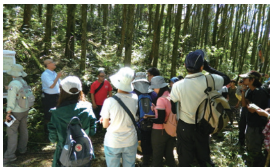
南投林區管理處在阿里山事業區104林班辦理「造林地中後期撫育作業現場觀摩及實務操作訓練」。