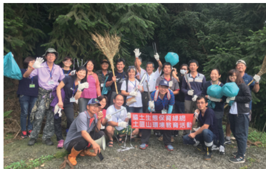
一起動手淨山愛護保安林，你我都可以做到！