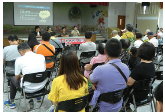
南投林區管理處於9月13日假雲林縣林內鄉辦理「雲林縣林內鄉臺灣獼猴危害作物防制工作坊」。