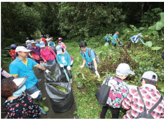
大家齊心合力移除小花蔓澤蘭。(攝影/屏東林區管理處卓惠崇)