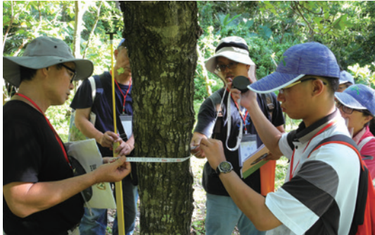
森林環教教案「森林解密行動」經由測量樹高、胸高直徑，瞭解森林具有儲存碳的能力。