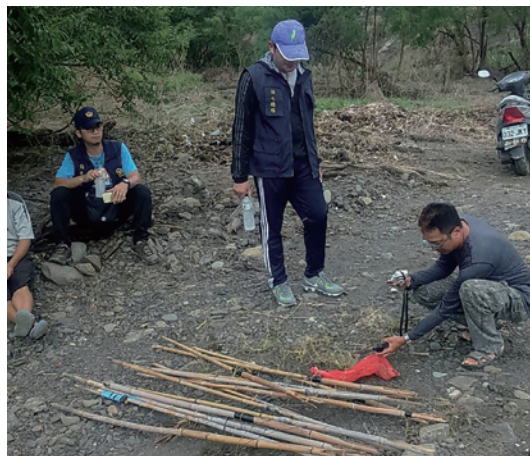
查獲鳥仔踏13支。