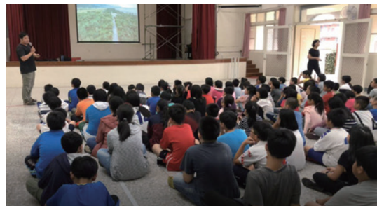
將保安林的樣貌以空拍照的視角介紹給學童認識。