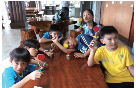
參與種子手作月兔之學員合照。