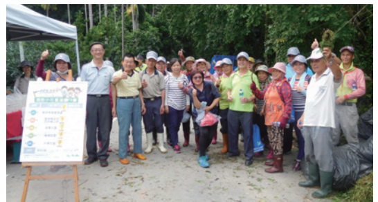
南投林區管理處於8月31日假雲林縣古坑鄉大埔社區松柏溪鐵馬道舉行「蔓蔓來，快快除～防治外來入侵種—雲林最賣力！」小花蔓澤蘭防除宣導活動。