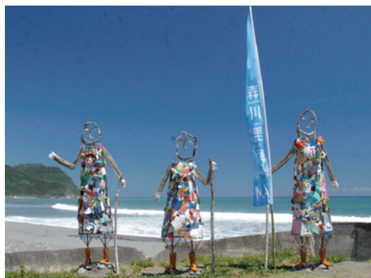
「KITA」印尼藝術家Arya Pandjalu作品。