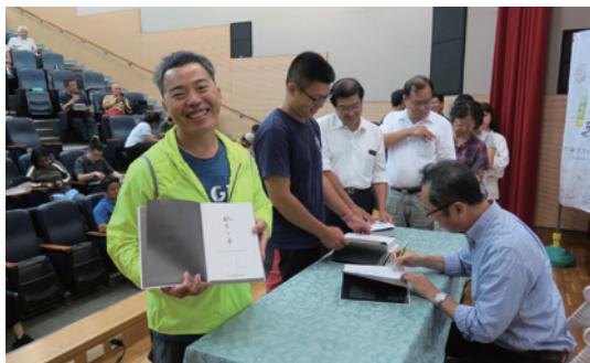
《霧林之歌：宜蘭古道自然發現史》新書發表會吸引許多對於臺灣山岳故事著迷者前來參加。