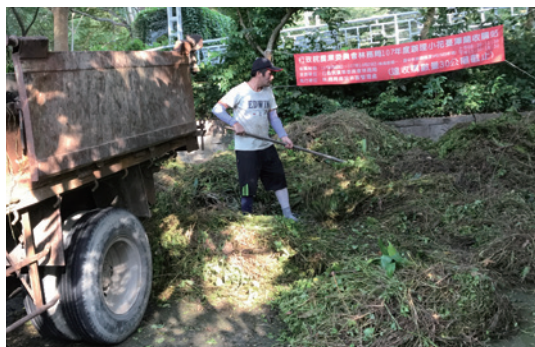
南投林區管理處於9月17日在該處竹山工作站田中分站收購小花蔓澤蘭的情形。(攝影/南投林區管理處 王之珩)