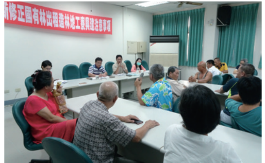
六龜工作站邀請林農參加工寮新規定說明會。