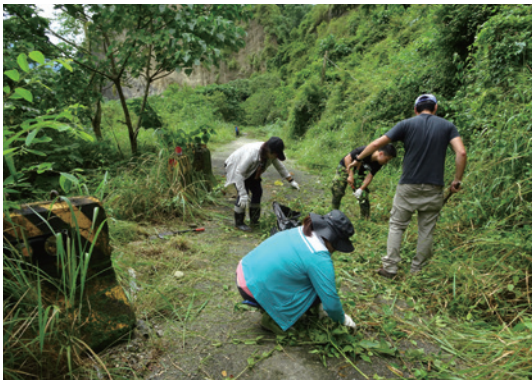
屏東林區管理處六龜工作站在十八羅漢山合力移除小花蔓澤蘭和美洲含羞草。