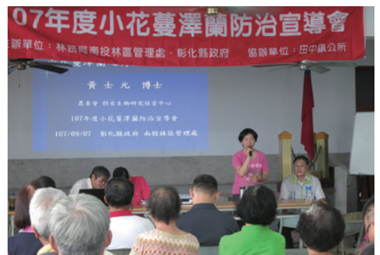
南投林區管理處和彰化縣政府於7日假彰化縣田中鎮龍潭社區活動中心辦理小花蔓澤蘭防治宣導會。