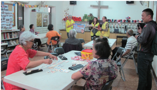
東勢林區管理處結合大安部落在地教會—基督教長老教會，共同辦理森林保護宣導活動。