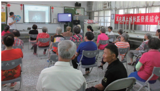
2018年9月21日南投林區管理處臺中工作站在南投縣草屯鎮土城社區活動中心與社區民眾分享九九峰自然保留區保育成果。