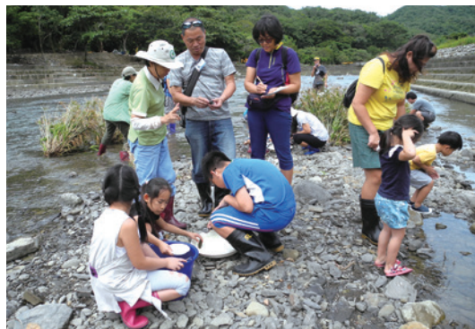
學員們認真地觀察水生昆蟲。