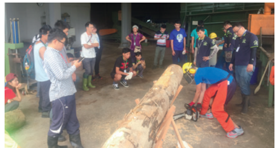
林業工作鋸木體驗。