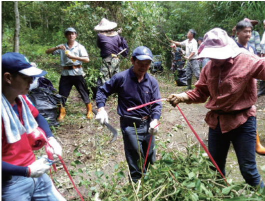
民眾一把扛起拔除的小花蔓澤蘭。