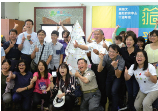
奧萬大自然教育中心十周年許多夥伴都回來參加活動。