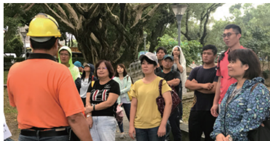
大溪中正公園共同辦理健檢護樹資源再利用活動。