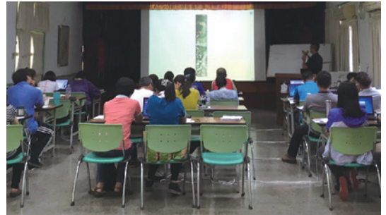
「航遙測圖資供應平台應用系統推廣暨教育訓練」辦理情形。