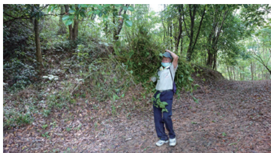
民眾一把扛起拔除的小花蔓澤蘭。