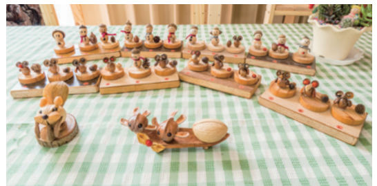
種子文創手作商品。