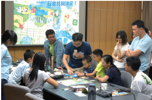
花蓮林區管理處同仁透過桌遊體驗海洋危機。