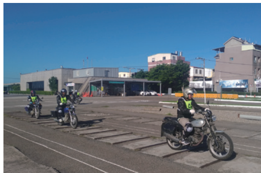
由同仁於不同路面進行操作，學習如何控制油門、煞車來保持平衡。