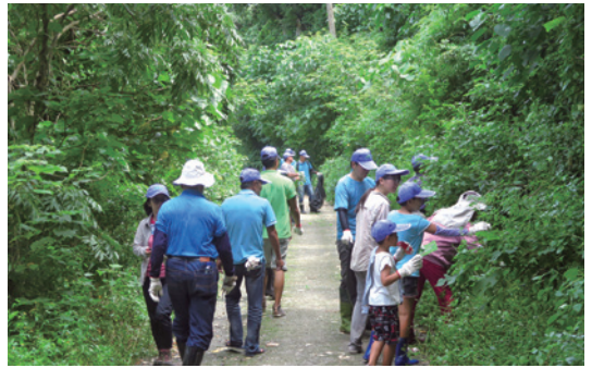
屏東林區管理處恆春工作站於里德社區舉辦小花蔓澤蘭防治宣導活動，現場近百位民眾共同拔除小花蔓澤蘭。