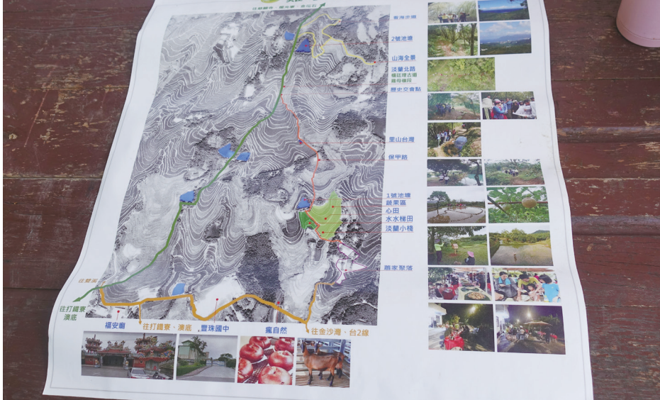
古道沿途居民自行製作古道地圖標示協助山友認識周遭環境與歷史地景。

也由於步道以天然素材施作，與周遭環境自然連結，定期需要人手巡護除草、鋸竹，整理風倒木，於是來自北臺灣28個民間團體、登山社群、大專院校、社區大學自發性組成的「淡蘭義工隊」，透過公私協力的模式，效法先民於每年土地公生日酬神吃福時，家家戶戶派出人丁維護道路的良好傳統，年復一年定期維護，使古道路況維持良好。透過28支「淡蘭義工隊」扮演橋梁的角色，讓愛山親山、關心古道文化資產的社會大眾能夠參與北北基宜淡蘭百年山徑的守護，與公部門一起維護綿密的淡蘭百年山徑。