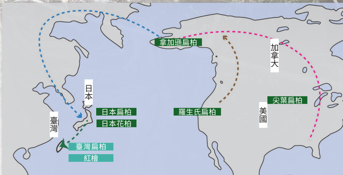
全球扁柏屬樹木遷移演化的可能路徑 (Wang et al., 2003; Little, 2006)

扁柏：分布在臺灣[臺灣扁柏與紅檜]；日本 [花柏 C. pisifera (Siebold & Zucc.) Endl.與日本扁柏 C. obtusa ]；北美洲東部 [尖葉扁柏 C. thyoides (L.) Britten, Stern & Poggenb.]、西部 [羅生氏扁柏 C. lawsoniana (A. Murray) Parl.] 等溼冷、多雨的氣候區 (Li et al., 2003；Wang et al., 2003, Liu et al., 2009；Liao et al., 2010)，此不連續地理分布是研究北半球植物地理學最重要的議題。