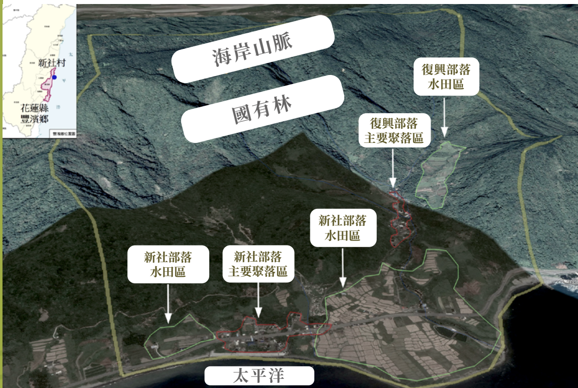
① 花蓮縣豐濱鄉新社村SEPLS位置及土地利用圖

礁生態，珊瑚礁生態則影響近岸居民的漁獲（李光中、范美玲，2016；圖①）。惟傳統上，相關主管機關本於各自主管業務，傾向以單一社區或部落為服務對象，造成各個主管機關各自就部門的主管業務協助不同的社區或部落。然而在地社區和部落的整體生產、生活和生態問題，必須在空間尺度和公私部門合作上，採取跨域的協同治理模式，方能有效解決（李光中，2016；Lee et al., 2019）。