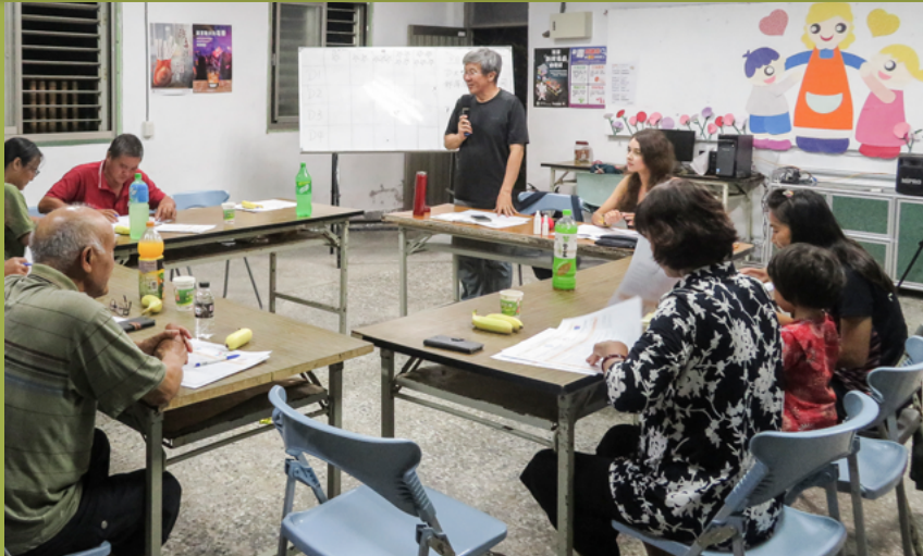
協力團隊向新社部落居民說明SEPLS韌性評估指標

運作機制等草案，經過2020年12月底平臺會議的討論和通過，新社生態農業倡議也將於2021年進入中程動計畫的「執行」階段（圖③）。