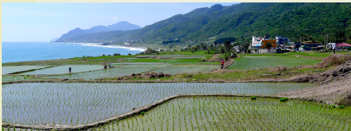
花蓮縣豐濱鄉新社村景色