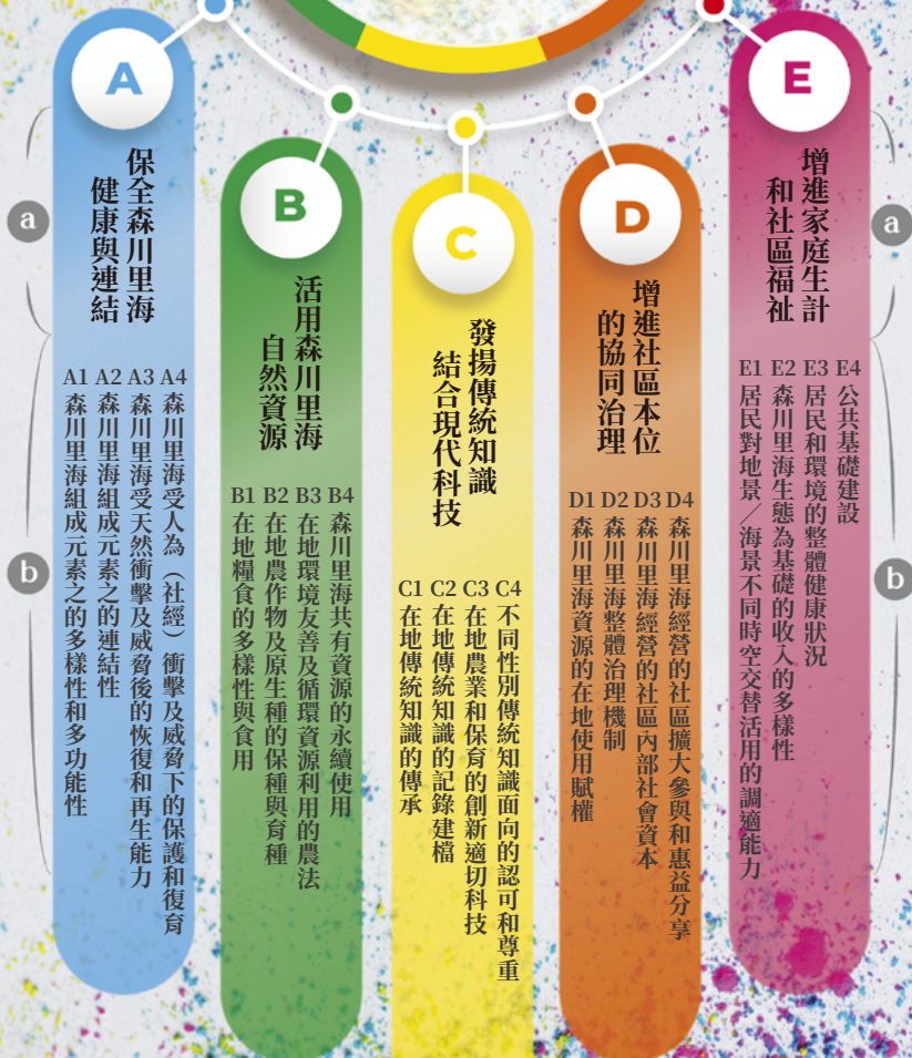
② ④里山倡議五大行動面向與 ①五大類20個在地化的韌性指標的對應圖