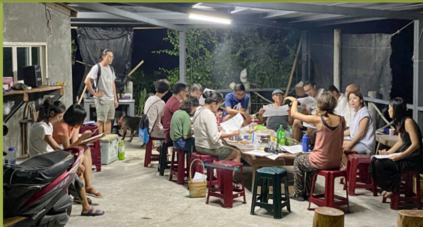
協力團隊向新社部落居民說明SEPLS韌性評估系列工作坊的總結果

助於更在地化的修改指標名稱的措詞並給予更貼切的解釋。此外，參與者的詳細建議有助於連結和修訂各個韌性指標與相關在地行動工作項目內容，這些訊息最後便成為新社生態農業中程行動計畫的工作項目清單。為了提供其他地區推廣應用的參考，我們在表1列出了本案例的在地化五大類20個SEPLS韌性指標及說明問題和例子。