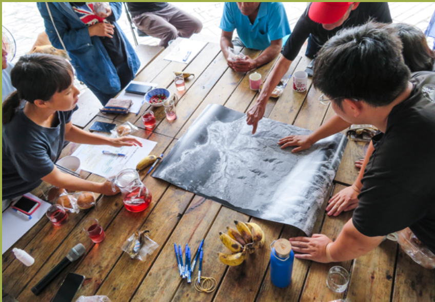
復興部落居民於SEPLS韌性評估工作坊中透過航照地圖討論過去地景

綜合上述，我們認為未來更多的本地化韌性指標及其評估工作坊的應用經驗，不僅有助於加深吾人對臺灣不同SEPLS案例的了解和經營，SEPLS韌性指標系統也可以作為一種共同語言的對話架構，提供臺灣各地不同案例之間的互相參照和學習的機會，如此將逐步建構出適用於全國範圍的SEPLS韌性指標系統及其操作指引，其成果將非常值得向我們的國際合作夥伴分享。📍