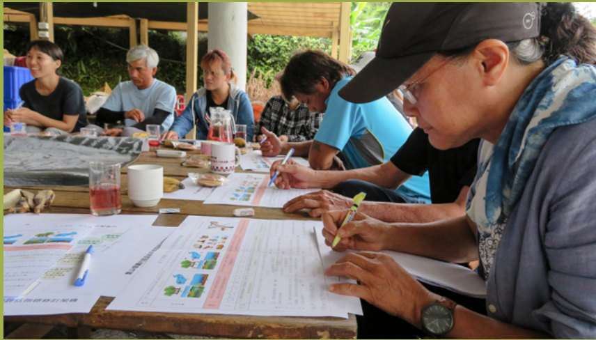
復興部落居民於SEPLS韌性評估工作坊中填寫評估表

繼而歸納兩部落意見形成若干具優先順位的主題性工作類別和相關工作清單，據以建構新的中程行動計畫。過程中也將嘗試促成部落與部落、部落與相關主管機關之間的對話，希望「由下而上」於2020年完成中程計畫的新版本，這項提議受到跨域平臺所有夥伴肯定和支持。