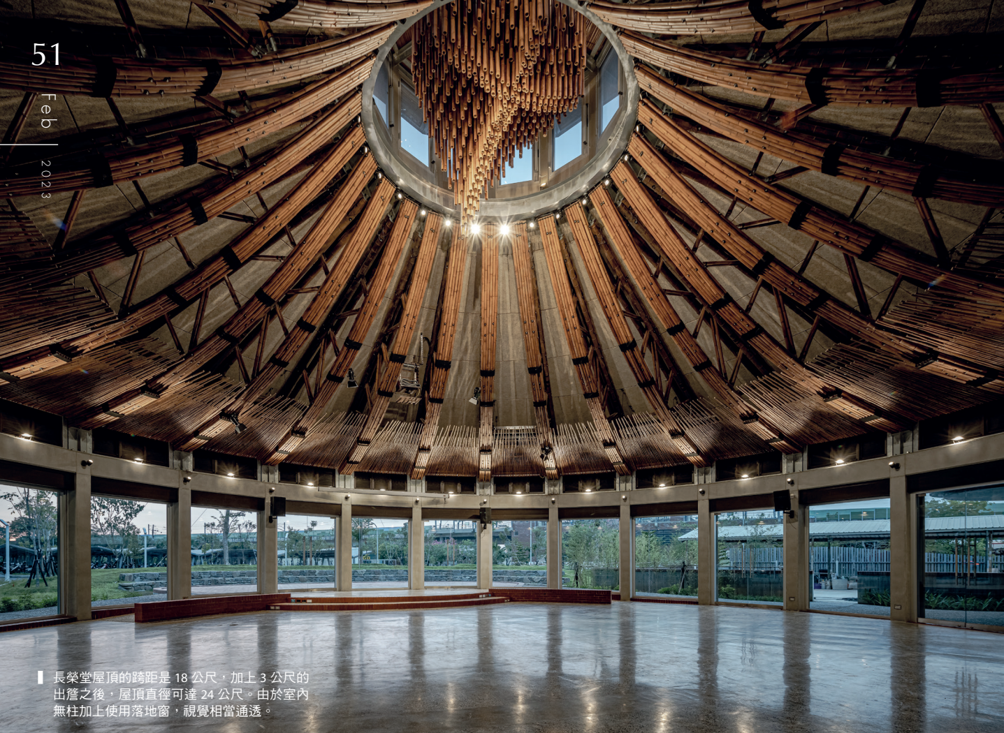
長榮堂屋頂的跨距是 18 公尺，加上 3 公尺的出簷之後，屋頂直徑可達 24 公尺。由於室內無柱加上使用落地窗，視覺相當通透。

長榮堂的空間與桁架之所以為圓形，更具有歷史脈絡與地域意義，原來長榮大學校地從前屬於臺灣糖業公司，一、兩百年來此區最重要的經濟活動曾是製糖；如今此堂圓錐的造型與桁架，呼應過往糖廊意象與材質，但是以當代建築手法為之。環繞屋頂中心點的是，24 組半月形竹桁架，每一組桁架的上弦竹桿為直線，採用較粗壯、斷面强度高一些的孟宗竹；下弦竹桿則為曲線，採用纖細、較易烤彎的桂竹。