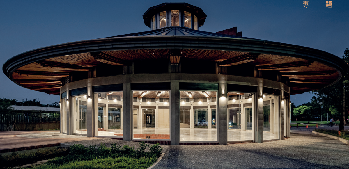
■ 以竹作為主結構的建築，曾普遍被認為是不可能的任務，如今長榮堂做出了最佳示範。