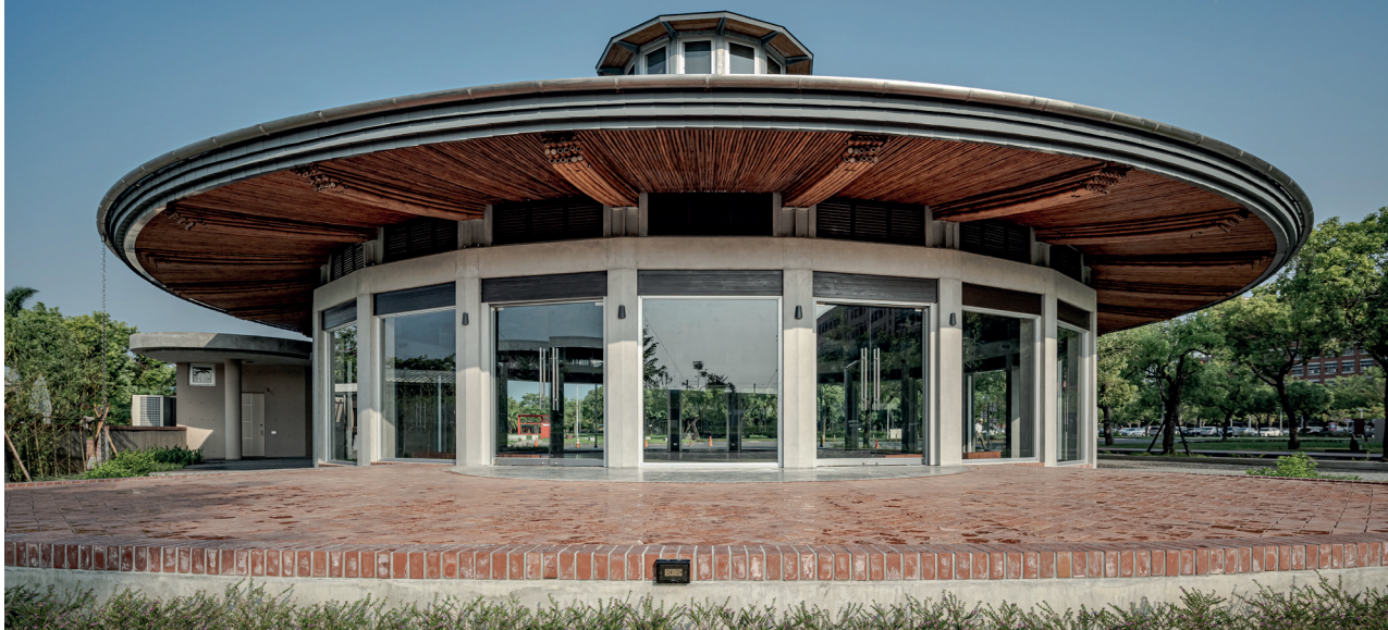
長榮堂由傳統竹材與當代建築融匯而成，是長榮大學入口的第一棟建築。