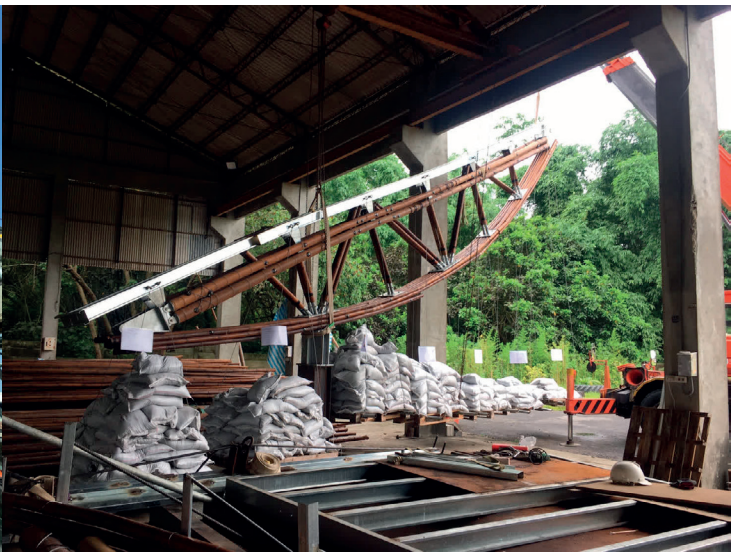
■ 竹構在我國雖尚未有建築法規、技術規範可參考，但經過建築人的大膽挑戰與耐心實驗，確認一組竹桁架可承重5公噸，使後續能順利施工。