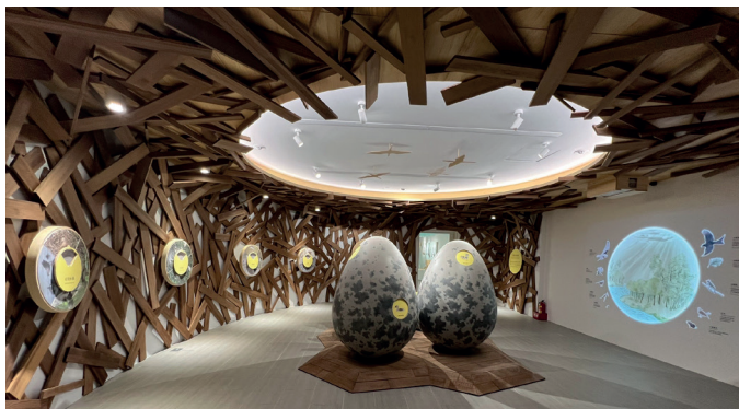
常設展「看見自然的律動」展現了鰲鼓濕地的生態之美與保育成果