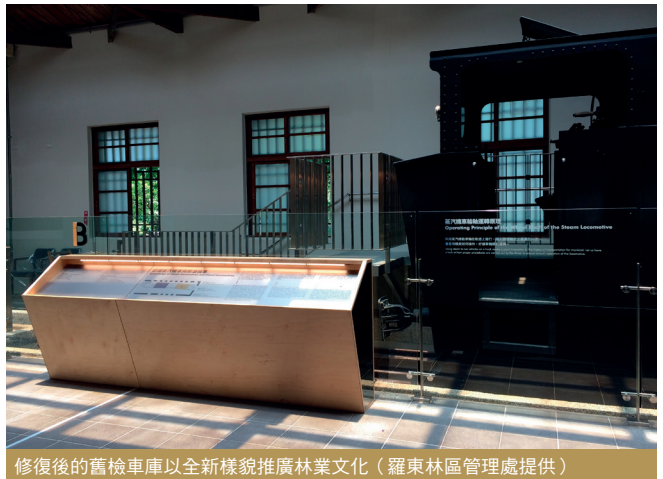
修復後的舊檢車庫以全新樣貌推廣林業文化