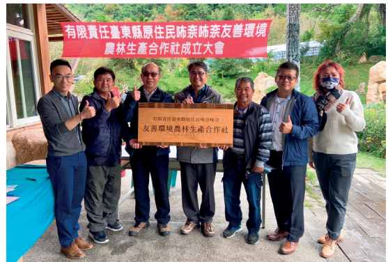
合作社的成立有利於提升部落經濟