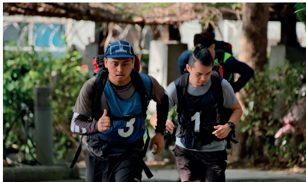
森林護管員術科測驗—負重20公斤跑走1,500公尺

林務局各林區管理處舉辦「112年森林護管員甄試」，招募體能條件良好及具有林業專業知能之人才。本次預計招募24人（含原住民保障名額），符合資格之報名人數計193人，到考人數為164人，總錄取率為14.63%，其中原住民錄取5人，占總錄取人數20.83%，女性錄取人數為6人，占25%。未來新進人員將與資深護管員並肩從事第一線森林巡護工作，執行森林資源經營管理及查緝盜伐濫墾等國土保育工作，共同維護臺灣的森林生態與自然資源。 —— 林務局 黃文璇