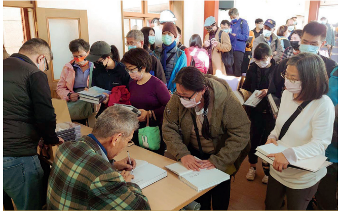
《原風景，日治太平山》新書發表會見證新書的魅力