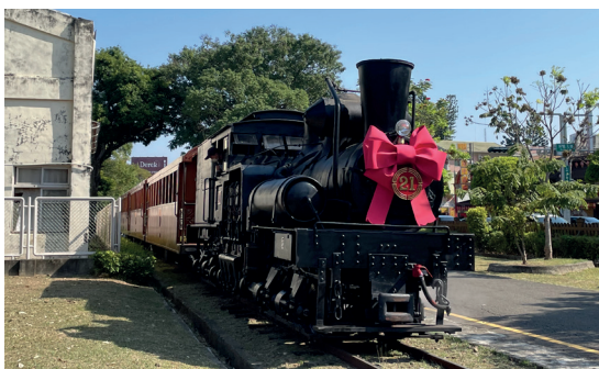
「林鐵通車 110 週年慶」Shay21 號蒸機復駛風華再現