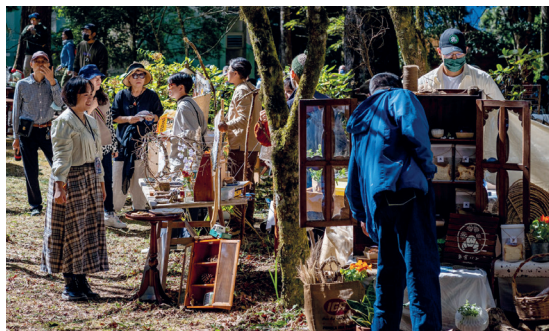
可同時享受芬多精與美食的山林野餐市集