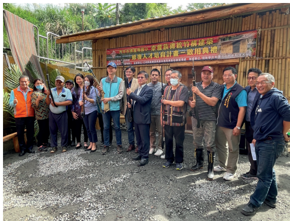
泰雅傳統屋具冬暖夏涼之功效