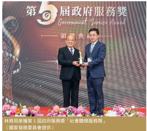
林務局榮獲第5屆政府服務獎「社會關懷服務類」