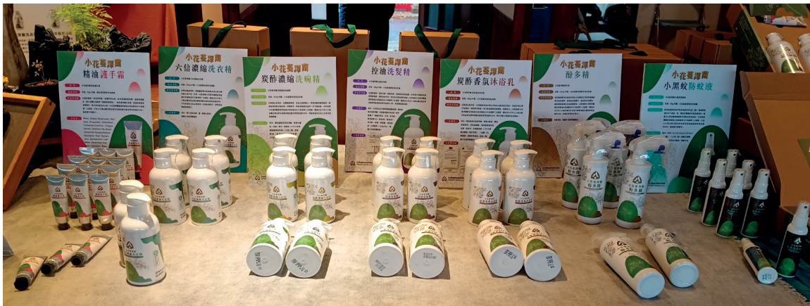
「浪蔓有禮—小花蔓澤蘭」七項產品，讓外來入侵種植物找到一席之地。