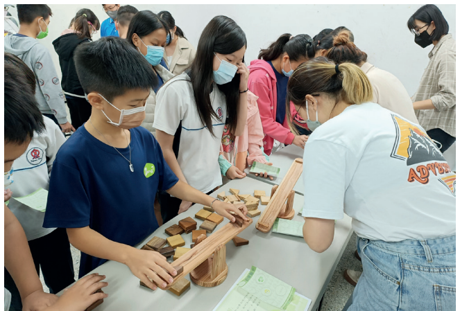
透過闖關及 DIY 活動讓學童認識國產材