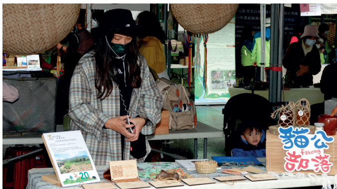
成果展活動攤位從各種角度展現地方產業的永續發展成果