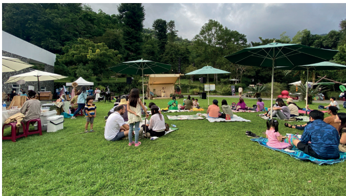
「漫遊知森」森林派對活動吸引了許多民眾走入森林