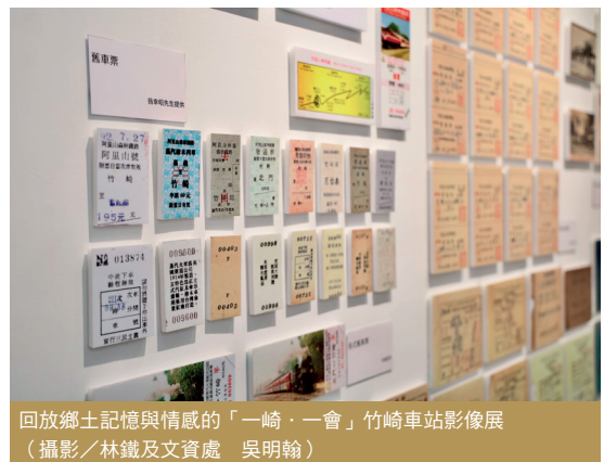
回放鄉土記憶與情感的「一崎·一會」竹崎車站影像展