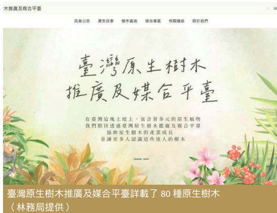
臺灣原生樹木推廣及媒合平臺詳載了80種原生樹木