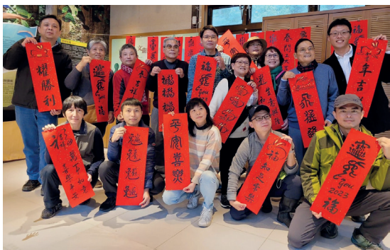
滿月圓國家森林遊樂區慶賀新年、與民同樂，舉辦揮毫贈春聯活動。