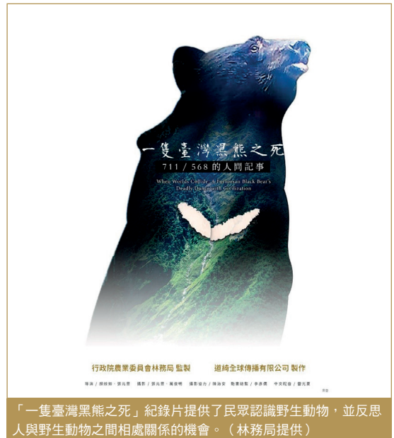
「一隻臺灣黑熊之死」紀錄片提供了民眾認識野生動物，並反思人與野生動物之間相處關係的機會。