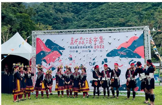
森日音樂會—排灣族原民饗宴，讓部落原音迴盪在森林間。