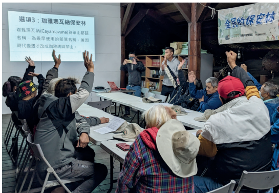
嘉義處與茶山部落共同討論保安林名稱