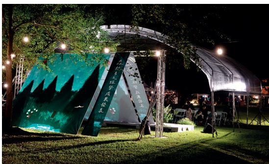
冬夜的草地市集充滿濃濃的聖誕節氣氛