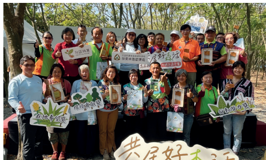
社區林業 16 個獲獎社區代表大合照