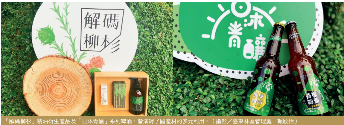
「解碼柳杉」精油衍生產品及「日沐青釀」系列啤酒，皆演繹了國產材的多元利用。