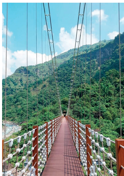
經嘉義分署與山美、里佳部落訪談討論，1915 號保安林依部落傳統領域採雙重命名。