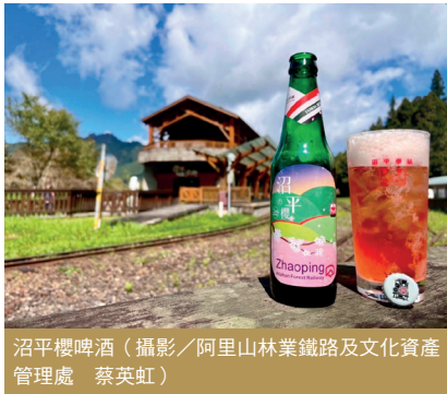
沼平櫻啤酒