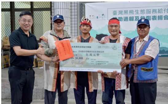
「臺東縣海端鄉廣原社區發展協會」參與臺灣黑熊生態給付計畫，並在棲地監測時拍攝到臺灣黑熊，林業保育署除予以表揚，亦頒發獎勵金 5 萬元致謝。