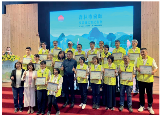
林業保育署長林華慶與認證森林療癒師合影