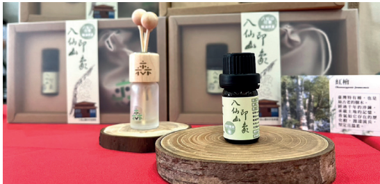
「八仙山印象」複方精油的原料為八仙山事業區的紅檜疏伐木