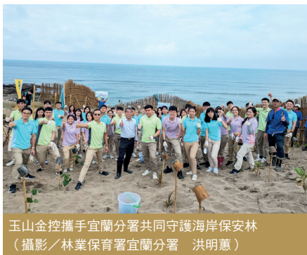
玉山金控攜手宜蘭分署共同守護海岸保安林