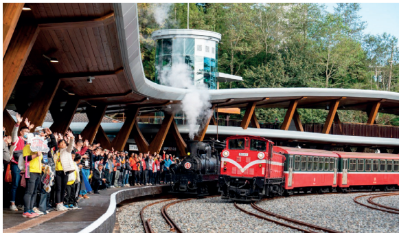
林鐵及文資處於阿里山國家森林遊樂區祝山車站辦理《再現祝山—迎曉朝聖》啟用典禮

為提升營運品質，歷經 3 年改建，克服地勢、天候與疫情種種困境，全臺海拔最高的祝山車站（海拔 2,451 公尺）終於重新啟用，並恢復觀日列車停靠。改建以光明的起點為概念，將雲海意象融入屋頂設計，打造兼含文化景觀、生態永續及友善服務概念的車站，為國內第一座鑽石級綠建築高山車站、第一座採用智慧生態照明的車站、第一座具蓄水功能月臺的車站及第一座雙層單側岸壁式弦月造形月臺。—— 林業保育署 劉芸嘉