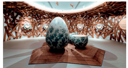
《看見自然的律動》榮獲美日設計雙獎肯定。圖為「鰲鼓的新生—孵育寶寶的水鳥」。