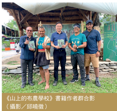
《山上的布農學校》書籍作者群合影