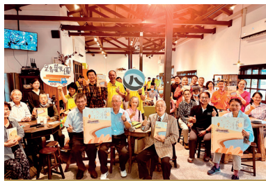
《路觀圖—太平山公路與林道》新書發表會