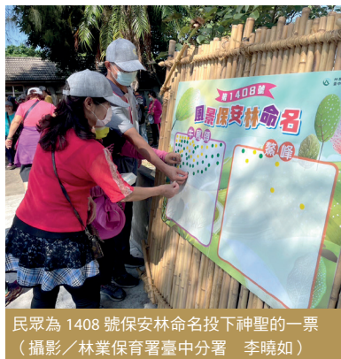
民眾為 1408 號保安林命名投下神聖的一票