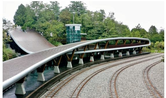
阿里山新地標—最美麗的弧形祝山車站