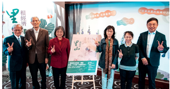
「社區林業 20 週年專書暨影片發表會」貴賓合照