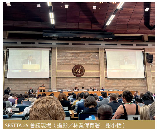
SBSTTA 25 會議現場

生物多樣性公約科學、技術和工藝諮詢附屬機構第 25 次會議（SBSTTA 25）於肯亞奈洛比舉行，會議聚焦於《昆明 - 蒙特婁全球生物多樣性框架》2050 年 4 項願景與 2030 年 23 項行動目標之科學政策討論，包含建立規劃、監測、報告、審查等機制，並修訂相關生物多樣性推動文件，以作為全球維護生物多樣性之共同指引，亦將成為我國研擬生物多樣性保育策略計畫的重要參考。 —— 林業保育署 謝小恬