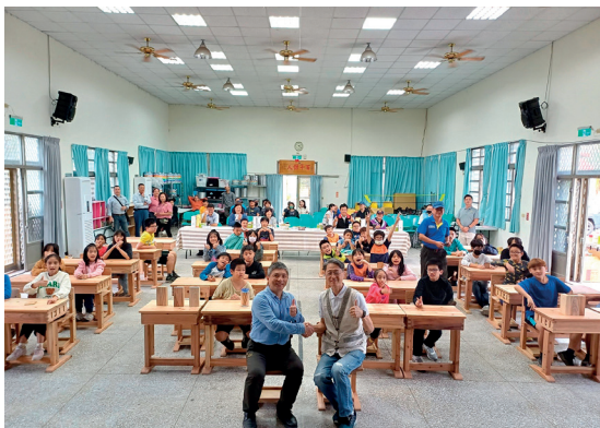
木育課程暨國產柳杉課桌椅致贈儀式