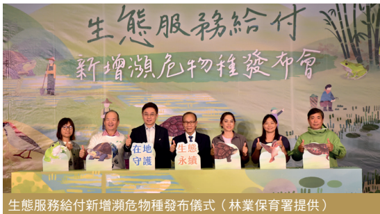
生態服務給付新增瀕危物種發布儀式