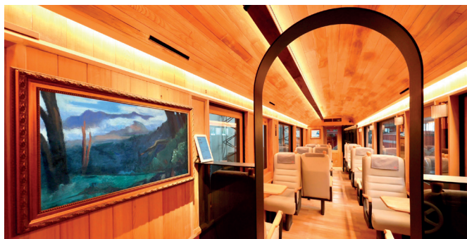
福森號車廂內的數位藝術畫作呈現林鐵及文資處蘊含的文化脈絡