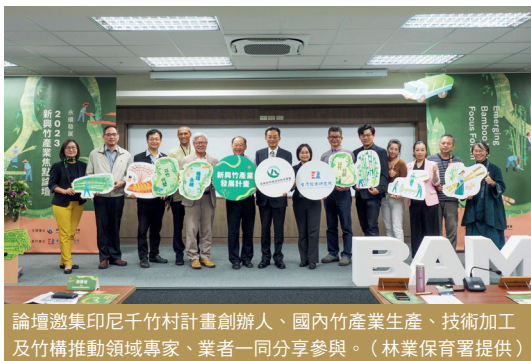
論壇邀集印尼千竹村計畫創辦人、國內竹產業生產、技術加工及竹構推動領域專家、業者一同分享參與。