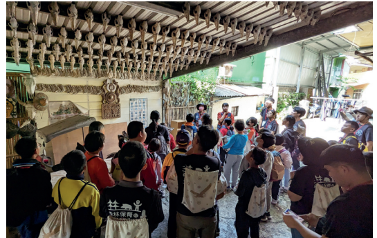
來義文樂部落走讀與解說—認識傳統狩獵文化與常見的獵獸資源（攝影／林業保育署屏東分署 林致綱）

林業保育署屏東分署與來義鄉公所、國立屏東科技大學、來義鄉傳統狩獵文化協會等單位合作，在來義文樂部落 Tjaududu 家（祖靈屋）辦理「童樂趣科學體驗營」，課程包含部落靈媒祈福、祖靈屋介紹、部落走讀、野生動物辨識與監測、部落常見植物與傳統打陀螺、竹弓等，共有 31 位國小三至六年級學童參加，讓部落文化傳承與資源永續概念向下扎根。—— 林業保育署屏東分署 林致綱