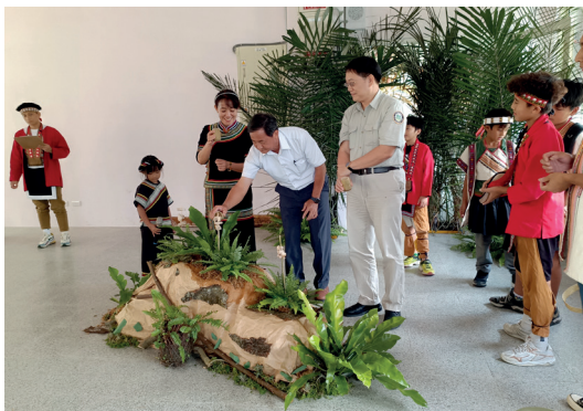
圖書室動土儀式由與會來賓透過「爇肉」橋段，象徵將山林知識經過爇烤產生煙，成為每位學童的能力。