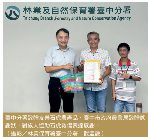
臺中分署致贈友善石虎農產品、臺中市政府農業局致贈感謝狀，對族人協助石虎救傷表達感謝。