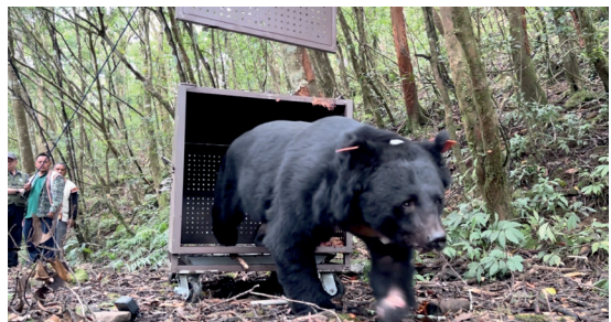
高齡的臺灣黑熊 Hundiv (闊帝夫) 順利野放重返山林