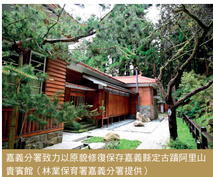
嘉義分署致力以原貌修復保存嘉義縣定古蹟阿里山貴賓館