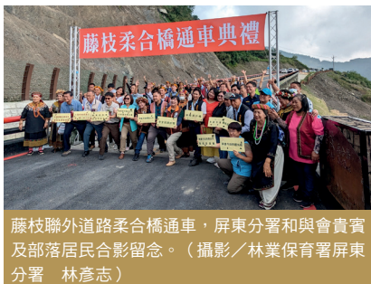
藤枝聯外道路柔合橋通車，屏東分署和與會貴賓及部落居民合影留念。