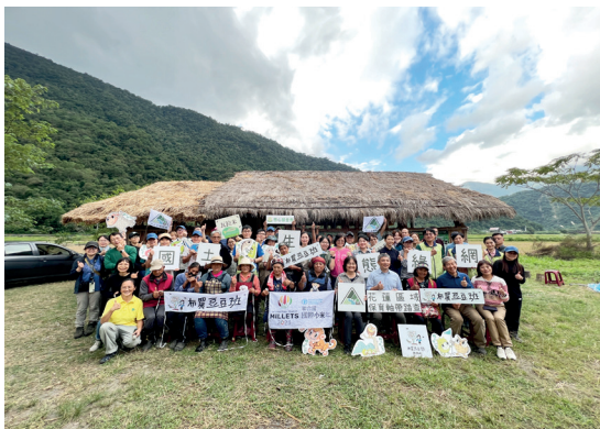
林業保育署長期與南安部落合作，並結合原住民傳統生態智慧與里山倡議理念，培力部落發展里山生態農業。