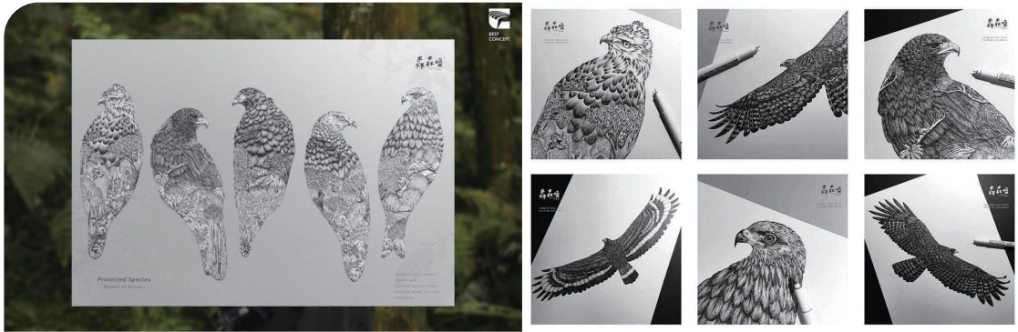
■ 金點概念設計獎「年度最佳設計獎」得獎系列作品