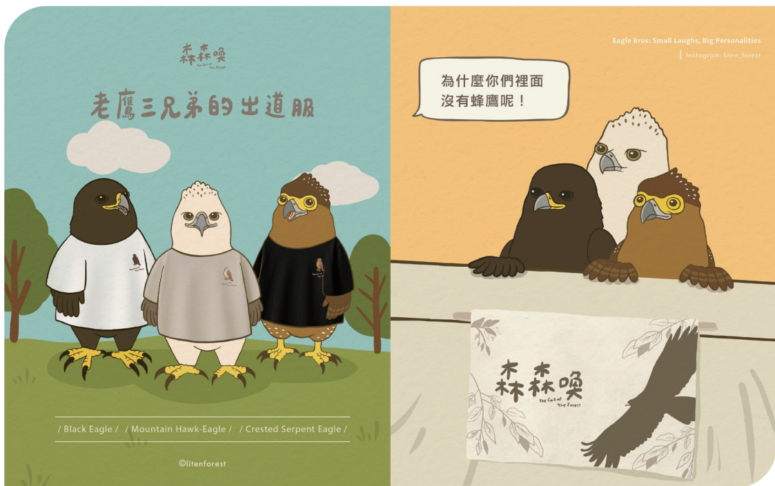
■ 老鷹三兄弟系列以輕鬆、幽默的風格塑造角色。

甚至與人產生情感連結的存在。牠們是藝術創作的延伸，更是一種能引起共鳴的媒介，從不同角度切入自然議題，在輕鬆中拉近與受眾的距離，慢慢走進山林的故事裡。