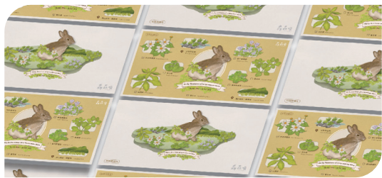
■ 林業及自然保育署臺灣野兔系列插畫設計

為了讓保育理念深入人心，森森喚開發了一系列以猛禽為主題的周邊商品，如猛禽系列服飾、帽子、包包、隨身鏡、明