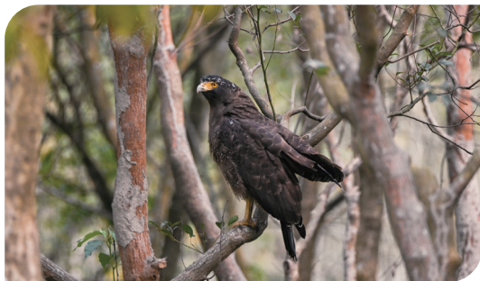
■ 停棲於樹梢上的大冠鷲

「森森喚」的起點，源於自小對猛禽的觀察與熱愛。小時候和爸爸一起爬山時，我總會不自覺地抬頭仰望，尋找天空中滑翔而過的身影。翱翔於廣闊天際的猛禽，有著難以言喻的魅力；那份自由、敏銳與沉靜，深深吸引著我。久而久之，我不只