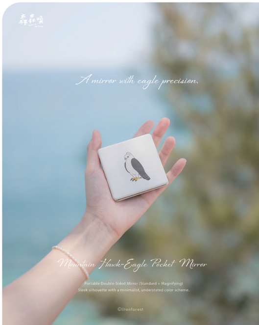
■ 大哥熊鷹的雙面小方鏡