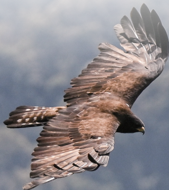
■ 翱翔於山谷中的林鵟

為了真實呈現猛禽，我透過大量閱讀研究相關文獻與資料，深入瞭解猛禽的分類、生態習性與棲地特性；同時也實際走入田野與山林，觀察牠們的行為模式、飛行動態與環境的互動，並以相機記錄下珍貴瞬間，作為後續藝術創作的重要參考依據。這些過程讓我對牠們的生活脈絡有更