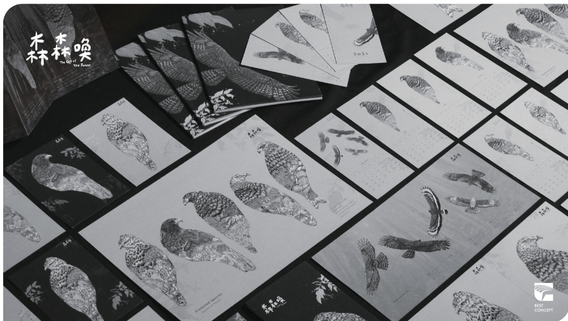
■ 日行性猛禽系列明信片選用環保紙材印刷

另一方面，森森喚也在產品設計中思考材質與環境的關係。例如選擇環保再生材質、降低包裝浪費，以及盡可能採用本地印製與生產，降低運輸造成的碳足跡。