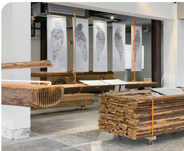
What's next 永續展覽：創作與柳杉木空間場域。

此外，森森喚也會在好事交易所舉行的「公民森林永續峰會」永續展覽中，將系列創作與建築設計師郭恩愷所搭建的柳杉木空間場域結合，讓觀者透過視覺與材料的交織，重新感受森林與人的關係；並為「熊鷹仿真羽毛暨部落傳統文化展」設計整體展覽主視覺與解說牌，透過視覺將部落文化的傳承與猛禽保育理念的共融所呈現出。同時也