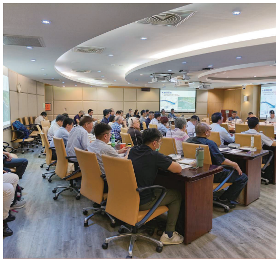
專案小組會議討論現況