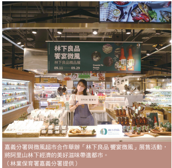
嘉義分署與微風超市合作舉辦「林下良品 饗宴微風」展售活動，將阿里山林下經濟的美好滋味帶進都市。