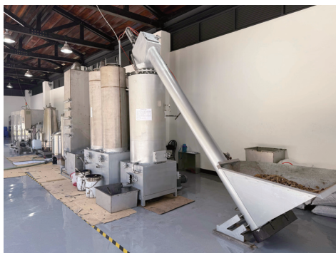
奮起湖林業循環利用場域引進全新氣化機組，提升國產材利用率。