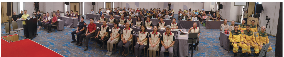
兵棋推演結合實兵操作，森林火災防救韌性全面升級。