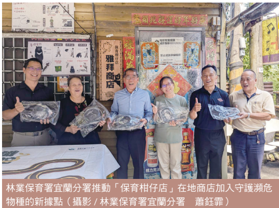
林業保育署宜蘭分署推動「保育柑仔店」在地商店加入守護瀕危物種的新據點