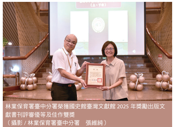
林業保育署臺中分署榮獲國史館臺灣文獻館 2025 年獎勵出版文獻書刊評審優等及佳作雙獎