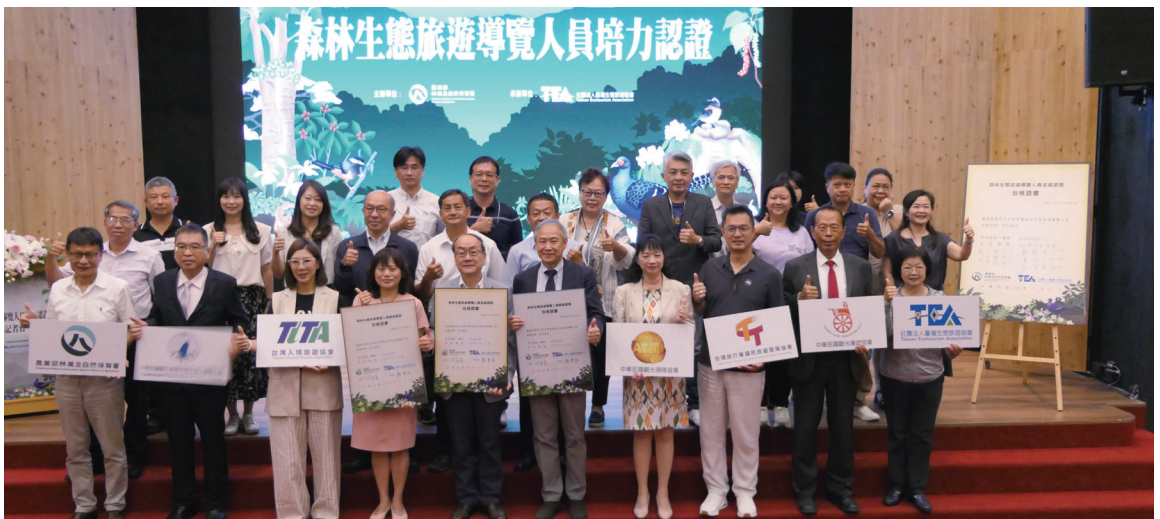
森林生態旅遊導覽人員培力認證啟動記者會與會貴賓大合照