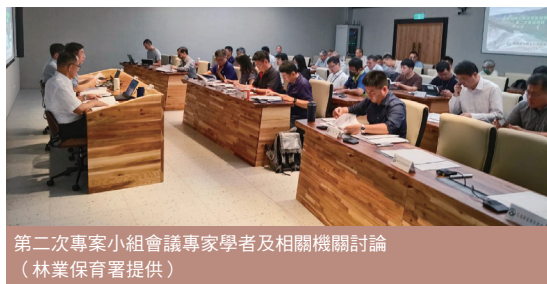
第二次專案小組會議專家學者及相關機關討論