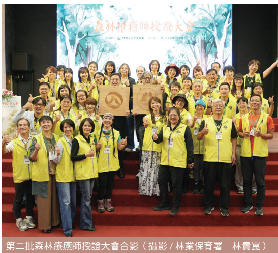
第二批森林療癒師授證大會合影