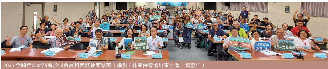
2025 全國登山研討會於同合農科商務會館舉辦