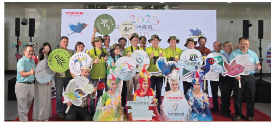
本次辦理博覽會與參展的單位於記者會後合影