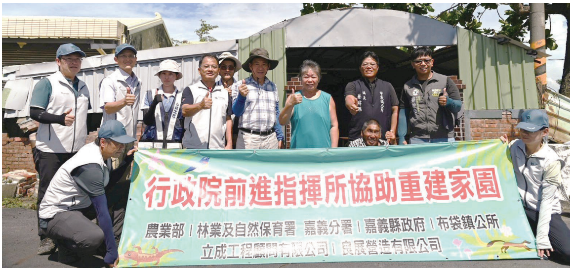
林業保育署嘉義分署媒合金質獎優良廠商協助嘉義縣布袋鎮風災受損居民簽約，加速災損房屋修復。