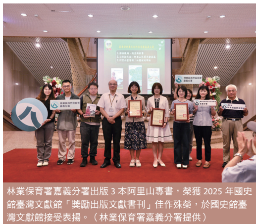
林業保育署嘉義分署出版3本阿里山專書，榮獲2025年國史館臺灣文獻館「獎勵出版文獻書刊」佳作殊榮，於國史館臺灣文獻館接受表揚。