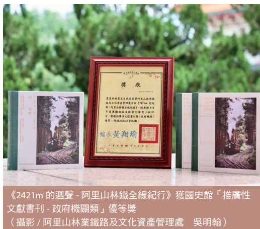
《2421m的迴聲 - 阿里山林鐵全線紀行》獲國史館「推廣性文獻書刊 - 政府機關類」優等獎