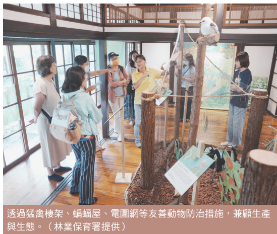
透過猛禽棲架、蝙蝠屋、電圍網等友善動物防治措施，兼顧生產與生態。