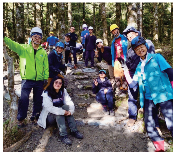
往年夥伴與手作步道成果合影