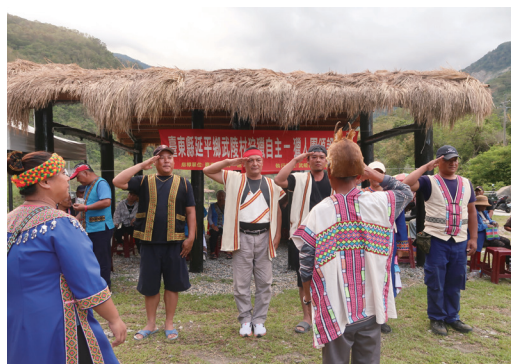
臺東縣延平鄉武陵村武陵社區發展協會隆重舉辦狩獵證頒證儀式，45 位布農族獵人於部落耆老見證下正式獲頒證書。