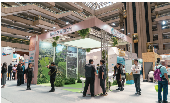
策展介紹 OECMs 在臺灣的實踐樣態 (林業保育署提供)