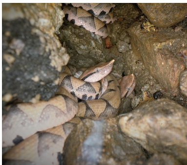
《守護：百步蛇野外護卵孵化記錄》記錄到向來獨居的百步蛇只有在幼蛇時會相互蟠曲在一起的珍貴畫面