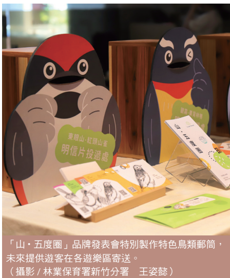
「山·五度圈」品牌發表會特別製作特色鳥類郵筒，未來提供遊客在各遊樂區寄送。