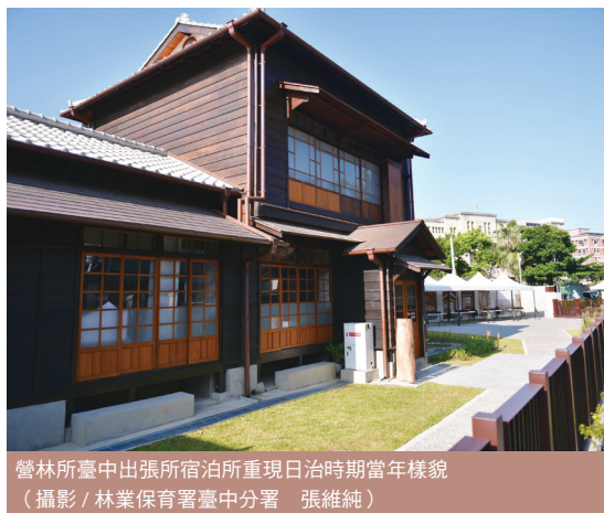
營林所臺中出張所宿泊所重現日治時期當年樣貌