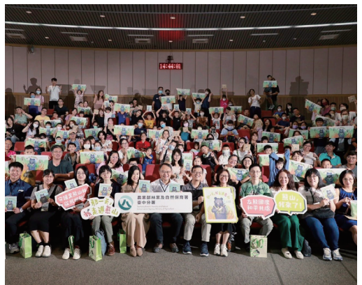
林業保育署臺中分署舉辦《那一天，我走進熊山》新書發表會，吸引上百位大小朋友熱情參與。