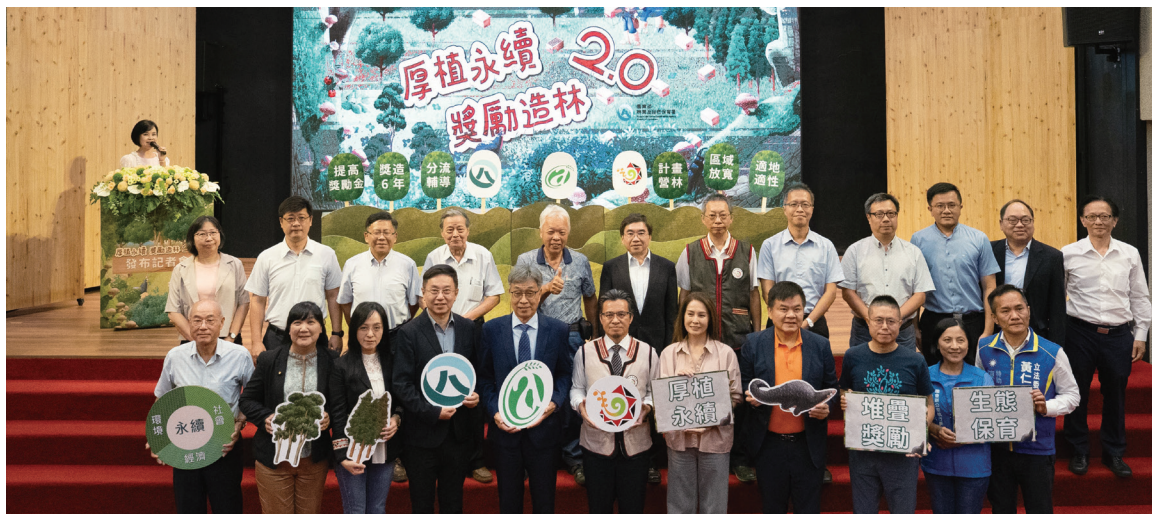
全面修正《獎勵輔導造林辦法》，完成六大修正重點，促成森林經營全面升級。