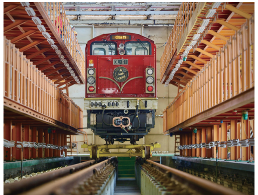
阿里山林鐵打造全新高階款列車「森里號」