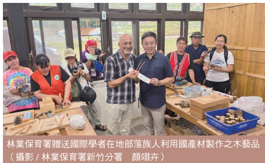
林業保育署贈送國際學者在部落族人利用國產材製作之木藝品