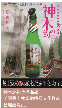
神木之約啤酒海報