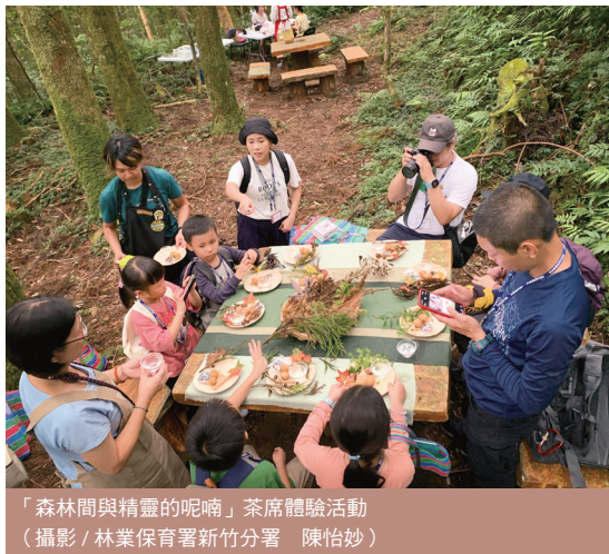
「森林間與精靈的呢喃」茶席體驗活動