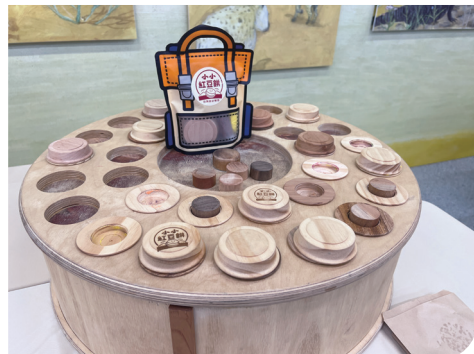
■ 使用優質國產材製成的林產品有助於木育推動