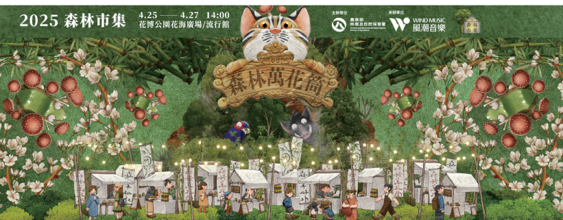
2025 森林市集以「森林萬花筒」為主題，民眾可透過萬花筒的視角，探索這座萬物相惜的森林樣貌。

期透過木育相關國際案例及政策推動分析、現階段臺灣木育資源盤點、相關領域專家學者研討與建議、階段性推動目標及策略擬定，進行內外部溝通與推動資源整合，凝聚內外部相關單位和木育推動能量，為臺灣木育推動的未來共同努力。