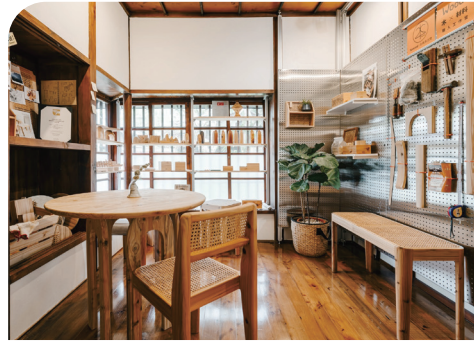
■ 國產材推廣展示館：木的N次方。