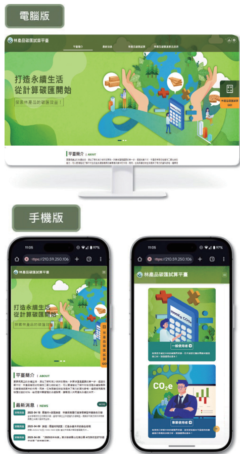
■ 林產品碳匯試算平臺（雙平臺）介面示意圖

現階段木材自給率尚不足 1%，目標與現實之間的落差顯示，單靠產業自身的發展仍難以達成長遠的永續發展目標願景。這也意味著，未來國產林產品的推廣必須結合更廣泛的社會力量，從基礎教育開始，培養民眾對木材應用與碳匯效益的認知，透過學校課程讓下一代理解木構產品、建築與減碳間的具體關聯，同時，企業與公部門亦需透過公共工程、綠色採購與建築規範，率先示範木材在減碳上的應用潛力，逐步改變社會對木造產品