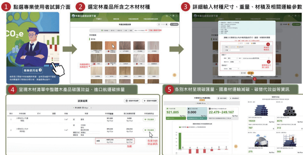
林產品碳匯試算平臺（碳匯計算功能及碳替代效益）試算結果示意圖

未來，透過標準化的碳匯計算方法、數位化的林產品試算平臺與政策工具連結、完善相關配套措施，並配合全民攜手的大力推廣，國產林產品有望在建築減碳、碳市場發展及企業 ESG 實踐中發揮更大作用。森林及林產品的碳匯功能既能減少溫室氣體