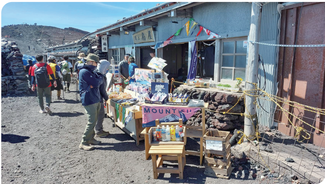
富士山頂紀念品商店

費 4,000 日圓、山屋 12,500 日圓、新宿至五合目客運來回 7,600 日圓，折合新臺幣約 5,000 元（不含裝備租借）。