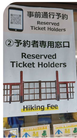
■ 事前線上繳完入山費者可以快速通關

因應入山管制政策，吉田線五合目登山口設有管制站、柵門及管理員，管理員收取入山費後，會提供一條可別在背包上的繳費證明（各年度顏色不同），登山路