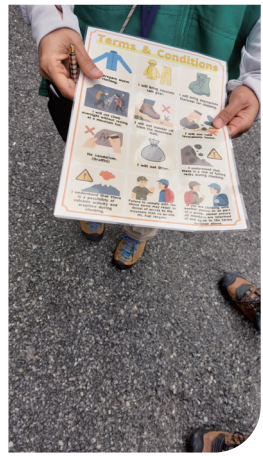
■ 專人執行入山宣導

線上不定期會有巡查員進行查核並提供登山協助，如發生緊急狀況或違規事項也會給予指導，以筆者實際經驗為例，此次登山時曾因手拉步道路緣引導繩而遭巡查員提醒該繩並非扶手繩，固定點不穩定，應避免拉扯以確保自身安全。