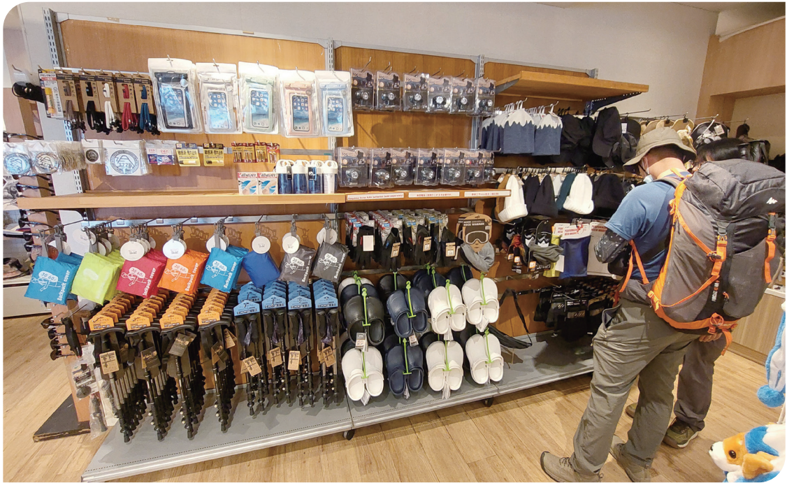
■ 吉田線五合目登山口的裝備店