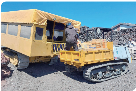
■ 正在富士山頂運補物資的履帶式搬運車