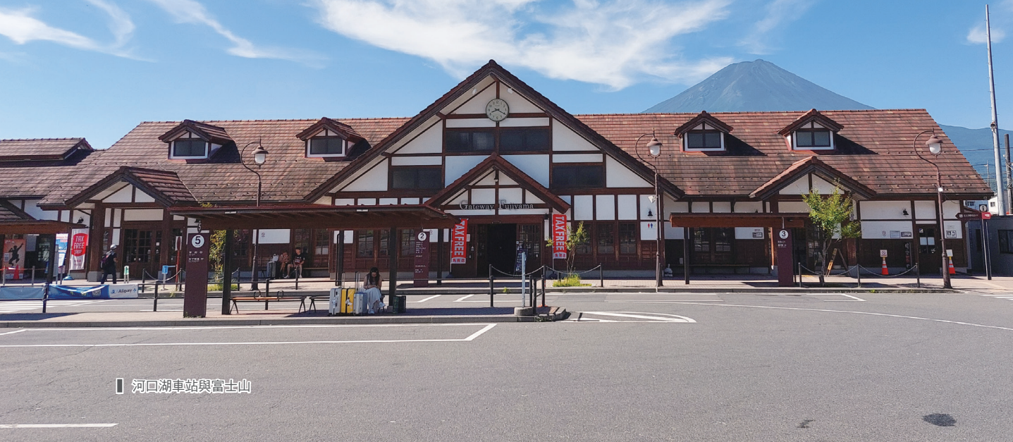
█ 河口湖車站與富士山

山，以最熱門的吉田線為例，須先前往山梨縣富士吉田市或河口湖地區，再轉乘巴士前往吉田線五合目登山口。