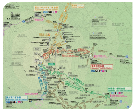
富士山路線圖

為利遊客事前準備，所有攀登相關資訊，如：公告事項、登山管制、路線、交通、山屋設施及天氣等，均可於富士登山官方網站查詢，並有外語版本；同時現場告示牌亦有外語說明，外國遊客也能輕鬆取得相關資訊。