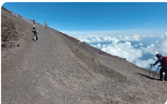
■ 吉田/須走線下山道路幅寬，可供搬運車通行。

更能避免臨時加價等不確定因素，降低旅遊風險與成本，也因此成為吸引外國遊客的重要優勢之一。