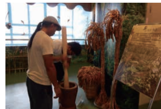
▲大武山生態教育館「聽～小米說故事特展」解說現況

103 年度到生態教育館遊客參訪達 1,603 場次、74,089 人次。執行成果包括以生物多樣性、棲地保護、動植物保育為主，規劃設計 100 場以上保育相關課程及學校戶外教學活動等。另除常設展外，各館發揮自我特色規劃特展活動，同時藉由宣導品、摺頁、部落格及 Facebook 等多元宣傳窗口，