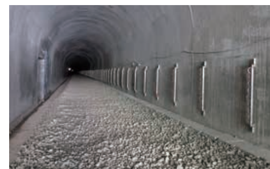
▲森林鐵路多林隧道復建工程

② 至奮起湖至神木段之復建工程於103年12月3日全部完工，正進行相關整備工作，後續俟完成並經交通部現勘檢查，確認安全無虞後，即完成全線復駛。