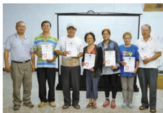
▲步道生態旅遊培力訓練，受訓學員獲頒結業證書

自90年行政院同意本局辦理「整建國家步道系統計畫」起，國有林地之步道成為深度體驗臺灣自然人文之良好途徑，藉由步道路線連結遊憩系統之整合，同時發展生態旅遊，逐步建立步道與鄰近社區部落間之夥伴關係，帶動山村聚落之發展，延展發揮步道之附加效益。