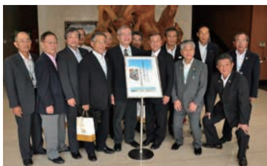
▲日本立山黑部自然環境保全國際觀光促進協議會來訪本局