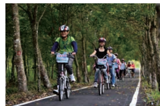
▲大農大富平地森林園區－林下騎乘自行車，神清氣爽

識社區的生態旅遊，感受社區魅力；11 月 22 日辦理「單車樂活尋糖趣」解說推廣活動，讓民眾騎乘於自行車道感受隨著季節更替的林相變化。本園區開園至 103 年底，遊客量逾 117.9 萬人次。