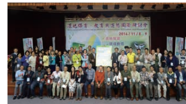
▲濕地保育、教育與遊憩國際研討會參與嘉賓合影

103 年於阿里山上成立第 9 座生態教育館，以舊有建物改建，利用陶版人物介紹阿里山人文歷史發展的軌跡，館內設有文物品、種子基因庫及動植物模型展示，並運用嶄新互動之多媒體解說設施、QR-code 及電動展版科技，建置無障礙服務設施之友善旅遊環境等特點，獲得內政部頒發友善遊憩場所及行政院農委會 103 年「優良農建工程」優等獎。