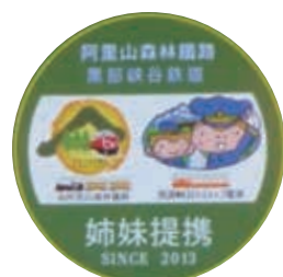
▲森林鐵路的姊妹鐵路LOGO置於黑部峽谷鐵道列車機車頭

③ 隨著雙方姊妹鐵路互相推動車票互惠活動的實施，除了於官方網站有專頁介紹活動資訊之外，我國森林鐵路相關宣傳海報與DM皆可見於日本姊妹鐵路的車站，亦於機車頭前設置雙方姊妹鐵路的友善意象標誌