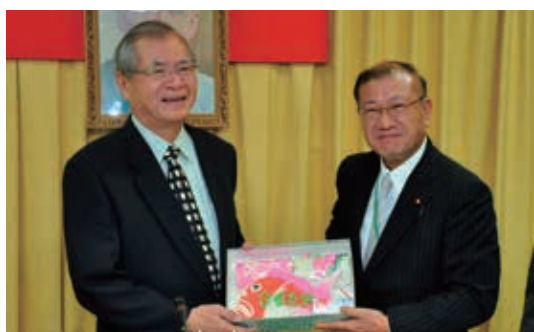
▲日本眾議院宮腰光寬議員（曾任農林水產省副大臣）來訪本局

並搭乘森林鐵路及參訪阿里山森林遊樂區。另，日本富山縣地區眾議院宮腰光寬議員（曾任日本農林水產省副大臣）率富山縣議員、滑川市議員等14名「立山黑部自然環境保全國際觀光促進協議會」訪問團，於103年8月19日造訪，並搭乘森林鐵路由北門前往奮起湖，以親身體驗森林鐵路之美；翌日（8月20日）亦來訪本局，由李桃生局長率員接待，雙方就阿里山與立山黑部地區之鐵路合作交流與申登世界遺產議題進行交流，以致力環境保護與登山鐵道文化的動態保存及永續使用，並增進兩國人民友誼。