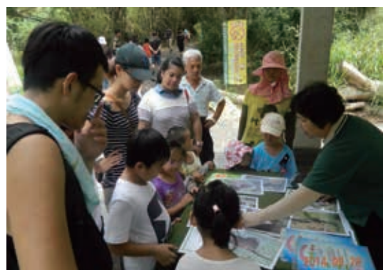
▶豐柏步道臺灣獼猴保育三原則宣導

本局為推動自然保育觀念及行動，發展生態教育館系統作為大眾認識臺灣自然環境及保護（留）區相關資訊的窗口，並落實在地保育工作的行動平台。經管保護（留）區鄰近地區規劃設置 9 處生態教育館，分別為紅樹林、拉拉山、火炎山、二水臺灣獼猴、大武山、瑞穗、南澳、員山等及 103 年新完成之阿里山生態教育館。生態教育館功能包括強化保護（留）區經營管理及保育業務之推動據點，提供自然保育相關主題特展、網路平台、導覽解說、影片欣賞及進入保護