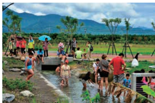
▲林後四林平地森林園區－打造親水環境，讓民眾體驗二峰圳運作模式