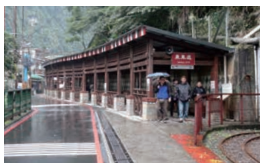
▲烏來台車瀑布站屋頂改善工程

F、針對舊有設施進行改善工程，包括烏來台車林業生活館天花板、塗護木漆修繕，台車瀑布站之屋頂、天溝、天花板、塗護木漆改善，台車車庫屋頂琉璃鋼瓦、塗護木漆、入口門柵油漆改善。