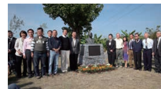
▲林後四林平地森林園區－二峰圳幕後功臣「鳥居信平」銅像揭幕

(3) 林後四林平地森林園區：共完成遊客服務中心、戶外森林舞台、6.1 公里主要道路、5.3 公里自行車道、8.7 公里人行步道、31 座涼亭、2 座停車場、2 座生態池、復刻二峰圳及親水景觀設施、四季與二十四節氣坪森林故事區、7 公頃活化農地示範區、節能減碳之炭化爐展示區。配合開園辦理學生志工、社區媽媽、親子彩繪工作假期 3 場次及生態旅遊活動 5 場次，提供遊憩解說活動 33 團次。園區於 103 年 12 月 7 日辦理鳥居信平銅像揭幕活動，邀請農委會主委、屏東縣長、鳥居信平後代、屏東縣政府姊妹縣日本靜岡縣參訪團、屏東科技大學團隊等人共同揭幕，讓民眾瞭解行政院文建會 2008 年指定之文化資產並被評為重要的文化景觀－二峰圳運作原理。本園區開園至 103 年底，遊客量已逾 7.2 萬人次。