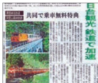
▲日本新聞媒體大幅報導車票互惠惠訊息（103年4月19日）

擇搭乘森林鐵路進行觀光旅遊之外，更藉由車票互惠活動延伸森林鐵路的價值感，凝聚國人永續經營此一文化資產的共識。此外，藉由接軌他國的知名鐵路，提升森林鐵路的國際能見度，厚植後續申登世界文化遺產的潛實力。