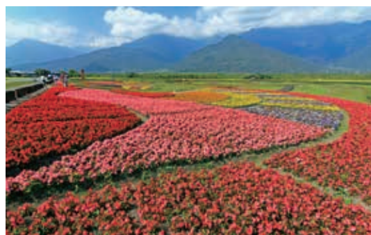
▲大農大富平地森林園區－繽紛花海賞心悅目