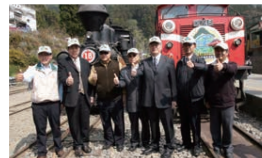
▲首航列車順利抵達奮起湖車站