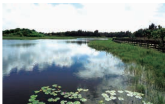
▲鰲鼓濕地森林園區－回歸自然的濕地景觀

本園區位於雲嘉南濱海風景區北端，面積約 1,470 公頃，定位為國際級濕地公園，區內有濕地、沙洲、魚塢、造林地、農業區等複合地理景觀，其中東石農場之鰲鼓濕地為國家重要濕地，其候鳥與水鳥眾多，農委會依據野生動物保育法第 8 條第 4 項規定，於 98 年 4 月 16 日公告為「嘉義縣鰲鼓野生動物重要棲息環境」（面積 664.48 公頃）。整體規劃勇奪有景觀界奧斯卡之稱的「美國景觀建築協會」ASLA 2011 年分析規劃領域專業組首獎。本園區除能發展環境教育及強化濕地保育工作，更可作為北回歸線上海岸至森林資源之展示櫥窗。