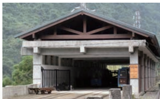
▲烏來台車列車更新設計製造

G、為提升行車營運安全，烏來台車執行地下油槽清洗、檢測及管線球閥檢驗工作；另外也定期舉辦台車在職人員緊急救護演練，以隨時應付緊急事件。