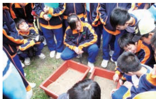
▲自然教育中心帶領學員透過實際操作，了解土石流的成因及可能的衝擊

本局自然教育中心未來將持續累積發展經驗，建立交流機制，結合更多元且有意願推動環境教育之個人與組織，共同推動全民參與、終生學習的環境教育工作，打造「師法自然、快樂學習」的優質自然教育場域。