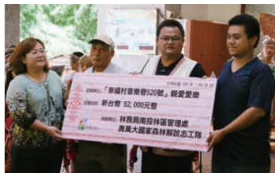
▲南投林區管理處國家森林志工透過義賣活動，協助偏鄉學校推動音樂教育

志願服務屬自發性的自我奉獻，以利他非營利的態度促進個人、團體或社會福祉為目標，於現今公部門資源有限之情況下，有效運用志願服務人力，妥善結合公私資源，協力經營並維護優良的國家森林環境，是本局未來業務推展重要方向之一。