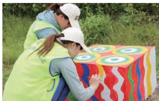
▲屏東林區管理處運用學生志工彩繪林後四林平地森林園區，以傳統原住民圖騰美化園區