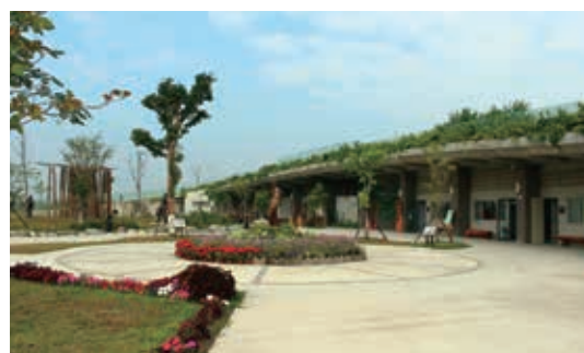
▲林後四平地森林園區－遊客中心（彎月造型之綠建築）為眺望大武山系的最佳處

為大武山低海拔自然森林，園區保有早期臺糖火車之鐵道，且鄰近「崑崙坳古道」之內社登山口，可作為山域、平原環境修復的生態園區，發展地方創意產業與文化體驗。