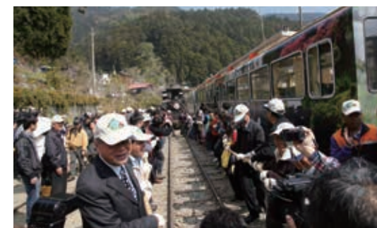
▲民眾共同拉動18號蒸汽老火車頭，迎接首航列車