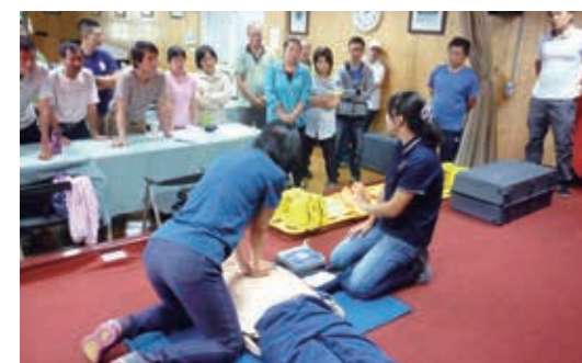
▲每年固定辦理緊急救護訓練，提升員工應變能力

(3) 為加強森林遊樂區旅遊安全緊急應變效能，建置防救災緊急通訊系統，各森林遊樂區並研訂緊急救護計畫、連續假期出現大量人潮安全管理對策及加強遊客安全教育；另為強化員工緊急應變能力及專業技能，各森林遊樂區均定期辦理消防、衛生等安全檢查及基本急救訓練、緊急救難演練，並依規配置第一線救護人員或救護技術員。各林區管理處共辦理 23 場次緊急救護訓練或演練，參加人數計有 743 人次。