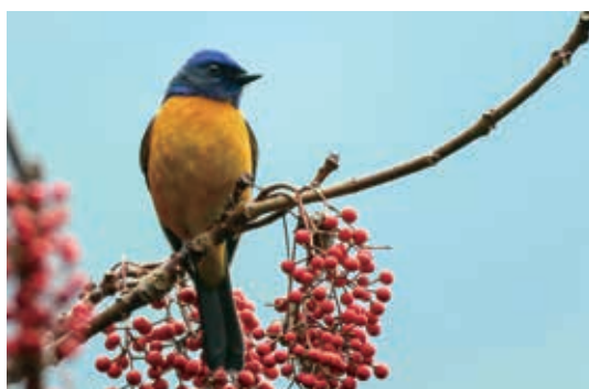
▲大雪山鳥相豐富，吸引國內外賞鳥人士前往

4、八仙山、太平山歡慶林場百年，雙雙舉辦百年紀念系列活動，太平山並配合出版2本書籍「桃色之夢」及「羅東林鐵·蒸情記憶」，同時進行太平山「春寒」電影數位修復計畫、辦理電影地景森態小旅行等主題活動，推動林業文化深度旅遊。