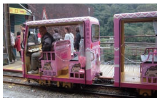
▲烏來台車車庫改善工程

為提昇服務品質及形象觀感，規劃辦理新製台車車體等工程，於 103 年度完成 1 輛粉紅櫻花豬圖案車體，深受民眾好評；目前正更新製作 2 輛，預計於 104 年 6 月底完工 2 輛，年底再完成 2 輛。