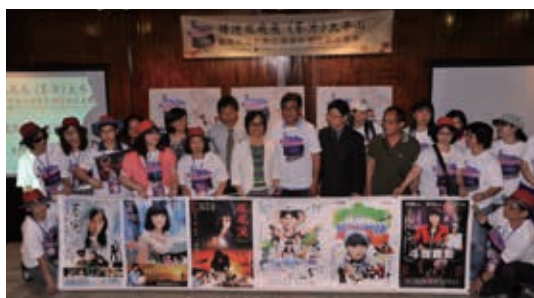
▲太平山百年系列活動之一－【春寒】電影修復及電影小旅行

4、八仙山、太平山歡慶林場百年，雙雙舉辦百年紀念系列活動，太平山並配合出版2本書籍「桃色之夢」及「羅東林鐵·蒸情記憶」，同時進行太平山「春寒」電影數位修復計畫、辦理電影地景森態小旅行等主題活動，推動林業文化深度旅遊。