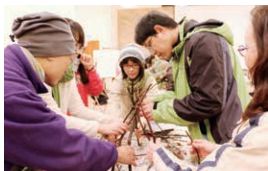
▲自然教育中心透過專業研習培力內、外部自然環境教育從業人員

(6) 本局於 99 年度與具 67 年推動環境教育經驗之英國田野學習協會簽訂合作備忘錄，且據以著手規劃相關訓練、課程及出版物翻譯等事宜。本年度執行合作備忘錄第四年行動方案，包括辦理「環境學習中心營運管理專業論壇」，就「產品定位與品牌建立」、「營運模式與管理架構」、「英國環境學習組織推動國家環境教育政策之遊說行動」等與國內環境學習中心經營者分享經驗，約 100 人次參與。另借鏡該協會經驗，研擬本局自然教育中心安全管理實務操作守則草案，進一步完備現行的安全管理策略。