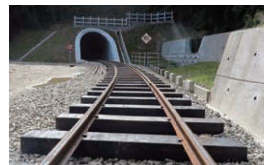
▲森林鐵路多林隧道完工照片