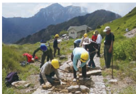
▲本局同仁親手修復步道，累積步道管理經驗

「手作步道」係以人力方式運用非動力工具輔助進行施作，降低對生態環境的擾動，以增進步道的永續性與整體性。102年起，本局與台灣千里步道協會合作，著手建立手作步道維護種子師資訓練與認證制度。103年共辦理2梯次訓練活動，讓同仁透過實地訓練，了解如何以手作的方式建置及維護工作。