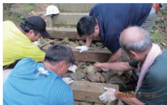
▲新竹林區管理處步道維護志工協助打造更安全的步道環境