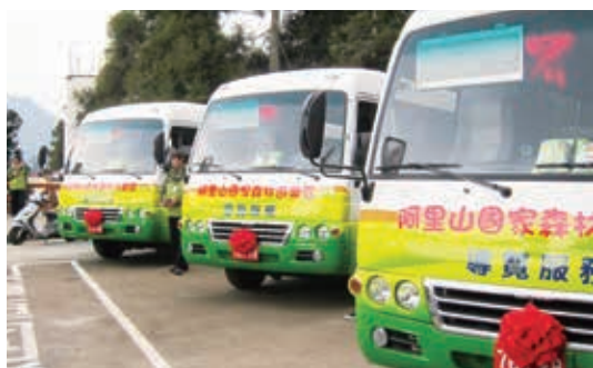
▲阿里山森林遊樂區遊園車為國內率先採用合法掛牌之電動中型巴士，積極減少碳排放

起，改換為電動中巴營運，成為國內率先採用合法掛牌之電動中巴作為遊園車種之森林遊樂區。