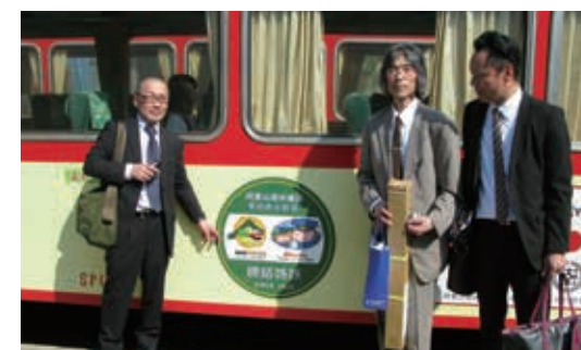
▲黑部峽谷鐵道技術人員來訪姊妹鐵路