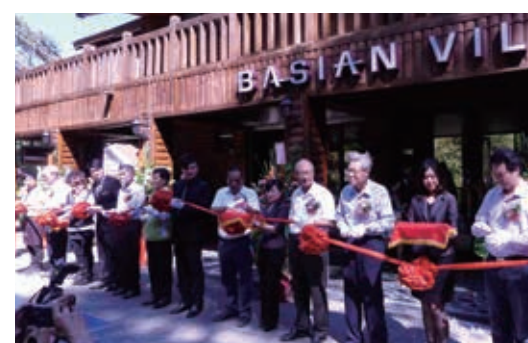
▲八仙山莊於 103 年完成委外營運，重新開幕