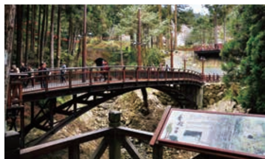
▲阿里山人車分道工程新建舟型跨橋，以「諾亞方舟夢想起飛」意向橫跨阿里山溪流

103 年度辦理太平山等 18 處森林遊樂區內公共服務設施規畫及興建工程，改善區內景觀美質、型塑優質之旅遊環境，並完成森林遊樂區公共服務設施及景觀改善工程 12 件，其中「祝山林道人車分道三期興建工程」、「阿里山森林遊樂區第一執勤室等整修工程」榮獲「102～103 年度優良農業建設工程獎」，而「祝山林道人車分道三期興建工程」更有效解決園區 30 年來人車爭道之問題，深受遊客及當地居民肯定及讚賞。