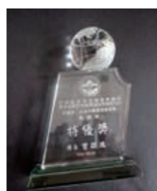
▲(圖20)本局屏東林區管理處辦理「雙流自然教育中心」榮獲屏東縣政府「第3屆國家環境教育獎」特優獎