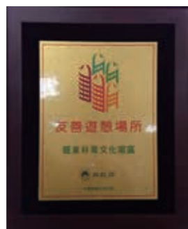
▲(圖 9) 本局羅東林區管理處羅東林業文化園區，榮獲內政部評選為友善遊憩場所

六、本局羅東林區管理處羅東林業文化園區活化再利用，因應年入園 80 萬名遊客，進行軟硬體修繕及環境維護，並榮獲內政部評選為友善遊憩場所。(圖 9)