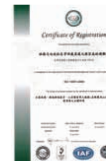
▲(圖 16) 本局南投林區管理處奧萬大國家森林遊樂區於 103 年 6 月 16 日取得環境管理系統(ISO14001)「生態遊、環境解說教育、山居餐宿等之服務；並維護高山自然遊憩資源之永續利用」認證

十四、本局南投林區管理處奧萬大國家森林遊樂區於 103 年 6 月 16 日取得環境管理系統(ISO14001)「生態旅遊、環境解說教育、山居餐宿等之服務；並維護高山自然遊憩資源之永續利用」認證，並於 103 年 12 月 6 日獲頒南投縣政府「綠色觀光評比環保資源回收績優單位」。(圖 16、17)