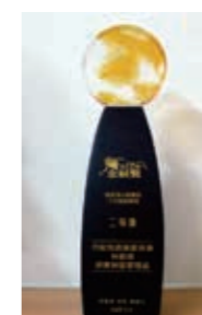
▲(圖24)本局屏東林區管理處榮獲行政院勞動部「103年第12屆金展獎進用身心障礙者績優機關二等獎」

二十六、本局屏東林區管理處榮獲行政院勞動部「103年第12屆金展獎進用身心障礙者績優機關二等獎」。(圖24)