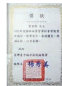
▲(圖 15) 本局東勢林區管理處配合法務部社會勞動役政策，督導人員曾技士登新榮獲臺中地方法院檢察署獎狀表揚

十三、本局東勢林區管理處配合法務部社會勞動役政策，爭取社會勞動人在東勢林業文化園區執行刈草等工作，103 年共有 32 人次履行完畢，計 8,084 小時，節省公帑約 135 萬元，督導人員曾技士登新榮獲臺中地方法院檢察署獎狀表揚。(圖 15)