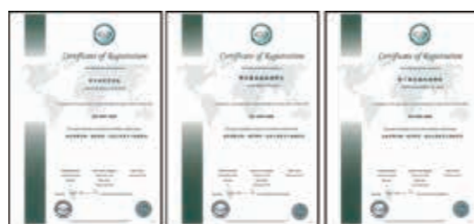
▲(圖22)本局屏東林區管理處辦理「墾丁及雙流國家森林遊樂區」通過ISO 9001:2008國際驗證評鑑

二十三、本局屏東林區管理處辦理「墾丁及雙流國家森林遊樂區」通過ISO 9001:2008國際驗證評鑑。(圖22)