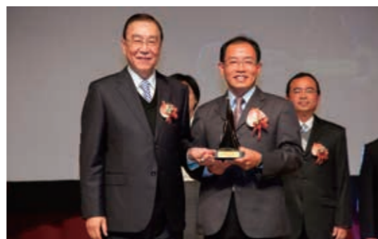
▲（圖3）本局嘉義林區管理處「阿里山區第194林班野溪整治工程」榮獲第14屆公共工程金質獎，工程會許主委俊逸與嘉義林區管理處廖處長一光合影

四、本局榮獲行政院農委會『優良農業建設工程』獎，優等工程計12件，佳作工程計12件；優等工程分別為新竹林區管理處「大鹿林道士場橋新建暨周邊蘇力颱風災害復建工程」、南投林區管理處「103年度社頭鄉保安林野溪整治工程」及「眉溪集水區第1期國有林地整治工程」、嘉義林區管理處「阿里山生態教育館整修工程」、「玉井區第69林班亞美坑崩場地整治二期工程」、「玉井區第69林班亞美坑崩場地整治三期工程」、「阿里山區第194林班野溪治理工程」、「祝山林道人車分道三期興建工程」及「裝置藝術創作工程」、屏東林區管理處「林後四林園區供水設備及管線工程」及「老人南溪整治二期工程」及花蓮林區管理處「林田山林業文化園區林業生活館整修工程」；佳作工程分別為東勢林區管理處「十文溪第六期治理工程」、南投林區管理處「103年度巒大區6林班野溪整治工程」及「巒大6林班國有林地野溪治理工程」、嘉義林區管理處「阿里山森林遊樂區第一執勤室等整修工程」、「大埔區第125林班崩場地治理工程」、「森林鐵路49k+780~50k+100路基修復工程」及「鰲鼓濕