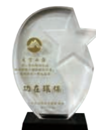
▲(圖 14) 本局東勢林區管理處大雪山國家森林遊樂區大雪山莊榮獲環保署頒發「功在環保」獎座

十二、本局東勢林區管理處大雪山國家森林遊樂區大雪山莊積極推動環保旅店計畫成果傑出，代表臺中市領取環保署 103 年 11 月 10 日頒發「功在環保」獎座。(圖 14)