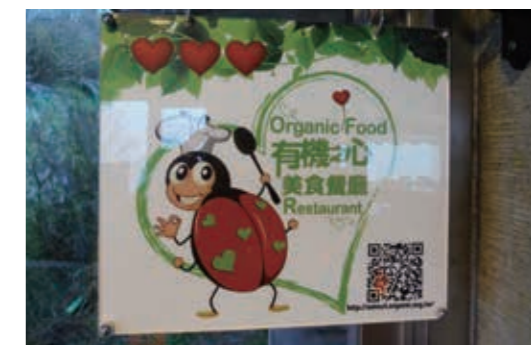
▲（圖8）農糧署「有機之心 美食餐廳」計畫，太平山莊認證餐廳為三顆心認證