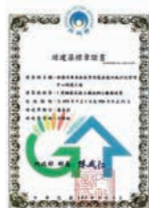
▲(圖21)本局屏東林區管理處辦理「林後四林行政管理中心新建工程」獲內政部頒「合格級綠建築標章」

二十二、本局屏東林區管理處辦理「林後四林行政管理中心新建工程」，獲內政部頒「合格級綠建築標章」。(圖21)