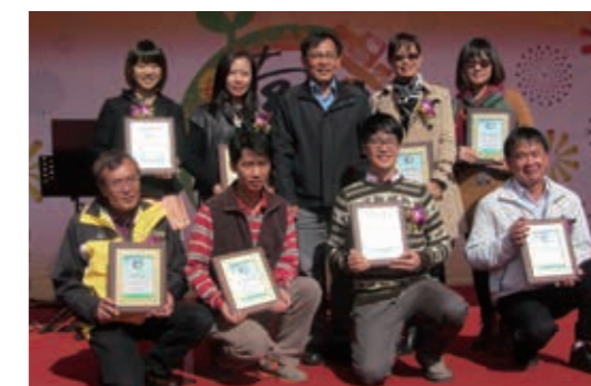
▲(圖 17) 本局南投林區管理處奧萬大國家森林遊樂區於 103 年 12 月 6 日獲頒南投縣政府「綠色觀光評比環保資源回收績優單位」

十五、本局南投林區管理處奧萬大自然教育中心於 103 年 10 月 27 日榮獲第三屆「國家環境教育獎」南投縣政府初審機關組特優獎。(圖 18)