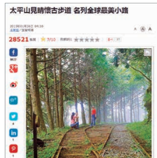
▲(圖 10) 本局羅東林區管理處太平山「見晴懷古步道」，網載名列全球最美小路

七、本局羅東林區管理處建構自然步道系統，落實維管，其中「見晴懷古步道」及「鐵杉林自然步道」分別列選為「全球最美 28 條小路，只求此生與你一起走過！」及「全球最美的 30 條小路，一定要去的遠方！」瘋傳網文。(圖 10)