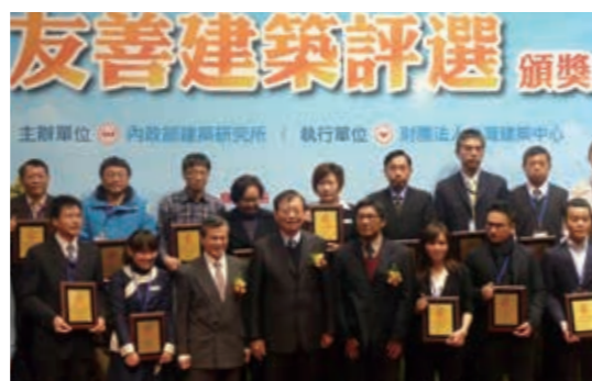
▲(圖19)本局嘉義林區管理處阿里山森林遊樂區、臺東林區管理處知本森林遊樂區於103年12月19日獲得內政部「友善建築遊憩場所」肯定

二十一、本局屏東林區管理處辦理「雙流自然教育中心」榮獲屏東縣政府「第3屆國家環境教育獎」特優獎。(圖20)