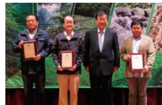
▲（圖4）本局南投林區管理處「眉溪集水區第1期國有林地整治工程」獲頒農委會「優良農建獎」受獎照片

地森林園區串連生態體驗步道二期工程」、花蓮林區管理處「嘉農溪梳子壩加強工程」、屏東林區管理處「恆春40林班老佛崩場地處理二期工程」及「林後四林平地森林園區森林舞台設施及周邊景觀工程」及羅東林區管理處「太平山莊蘇拉颱風坡面滑動抑制第一期工程」及「和區59、60林班邊坡蘇拉颱風復建工程」。（圖4、5）