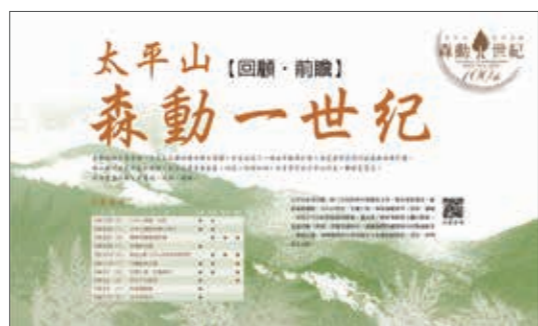
▲(圖 11) 本局羅東林區管理處自辦跨年度「太平山森動一世紀系列活動」邀請卡及活動資訊

發現史」、「森林護管員 守護森林之戰特展」、「生態工程 友善森林特展」6 場，計有 16,000 人次參與，結合社群網站行銷，除提升整體形象、品質及績效外，也創下與國家電影中心跨域合作創始、本局首次出版自然史出版品、森林護管員、生態工程創展。(圖 11)