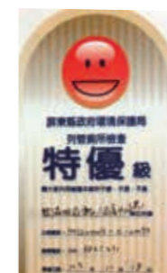
▲(圖23)本局屏東林區管理處辦理「墾丁國家森林遊樂區公廁」榮獲屏東縣政府「評選103年特優公廁」

二十四、本局屏東林區管理處辦理「墾丁國家森林遊樂區公廁」榮獲屏東縣政府「評選103年特優公廁」。(圖23)