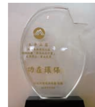
▲（圖7）環保署「推廣綠色消費優良環保旅店」獎項