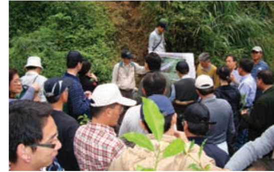
▲邀請檢察官親臨盜伐現場瞭解山老鼠盜伐林木及破壞水土保持之情形

101年度計發生342件竊取森林主、副產物案件，人贓俱獲並移送法辦者270件共526人，與100年度查緝370件，人贓俱獲293件，查獲人犯551人相較，發生件數減少28件，比例減少約8%，而林木損失材積亦減少114.81立方公尺，已逐步展現遏止盜伐之效。