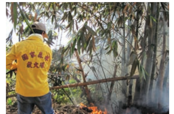
▲國家森林救火隊撲救森林火災