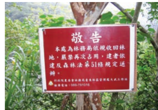
▲現場公告租地已收回

租造林地補償收回計畫」，本年度預定收回648公頃，實際收回1,293公頃。自92年至101年總計收回8,067.5707公頃，核發補償金2,699,393,391元。收回之林地納入整體國家森林經營計畫中妥善管理，視現場狀況，編列造林計畫予以人工復育或自然復育，以儘速恢復森林覆蓋，發揮公益功能，對於環境敏感地區及其他影響公共安全區域租地之水土保持及國土保安具有正面效益。