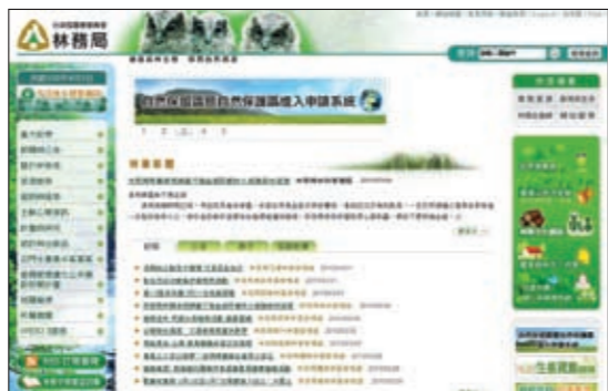
▲林務局全球資訊網入口網站

本年度本局全球資訊網及所屬機關入口網之到站訪客數總計1,295,202人次；網頁瀏覽量計3,858,604頁；網頁資料更新頁次數部分，達9,591頁次。