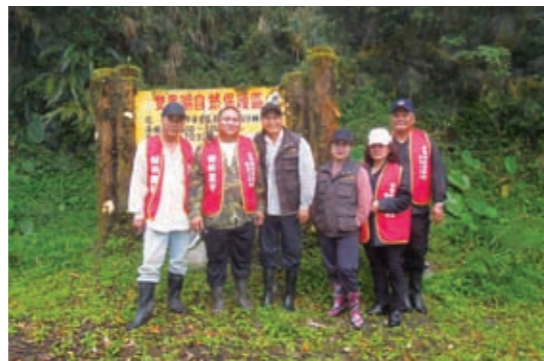
▲社區居民協助林班巡護工作

同時初步達到振興山村經濟之目標，101年度該8個社區共計執行林班巡視計1,259次，人次3,310次，協助本局查獲34件違反森林法及野生動物保育法等案件，其中有9件為竊取森林主、副產物並人贓俱獲之案件。