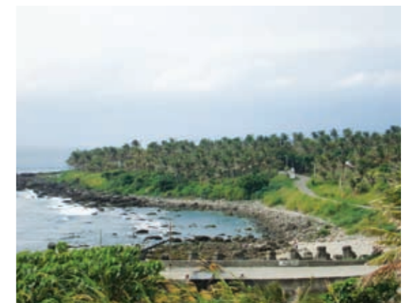
▲位於臺東縣成功鎮之漁業保安林

有鑑於區外保安林多鄰近都會區域或已規劃為風景區，保安林的維持與民生或觀光發展常有衝突，加以相關法規因時空變遷，部分不合時宜或難以執行，爰此，本局加速辦理區外保安林檢訂工作，以求儘速建立保安林基礎資料外，同時為強化法規內容並期更能配合相關政策，本年度並著手辦理「保安林經營準則」及「保安林解除審核標準」等法規修訂作業，以符合現況需求並更有效率解決保安林內違法違規問題。