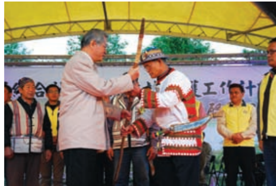
▲局長為社區巡護工作隊授杖

本局為加強森林巡護並有效遏止盜伐案件發生，期結合國有林班地附近之社區，藉由社區居民對於山區地形、地物熟悉，以及熱愛山林，且在「愛林、護林、保林」之理念下，於101年2月8日啟動「結合社區加強森林保護工作計畫」，邀集國有林地周邊8個社區（其中7個為原住民社區）協助林班巡護工作，使國有林地周邊社區（特別是原住民族社區）參與森林事務，成為協助巡護山林之守護者，