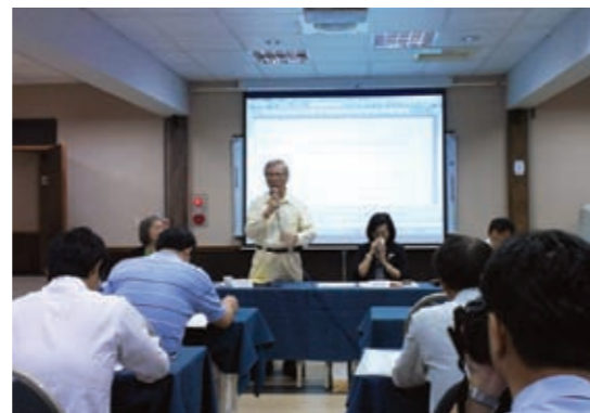
▲李局長親自參加檢、警、林聯繫會議

99年1月29日本局與臺灣高等法院檢察署共同訂定「檢察機關查緝森林盜伐執行方案」，有效整合檢察、警察及林務機關的整體力量，建立溝通聯繫平台，共同合作查緝盜伐集團，定期召開聯繫會報，並將易被盜伐區域、歷年盜伐竊嫌慣犯者等資料提供給各地方法院檢察署，俾利後續案件偵查，該方案實施以來，對於查緝、取締盜伐案件確有一定成效，從本局查獲盜伐案件之人贓俱獲率從96年之62%提高至101年之79%，顯見檢、警、林平台合作查緝成績，確實大幅提昇，成效卓著。