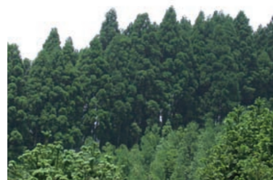
▲收回竹東區第10林班柳杉租地造林地