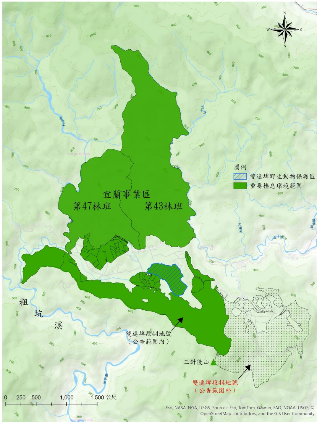
宜蘭縣雙連埤野生動物重要棲息環境範圍圖