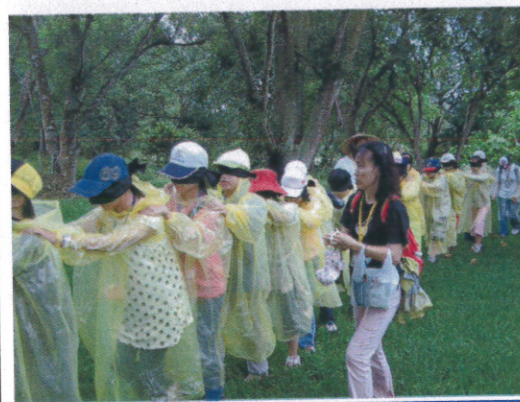
“生態遊戲” 相思樹林 矇眼感官體驗