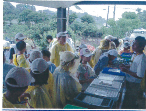
戶外蝴蝶生態導覽 - 幼蟲觀察