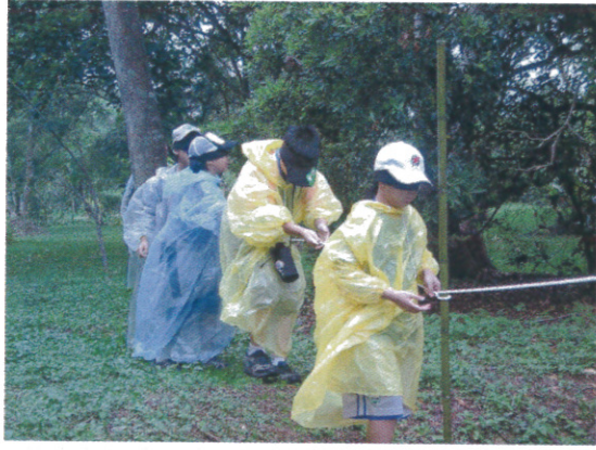
“生態遊戲” 矇眼拉繩想像力挑戰