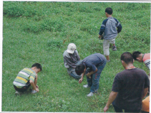
日本神社涼亭 種子素材採集