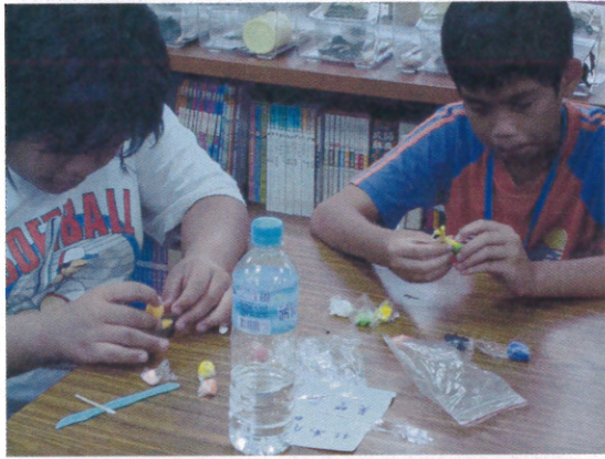
DIY 動手作 蝴蝶幼蟲創意創作