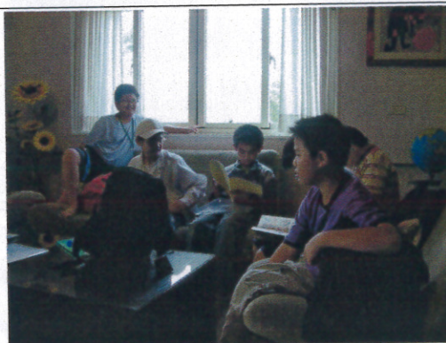
萬擘蝶坊民宿一覽