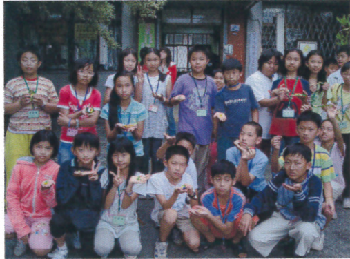
DIY 動手作 蝴蝶幼蟲創意作品秀