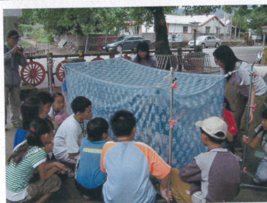
與蝴蝶的第一類接觸 - 標放