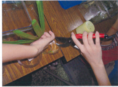
蝴蝶飼養(2) 練習食草植物修剪插瓶