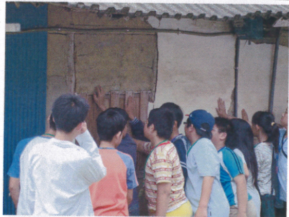
古老土角厝的觸摸體驗