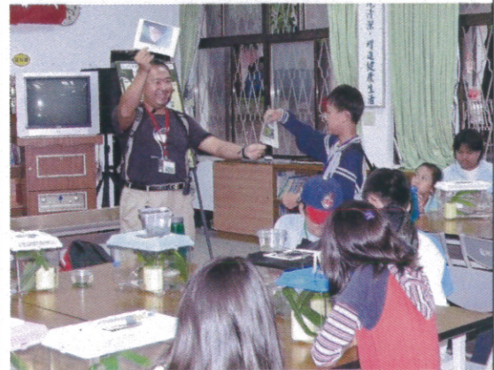
結業式 頒發結業證書