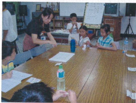
DIY 動手作 蝴蝶蛹吊飾製作示範