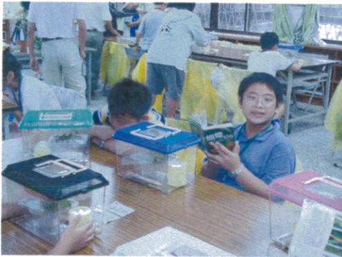
“蝴蝶飼養 (1)” 初拿到養蟲箱