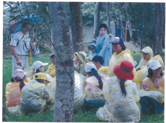
“生態遊戲” 分組賓果生態考驗