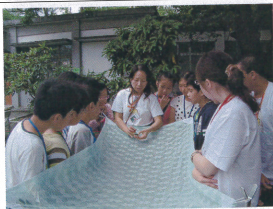
與蝴蝶的第一類接觸 - 標放