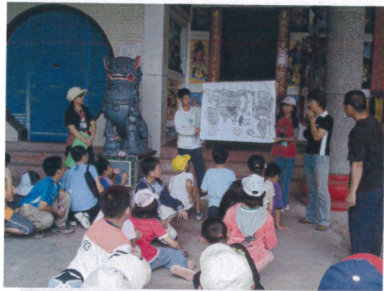
崑慈堂 世界地圖問答