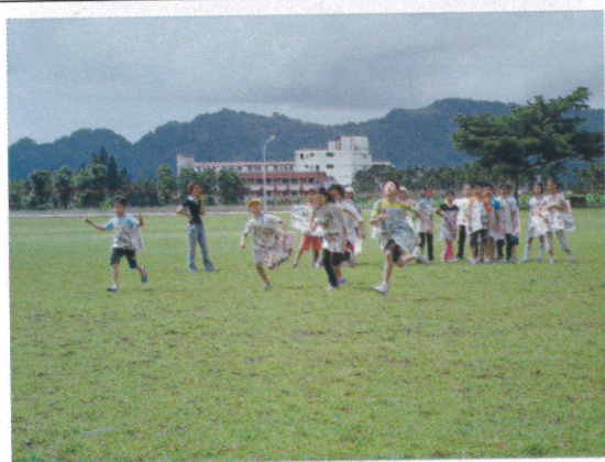
飛行傘降落大草地 報紙飛行體驗