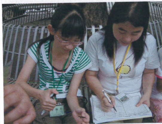
與蝴蝶的第一類接觸 - 標放