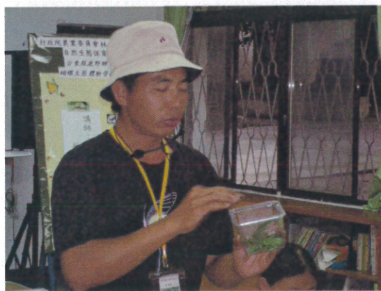
蝴蝶飼養(2) 講師示範