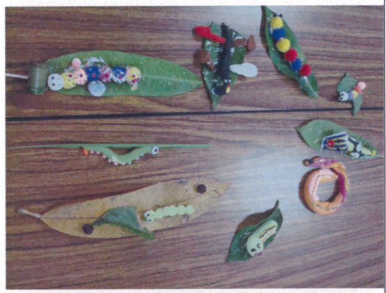
DIY 動手作 蝴蝶幼蟲創意作品陳列