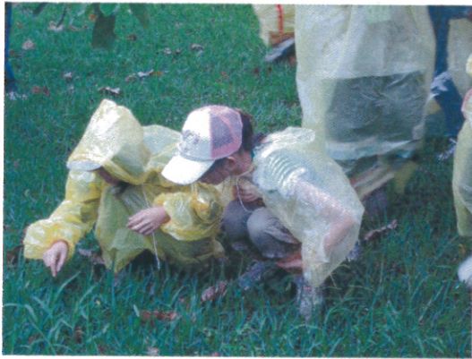
“生態遊戲” 個人生態觀察力考驗