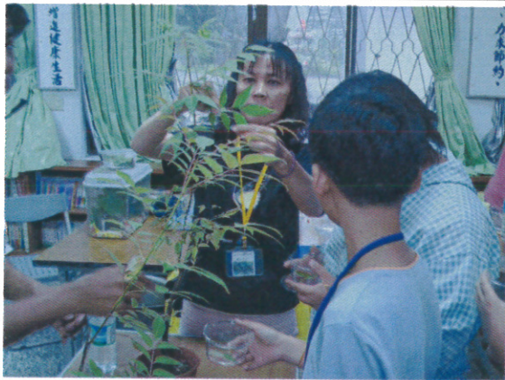
“蝴蝶飼養 (1)” 實務練習