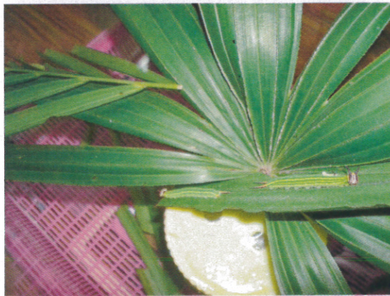
蝴蝶飼養(2) 紫蛇目蝶幼蟲