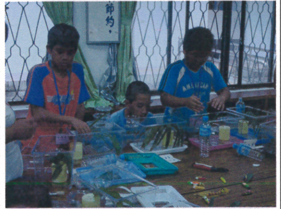
練習移動紫蛇目蝶幼蟲至食草植物