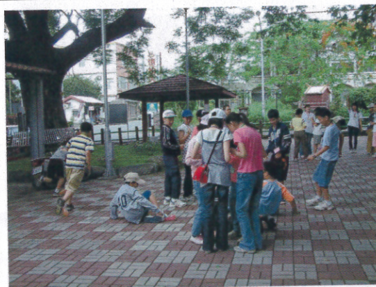
相見歡 踩汽球拿蝴蝶名