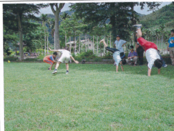
飛行傘降落大草地 翻滾體驗