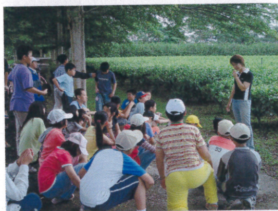
蝴蝶社區生態導覽 阿薩姆紅茶體驗