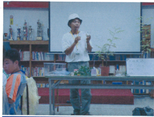
“蝴蝶飼養 (1)” 教學示範