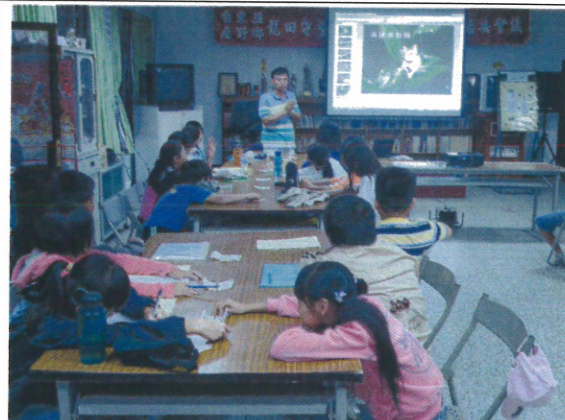
“夜間觀察” 兩棲類生態