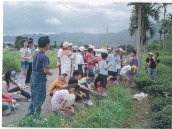
無毒茶園前 迴音的哲學