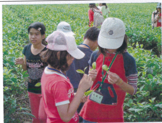
蝴蝶社區生態導覽 採捻茶菁