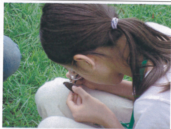
捕蝶後再次學習標放