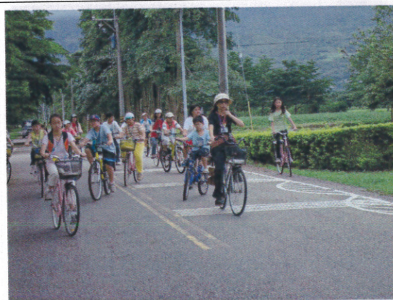
龍田道路植物生態解說