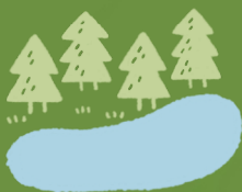
水土保持型保安林